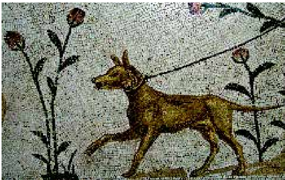
Detail van een mozaïek in het Bardo museum in Tunis.