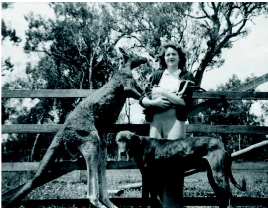
Een ongebruikelijke foto: een kangoeroe en een Kangaroo Hound, gewoonlijk twee vijanden.

Temperament: nasty disposition. Bij de jacht is een gevecht op leven en dood geen zeldzaamheid. Het bijzondere is dat er bij deze kangoeroejacht geen wapens worden gebruikt. Het is jagen en doden zonder dat er mensenhanden aan te pas komen. Hoewel er geen sprake is van zuiver gefokte lijnen, is er bij de Kangaroo Dog wel sprake van aparte bloedlijnen. In een land dat zo uitgestrekt is als Australië ontstaan bijna vanzelf aparte lijnen: de Deernbull, Western Australian Wheatbelt lijn, de Western Australian lijn en de South Australian Staghound. De site www.kangaroodog.org scheidt een beetje duidelijkheid in de chaos en heeft wat oude foto's van de Kangaroo Hound. In 1839 arriveert een Kangaroo Hound in de Zoological Garden in Londen en in 1864 worden er twee tentoongesteld door de Prince of Wales, als a curiosity , op de Second International Dog Show in Londen.