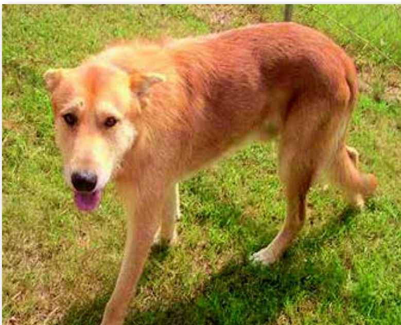
Kroatische Windhond. Een foto uit 2004.

Volgende keer: van Brazilië tot Griekenland ■