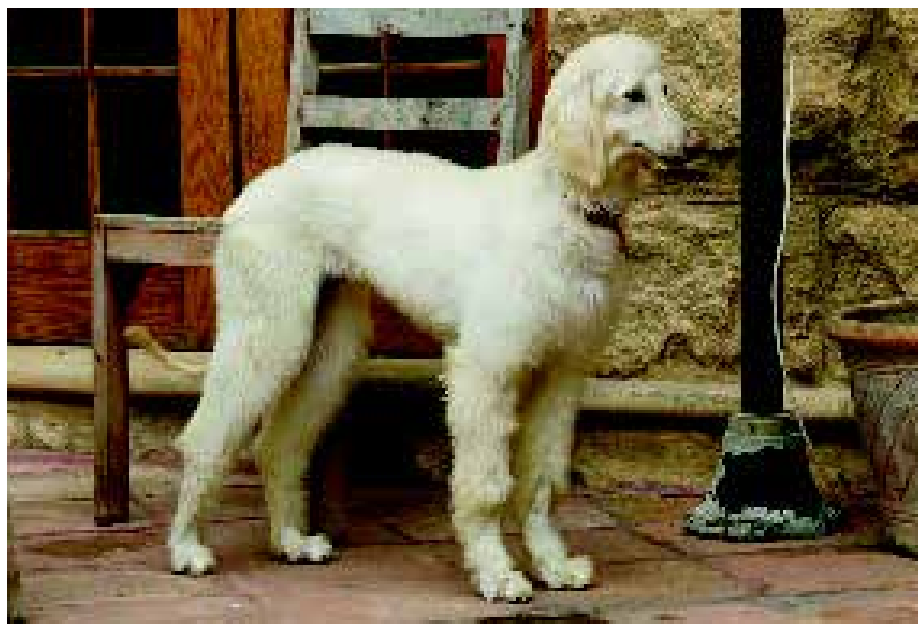
Een Afghaanse Windhond uit Khalag en Bakmul lijnen.

Afghanistan is niet het enige land van oorsprong voor deze types. In Kirgizië, Kazachstan, Turkmenistan en in andere delen van