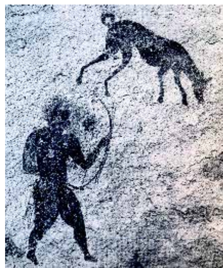
Een rotstekening in het Tassiligebergte in Tunesië uit de neolithische tijd – ruwweg van 12.000 tot 6.000 jaar voor Christus – toont een jager met zijn hond. De ringelstaart, prikoren, de lange benen, het slanke lichaam, het spits toelopende hoofd; het zijn allemaal kenmerken van Windhonden.

Uit de geschiedenis van hondenrassen blijkt vaak dat alleen de boven-