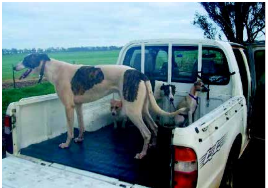
Een Roo Dog in de laadbak van een truck. De andere honden zijn ook 'windhonden types'.

De naam van deze hond is afgeleid van de Strathdoon kennels in Blacktown, New South Wales. Dit type is speciaal ontwikkeld voor de jacht op dingo's. Aan het einde van de 19de eeuw importeert een zekere Cecil Davies twee Deerhounds, in Engeland bekend van de tentoonstellingen: Lord Morag en Newton Spey . Daarmee start hij zijn 'Strathdoon' kennel en fokt in de loop der jaren meer dan 100 Deerhounds. Davies fokt ook Borzoi's en maakt promotie voor Deerhound x Barzoi puppies, die al snel 'Strathdoon Dingo Killers' worden genoemd en op dingo's en kangoeroes jagen. In de laatste jaren van de 19de en het in begin van de 20ste eeuw verspreidt dit 'ras' zich ook over