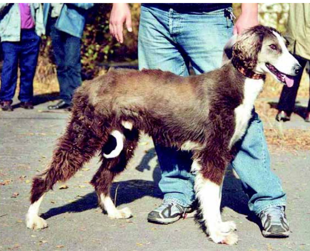
Een Tazi, de oorspronkelijke (naam voor een) Afghaanse Windhond.

afbeelding bij geplaatst. Over dat land van herkomst verschillen de bronnen regelmatig. Dat heeft veelal te maken met de geschiedenis, afscheidingen en de politieke situaties met steeds verschuivende grenzen. Soms wordt als land van herkomst de streek genoemd waar de meeste honden van een type voorkomen of zijn twee of drie landen samen het land van herkomst. Een mooi voorbeeld daarvan is de Braziliaanse Veadeiro Brasileiro, die naast Brazilië ook Uruguay en Argentinië als moederland heeft.