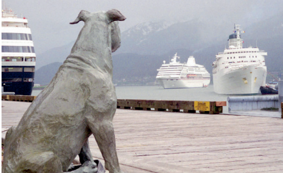
Het standbeeld van Patsy Ann, zittend op de kade, en wachtend op de cruiseschepen, die aanmeren in Juneau, Alaska.