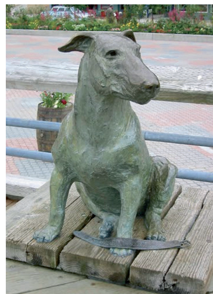
Het standbeeld van Patsy Ann. De halsband, met daarin een gegraveerde naam, ligt over de linker voorvoet, vastgespijkerd. Dat verwijst naar het steeds 'verliezen'.