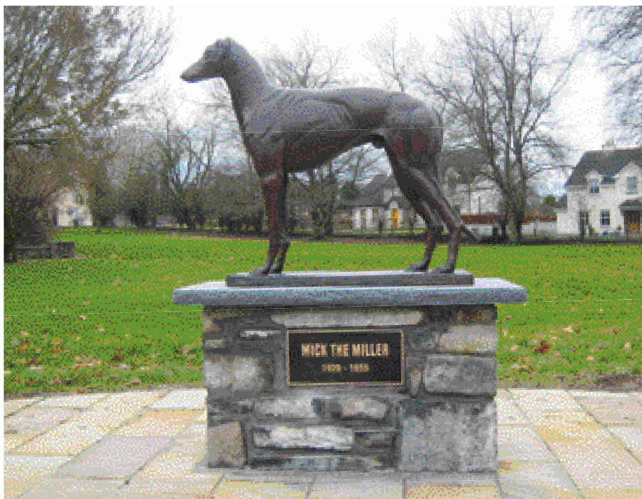
Mick the Miller – ‘considered to be the top U.K./Irish racer’ – op de Village Green in Killeigh, Ierland.