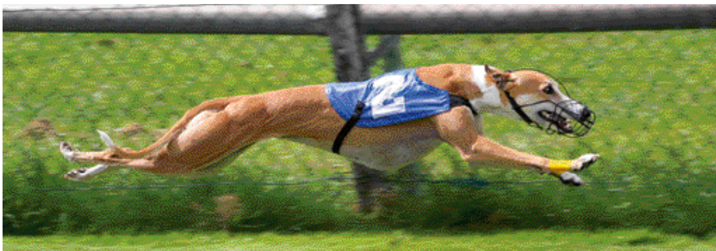
Greyhound racing, een adembenemende sport met honden.

staat Mick the Miller en kan ze hem opmeten en zijn anatomie bekijken. Het comité heeft haar elke afbeelding gegeven die men maar heeft kunnen vinden. Op 29 januari 2011 wordt het beeld van Mick the Miller onthuld door de Taoiseach (premier) van Ierland, Brian Cowen. Zo'n 400 inwoners van Killeigh en Greyhound liefhebbers wonen de plechtige onthulling bij. ■