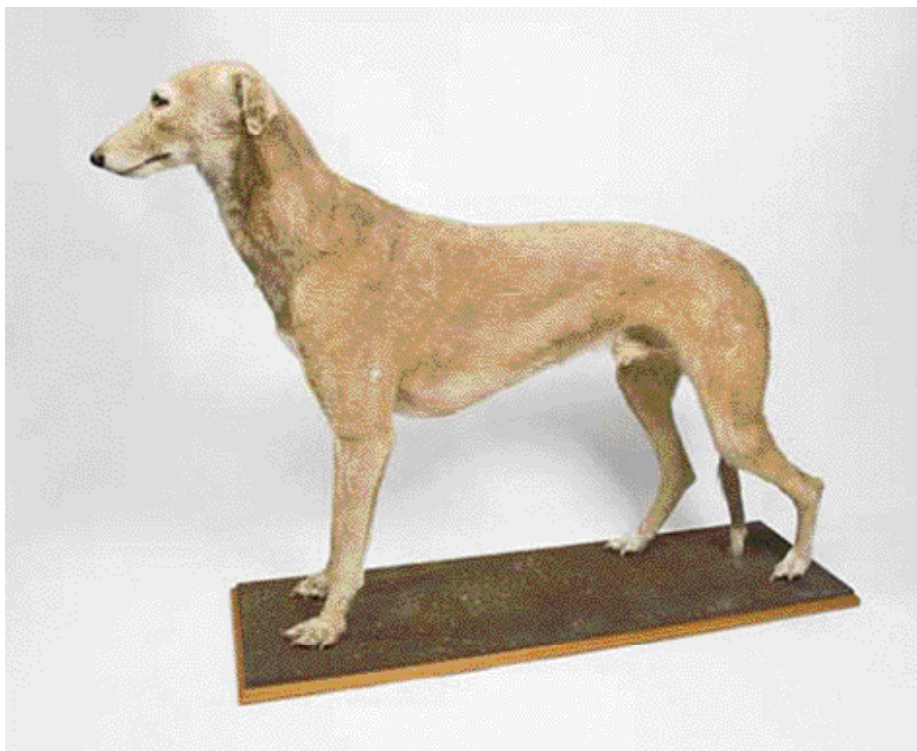
Mick the Miller in het Natural History Museum.

standbeeld moet worden. De gelden worden bijeengekregen door giften van de plaatselijke middenstand, donaties van inwoners van Killeigh en liefhebbers van Greyhounds. De Irish Greyhound Board draagt maar liefst £ 7.000 bij.