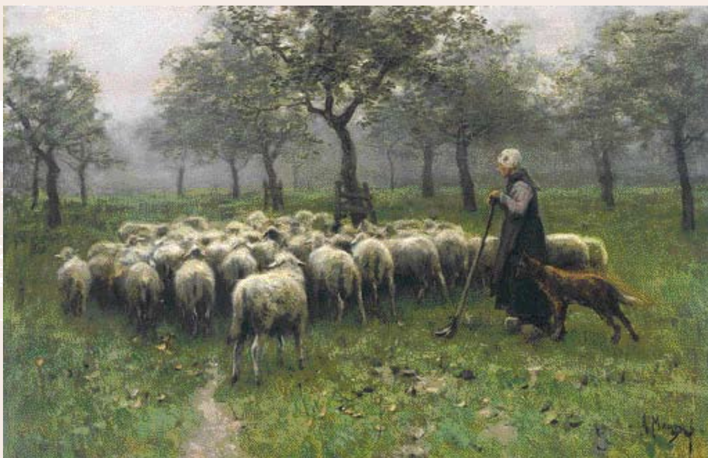
• 'Herderin met kudde schapen in een boomgaard' van Anton Mauve (1838-1888).

Ze spelen, rennen achter wild aan, verzorgen pups of kijken ons alleen maar aan: honden op schilderijen. Schilderstukken die onmisbaar zijn bij het ontrafelen van de geschiedenis van rashonden...