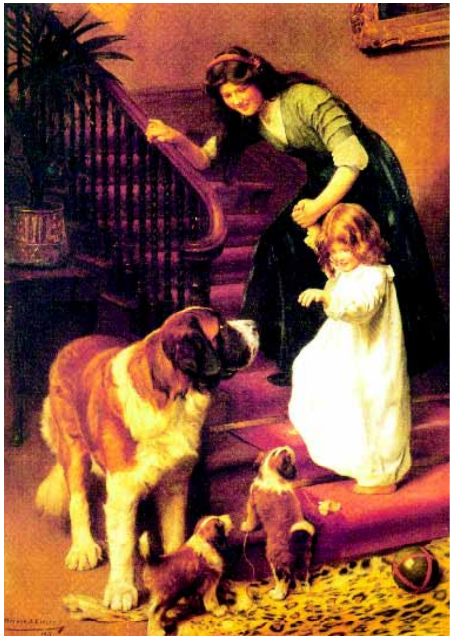
'Good night', een in 1911 door Arthur J. Elsley geschilderd tafereeltjes met pups. Ook een typisch voorbeeld van een Victoriaans genre schilderij.

Over de geschiedenis van het ras vóór 1600 is niets meer bekend dan dat het behoort tot de grote groep van zware dogachtigen, die overal in midden-Europa aanwezig zijn. De Sint Bernard ontwikkelt zich tot een apart type, ook dankzij het geïsoleer-