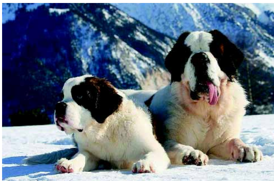
Op het vasteland van Europa wordt de Sint Bernard het meest in zijn oorspronkelijke omgeving afgebeeld.

Het verhaal over dit ras is niet compleet als 'Barry' niet wordt vermeld. Barry is een 'kloosterhond', die leeft van 1800 tot 1814, en volgens kenners redt hij in die 14 jaar meer dan 40 mensen. Barry is nu nog – opgezet – te zien in het Natuurhistorisch Museum in Bern. De oudste vereniging voor dit ras, de