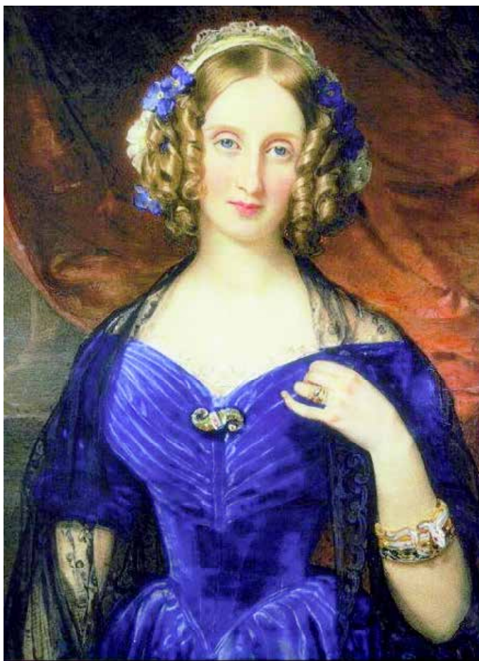
Koningin Louise-Marie van België (1812-1850). Zij bestelt bij Eugène Verboeckhoven het portret van haar Schipperke.