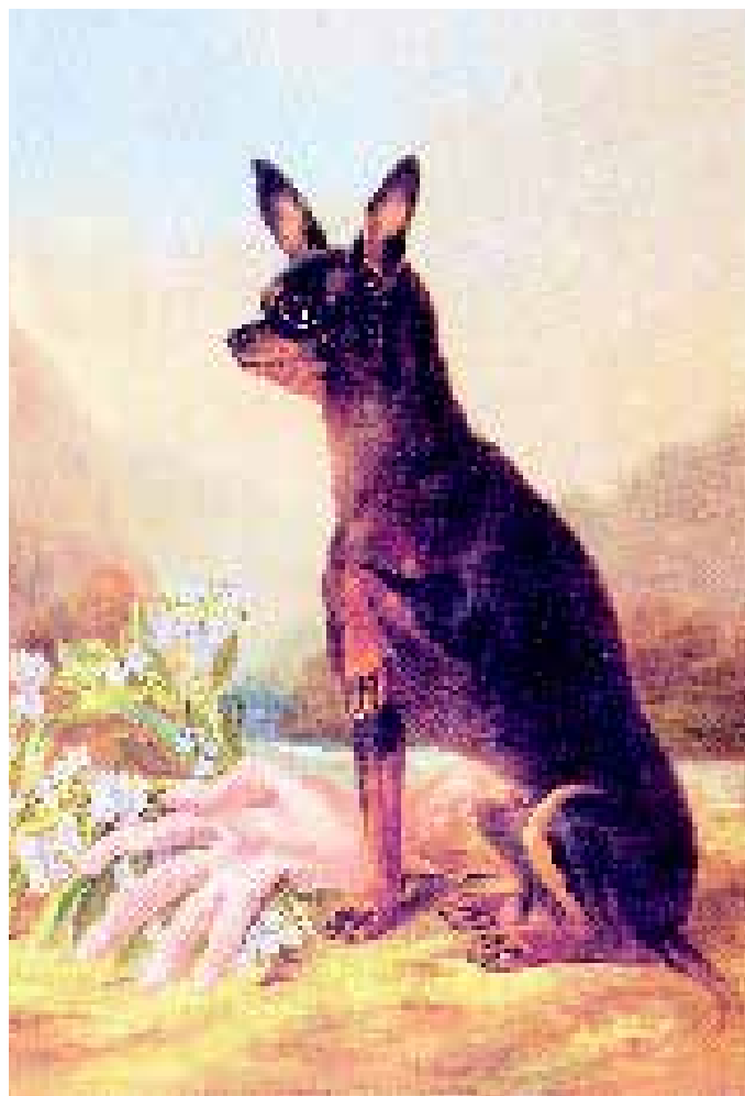
Koningin Marie-Henriëtte van België maakt deze schildering op hout van haar Schipperke, black and tan en met rechtop staande oren.