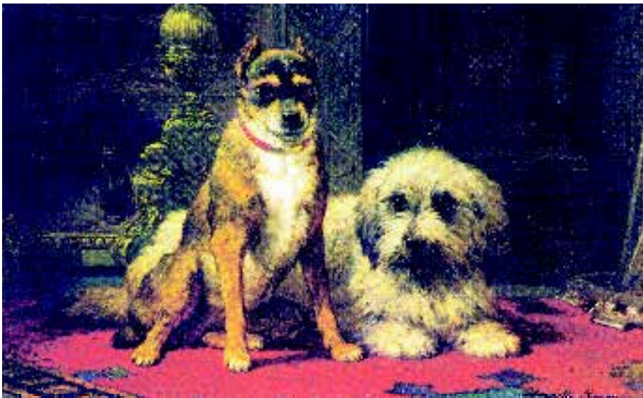
In 1867 schildert Henriëtte Ronner-Knip 'Goede vrienden'. Een Schipperke en een hond van een niet nader aangeduid ras. De Belgische Koninklijke familie verzamelt werk van Ronner-Knip. De titel 'Goede vrienden' komt meerdere keren terug bij Ronners werk.