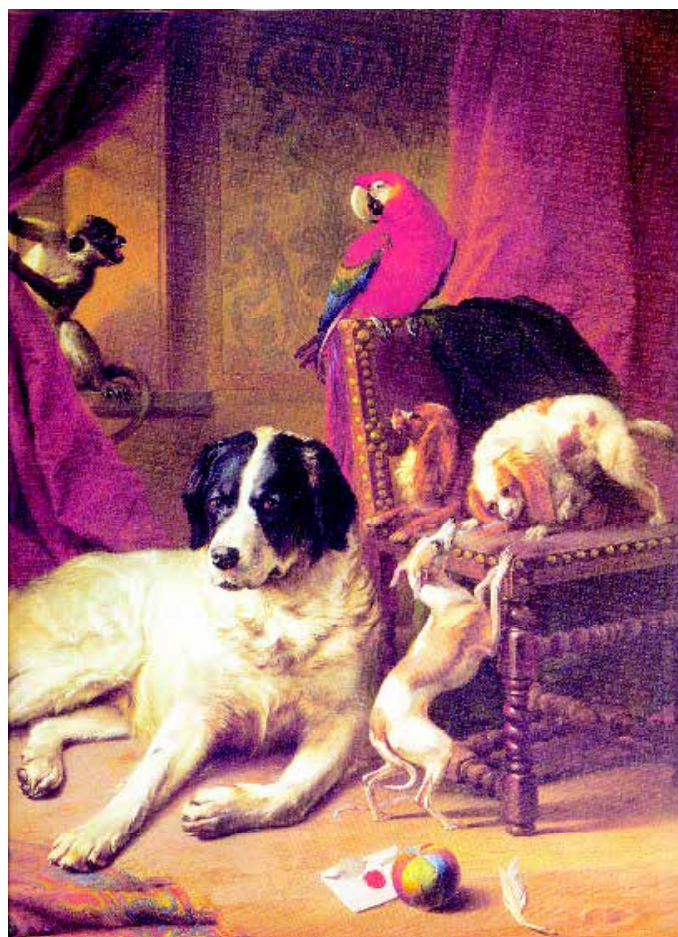
Verboeckhoven schildert in 1845 'De favoriete dieren van Leopold I'. (Museum van de Dynastie, Brussel, België).

Men denkt veelal dat de naam is afgeleid van het woord schipper, omdat de hond voornamelijk te zien zou zijn geweest op schepen van binnenvaartschippers. Zijn taak op het schip is het verdelen van ongedierte. De Engelsen zouden dit verhaal in zoverre hebben verzonnen dat ze wel kleine honden aan boord van schepen gezien kunnen hebben, maar dat dit Spitsen of Keeshonden zijn geweest. Een Schipperke in volle vacht lijkt immers wel op een kleine Keeshond. De tweede lezing is dat Schipperkes afstammen van oude, kleine, wolfachtige herdershondjes, die onder andere in de Belgische provincie Brabant bekend zijn. Hun naam zou afstammen van scheper, het oud-Vlaamse (maar ook oud-Nederlandse)