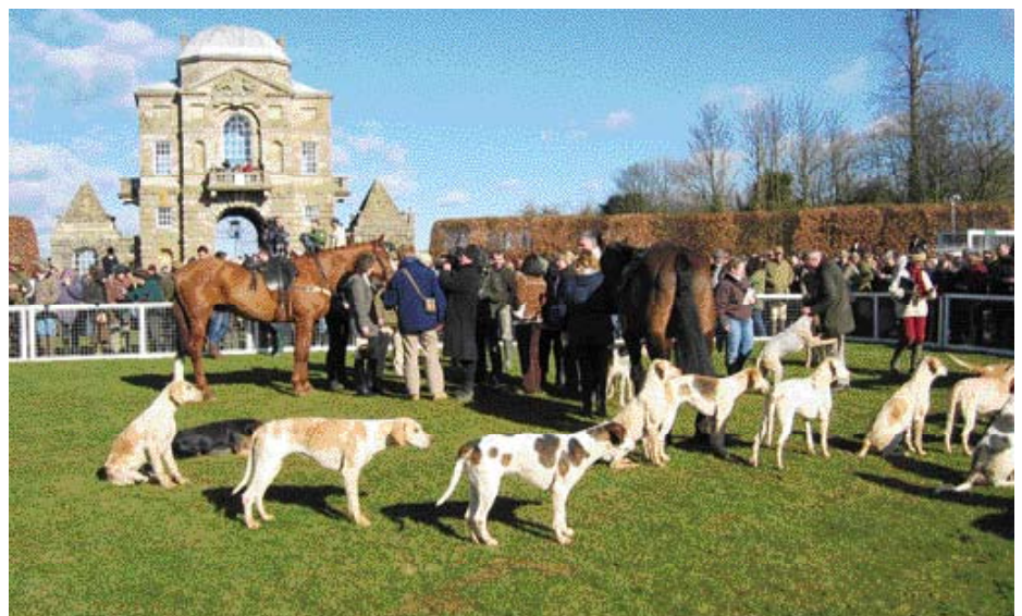
• The Meet van de Duke of Beaufort's Hunt bij Worcester Lodge in Gloucestershire (2006). De geschiedenis van de Foxhounds van deze Hunt dateert van 1640; het is één van de oudste en grootste meutes in Engeland.

The Meet is een onderwerp dat talloze keren op Engelse prenten, schilderijen en gravures wordt afgebeeld. Kleurrijke afbeeldingen met paarden en om hen heen, onveranderlijk, de honden. Bij de meet is iedereen is een tikje ongeduldig – zeker de honden – en wacht men op het startsein van de Master , wiens