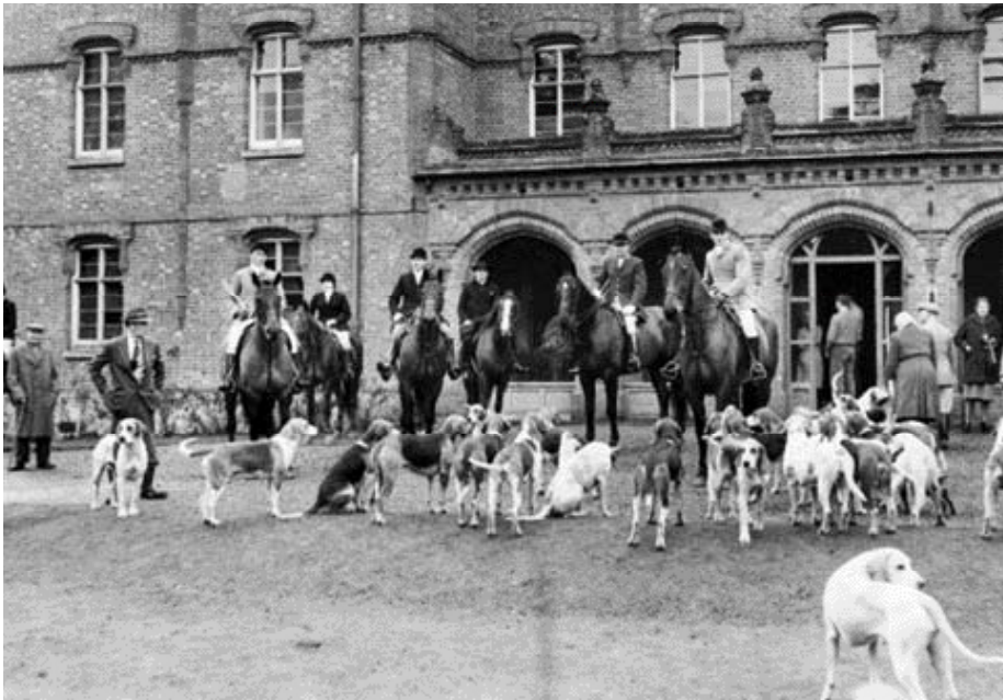
• The Meet van de Old Berkeley Hunt bij Hughendon Manor in Hughenden, Buckinghamshire, december 1959. (Foto: Ronald Goodearl).

woord wet is. Zonder diens toestemming zal geen jager het in zijn hoofd halen bij de meet te vertrekken.