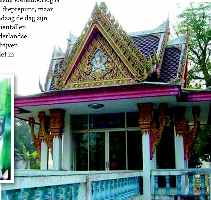
De Wat (= tempel) Bangkaew in de provincie Phitsanulok, de geboorteplaats van de Thai Bangkaew Dog.