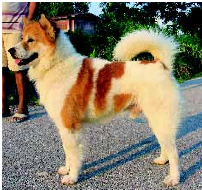
Kamp. Taro uit de ChumSangSongKram kennel.