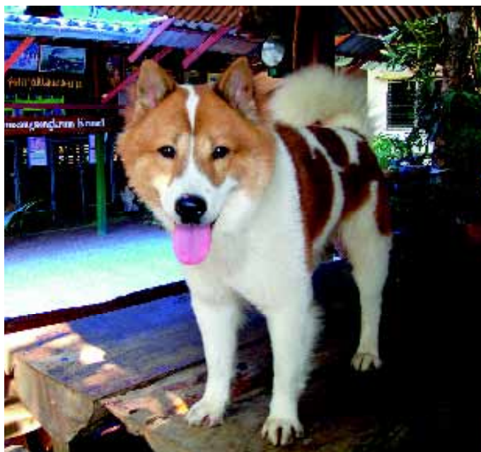
De Bangkaew Dog is vierkant van bouw, maar mag nooit laag op de benen staan.

honden. Sindsdien is Tongdaeng vrijwel altijd in het gezelschap van de koning en staat afgebeeld op elke koninklijke nieuwjaarswens. Tongdaeng belichaamt alles waarvoor ook de waarden van een traditionele Thai staan: beleefd, dankbaar, gehoorzaam en loyaal. De liefde van de koning voor Tongdaeng gaat zover dat hij in 2002 een biografie over haar – het is een teef – schrijft, zowel in het Thai als in het Engels. Het glossy, rijk geïllustreerde boek, met een oplage van 100.000 exemplaren, is binnen een paar uur uitverkocht. Tongdaeng is bescheiden en kent het protocol , schrijft de koning. Zo zal ze altijd – ook wanneer er wordt gespeeld – in een lagere positie blijven dan de vorst. Tongdaeng is zo populair in Thailand dat er zelfs T-shirts met haar beeltenis worden gemaakt. De liefde van de koning voor zwerfhonden in het algemeen en voor de zijne in het bijzonder heeft een diepere betekenis. Hij wil zijn onderdanen een spiegel voorhouden, met daarbij de boodschap dat