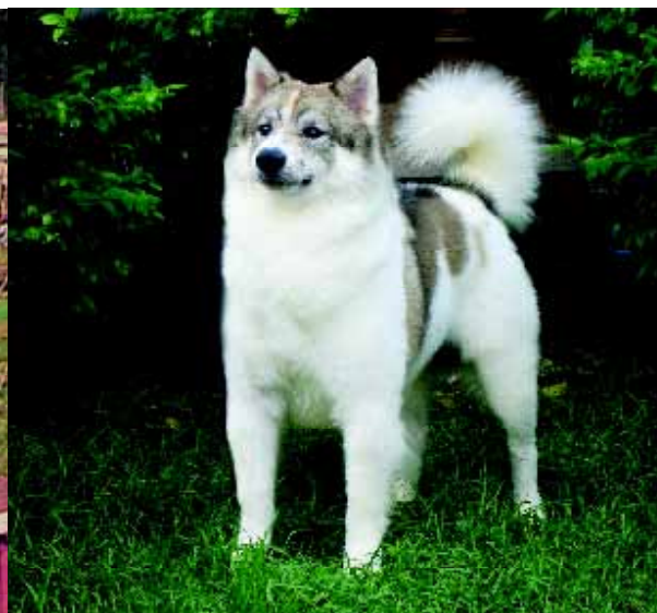
Woonboten bij Phitsanulok; nakomelingen van de eerste Thai Bangkaew Dogs vinden hier een thuis.