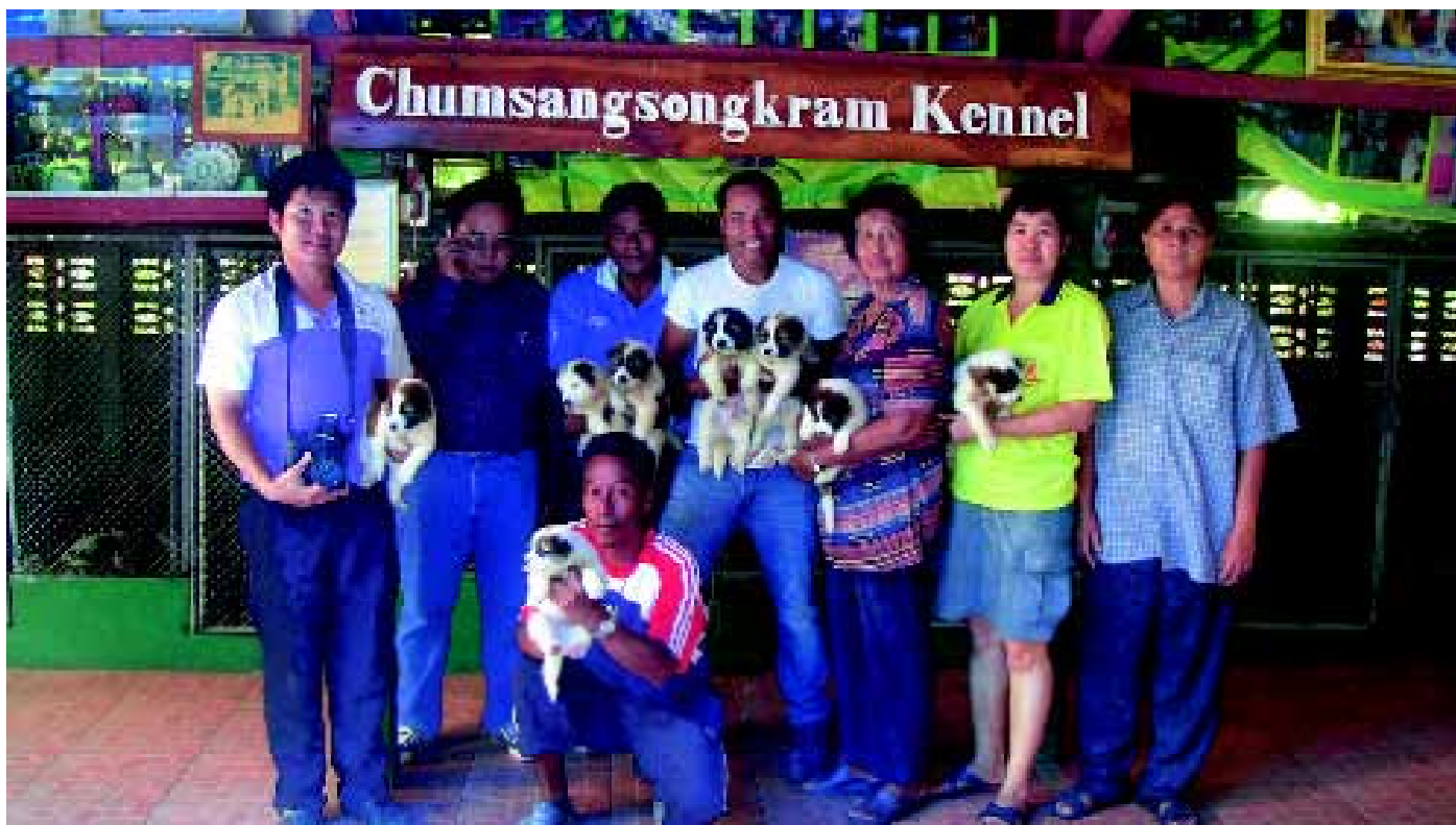
De medewerkers van de ChumSangSongKram kennel, waar zo'n twintig honden zijn gehuisvest.

district bij Phitsanulok, gelegen in de gelijknamige provincie, in centraal Thailand. Aan het begin van de vorige eeuw levert dit district veel hout op en komen er olifanten, jakhalzen en wilde honden voor. Bij het dorp en de Yom rivier ligt de Wat