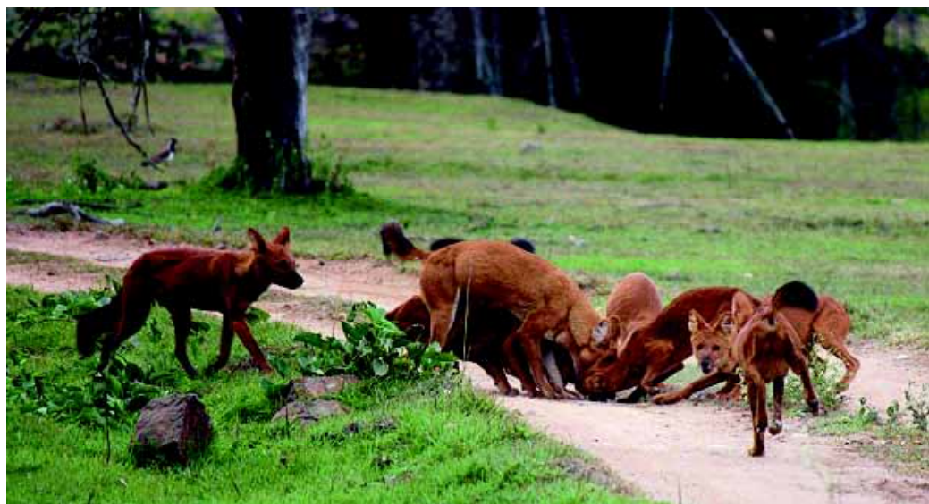
Als de teef van de Abbot drachtig is, gaat men er van uit dat een Aziatische wilde hond – een zogenoemde dhole – de vader is.

Ook de Japanse Hokkaido en Shiba, leden van de Aziatische keeshondenfamilie, doen aan de Thai Bangkaew Dog denken. Een ras dat sterk op de Bangkaew lijkt, is de Koreaanse Jindo en pups van de Karelische Berenhond en de Thai Bangkaew Dog zijn soms lastig van elkaar te onderscheiden. De Finse Spits en de Groenlandhond, bijvoorbeeld, laten zien dat er een oeroude relatie moet bestaan tussen de honden in het noorden op het westelijk halfmond met die van zuid-oost Azië op het oostelijk halfmond, waaronder de Thai Bankaew Dog.