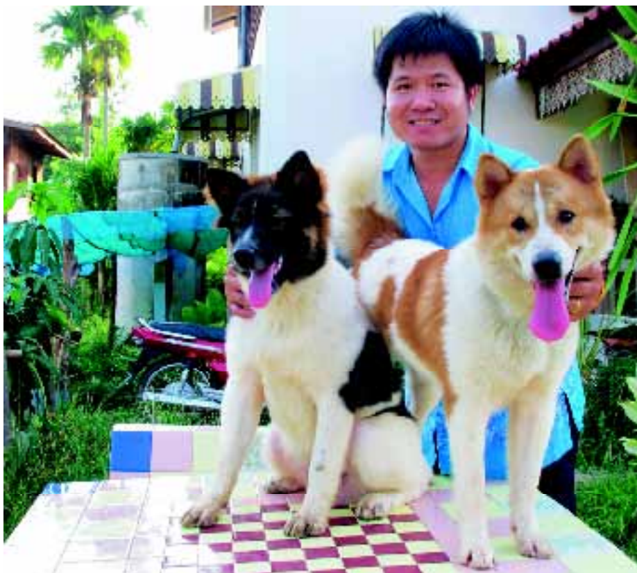
'Het wordt tijd voor ons om de wereld te vertellen dat ons nationale ras uit Phitsanulok topkwaliteit bezit.'

De sterke, wigvormige schedel mag breed, maar nooit grof zijn en staat in goede verhouding tot het lichaam. Er is een middelmatige stop. De voorsnuit heeft een zwarte neus, is breed aan de basis en wordt smaller naar het einde. Er wordt een schaargebit verlangd en tanden en kiezen moeten compleet aanwezig zijn. De ogen zijn middelmatig groot, zwart of donkerbruin van kleur. De driehoekige, puntige en rechtop staande oren zijn nogal hoog aangezet en staan niet te dicht bij elkaar.