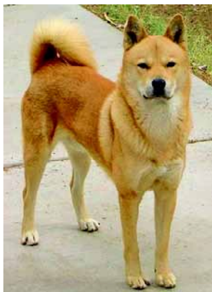
Een ras dat sterk op de Thai Bangkaew Dog lijkt is de Koreaanse Jindo.

Thailand, terwijl de beide koninklijke families op goede voet met elkaar staan. Van de Thai kan worden gezegd dat ze zich innemend en hoffelijk gedragen en dat ook van anderen verwachten.