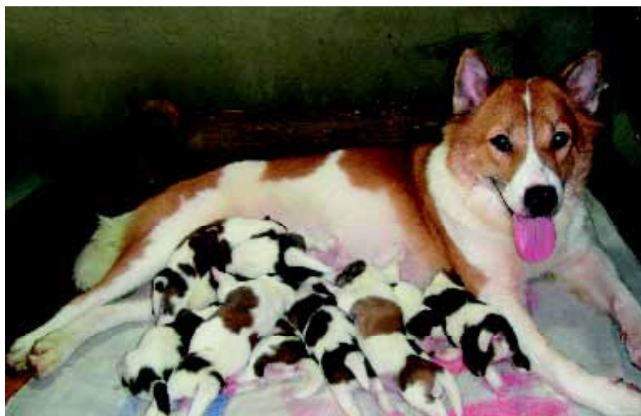
Op 14 april 2011 wordt de Thai Bangkaew Dog door de FCI voorlopig erkend.

In oktober 2010 wordt de vierdaagse F.C.I. Asian and Pacific Section Dog Show gehouden in het Exhibition and Convention Centre in Muang Thong Thani, een voorstad van Bangkok. De F.C.I. is uitgenodigd om op deze show een groep Thai Bangkaew Dogs te evalueren. Eigenaars van het ras worden uitgenodigd om hun honden voor deze speciale gelegenheid in te schrijven. De exposanten worden gelokt met de mededeling dat de koning drie bekertjes beschikbaar stelt, waaronder één voor de beste Bangkaew Dog. De organisatie besluit met de boodschap: Het wordt