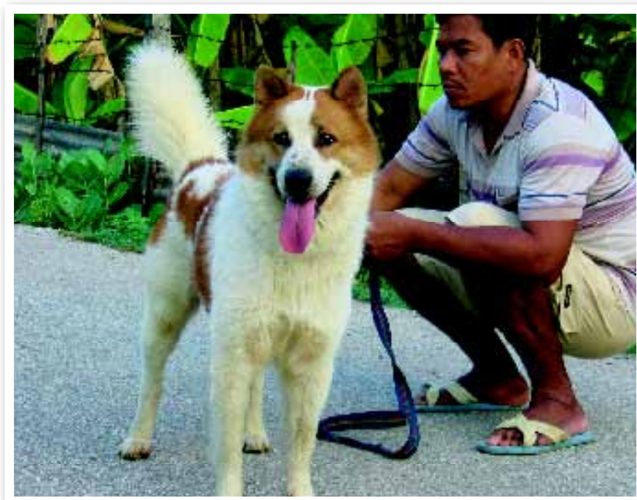
De Thai Bangkaew Dog wordt nu in alle delen van Thailand gefokt.

gefokt. In principe is het een gezelschapshond, maar het oude waak- en jachtinstinct is zeker niet verdwenen.