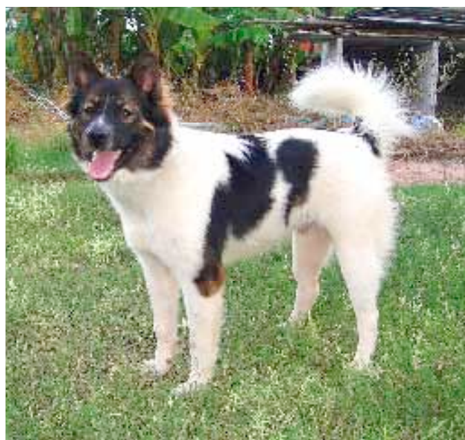
Het temperament van de Bangkaew Dog laat soms te wensen over.