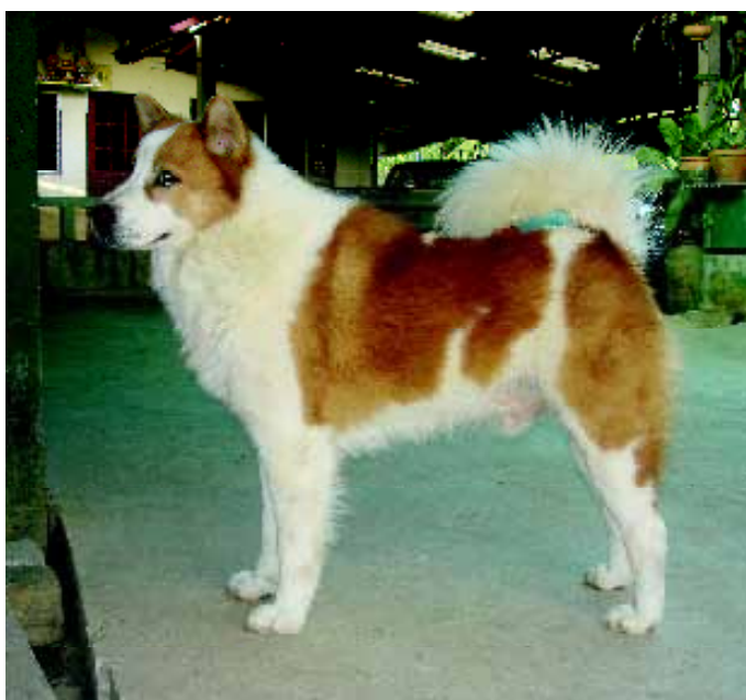
De inwoners van Phitsanulok zien de Bangkaew Dog als een waardevol stukje cultuurhistorie.