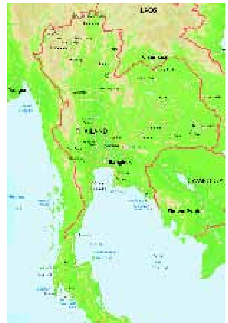
Kaartje van Thailand. Het dorp Bangkaew ligt ongeveer 375 kilometer ten noorden van Bangkok.