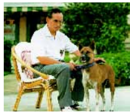
Koning Bhumibol van Thailand adopteert in 1998 de zwerfhond Tongdaeng.