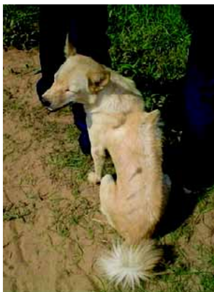
Buurland Cambodja kent de inheemse Razorback Dog, een Spitstype met een ridge op de rug.