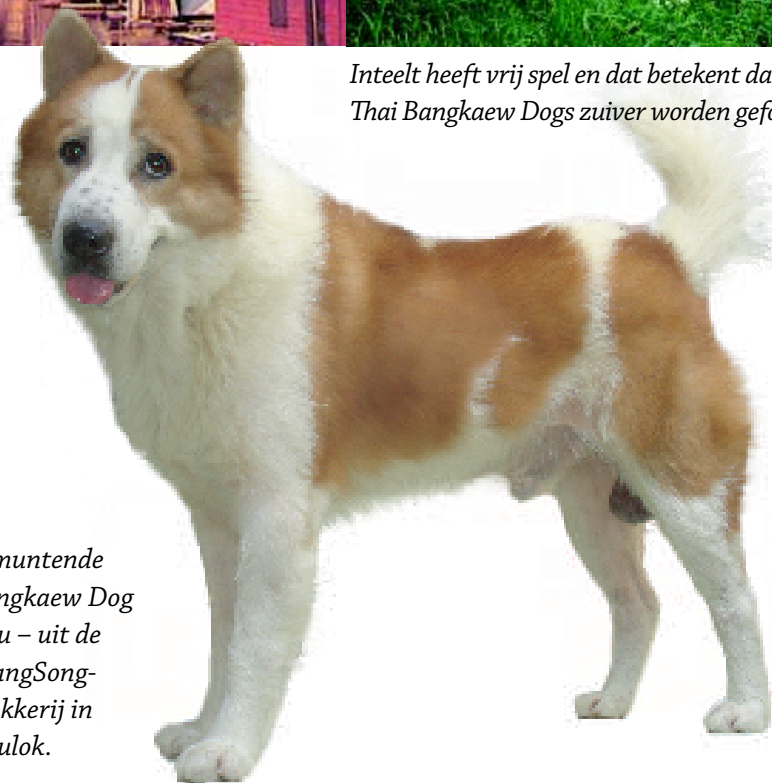
Een uitmuntende Thai Bangkaew Dog – een reu – uit de ChamSangSong-Kram fokkerij in Phitsanulok.