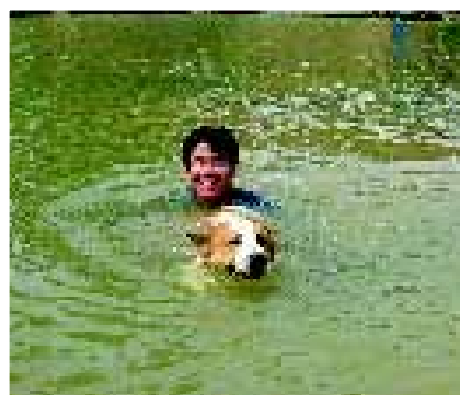
De Thai Bangkaew Dog zwemt graag. We zien hier één van de medewerkers van de ChumSangSongKram kennel met een hond in de Yom rivier.