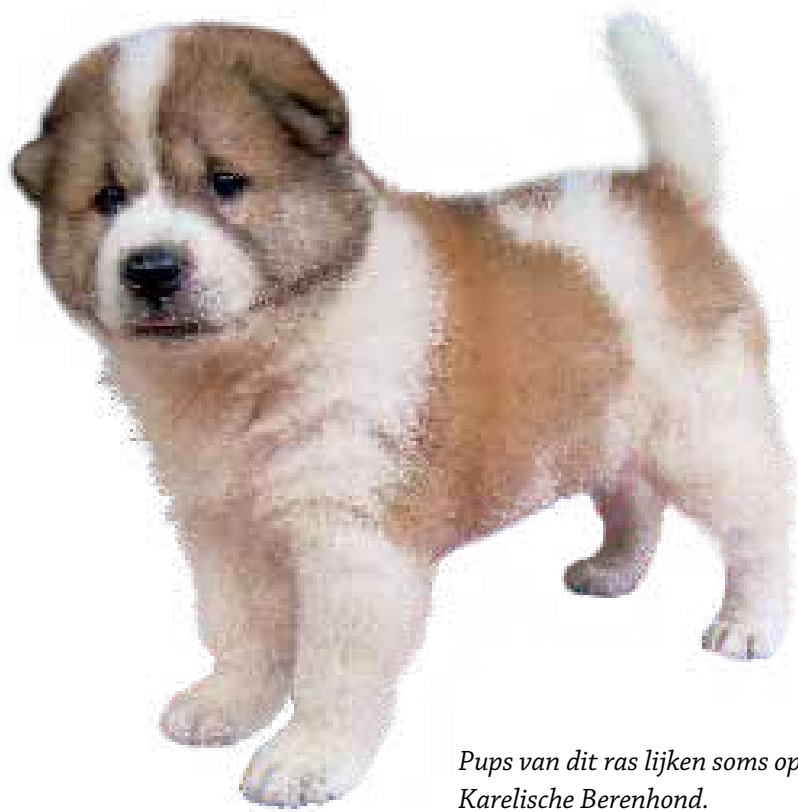
Pups van dit ras lijken soms op de Karelische Berenhond.

oren, een ronde rug, een te brede snuit en een lichtkleurige neus. Hetzelfde geldt voor afwijkingen in de hoogte, gebrek aan een kraag en bevedering en slordig gangwerk. Het missen van 3 of meer tanden wordt als een ernstige fout gezien. Agressiviteit, schuwheid, een bovenvoor- of ondervoorbijtend gebit, hangende oren, een korte of zachte vacht zijn onder andere de diskwalificerende fouten. Gemiddeld wordt een Thai Bangkaew Dog 10 tot 14 jaar. Ernstige afwijkingen zijn tot op heden niet geconstateerd, met uitzondering van diverse oogafwijkingen. Vanuit de fokkerij wordt het testen van de ogen bij fokdieren aanbevolen. De honden zwemmen graag, maar ook gaten graven doen ze vol overgave. ■