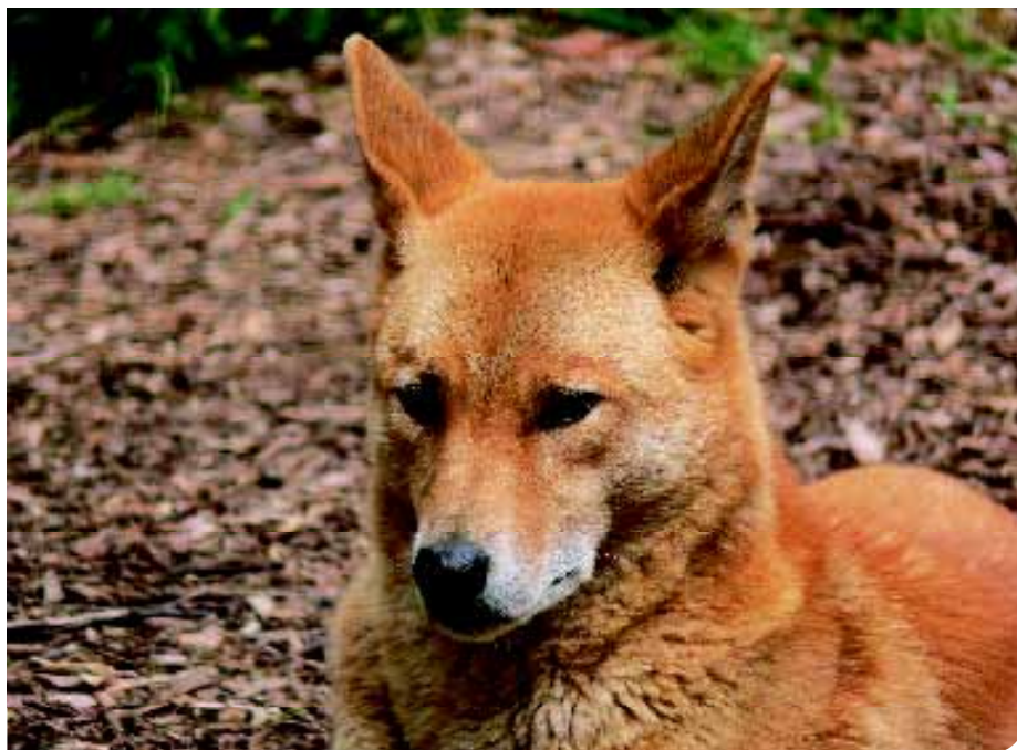
• Een Taiwan Dog? Nee, een Australische Dingo. De gelijkenis in hoofd en (stand van de) oren is niet te missen!.

mening dat uitsterven in die periode dichterbij is dan ooit. De reden: de Chinezen behorend tot de Kuomintang partij van Chiang Kai-shek eten honden, dus ook die van de aboriginals. Een gewoonte die men tot dan in Taiwan niet of nauwelijks kent. In 2001 worden hondenvlees voor consumptie en hondenvachten voor kleding bij wet verboden, maar in zeer afgelegen gebieden kan men nog hondenvlees vinden én eten. Deze vier gebeurtenissen leiden er toe dat de Taiwan Dog in de tweede helft van de twintigste eeuw op sterven na dood is en er nog weinig zuivere exemplaren te vinden zijn. De Taiwan Dog is dan een half wilde hond, erg intelligent en zeer lenig. Drachtige teven zoeken een afgelegen plekje om te werpen en komen een aantal maanden later te voorschijn, met hun pups. Ze zijn in staat om hun eigen voedsel te vergaren. Die half wilde status is voor de Japanners reden om hen 'barbaarse honden' te noemen en onder het voorwendsel 'volksgezondheid' doden zij er vele.