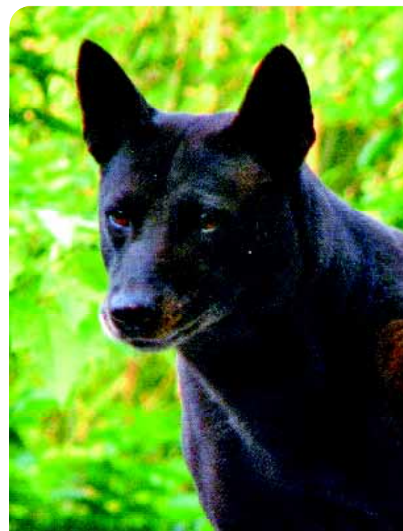
• De Taiwan Dog is brutaal en kent geen angst.