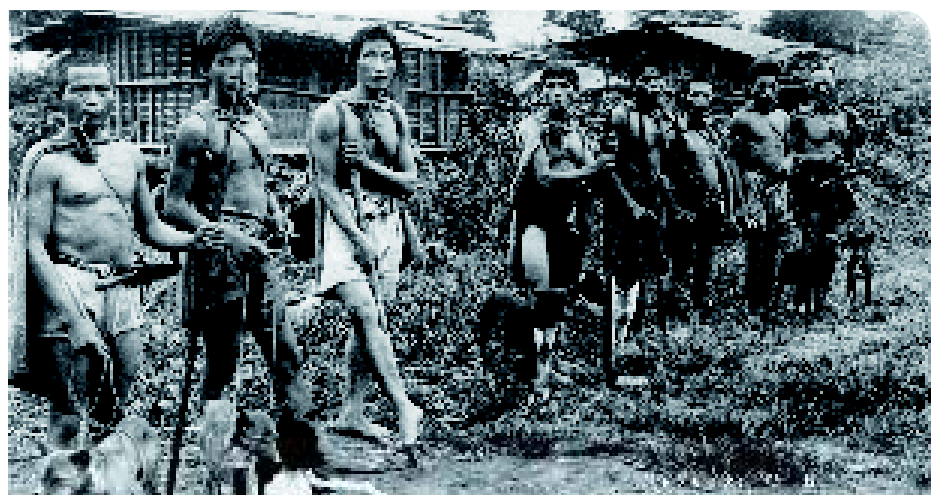
♦ Een werkelijk schitterende foto van Taiwanese aboriginals, klaar voor de jacht, met hun honden, die van een opvallend eenvormig type zijn. Aan de grootte en het uiterlijk van de jagers is goed te zien dat zij niet verwant zijn met de Chinezen.

typen plaats. Het is daarom halverwege de twintigste eeuw vrijwel onmogelijk om nog raszuivere exemplaren te vinden. Hierna wordt in dit artikel steeds gesproken over de Taiwan Dog, maar in de literatuur is Formosan (Mountain) Dog de meest gebruikte naam.