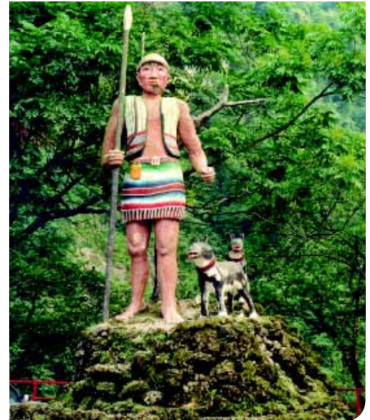
♦ Een houten beeld in Wulai, dat een lid van de Atayal stam voorstelt, vergezeld door zijn jachthonden. De vele stammen op Formosa staan bekend als jagers en krijgers, terwijl de vrouwen traditionele kleding weven. (Foto: Ria Hörter).

Hokkaido, Shiba en Akita, allemaal Japanse rassen. Maar, ook de Australische Dingo en de Australian Cattle Dog, het ras met Dingo bloed, lijken op de Taiwan Dog. Er is een periode geweest waarin de Taiwan Dog zich half wild voortplant in de bergen en de bossen van Taiwan. Echter, als resultaat van de overheersing door diverse koloniale grootmachten, vindt er in de loop van de eeuwen vermenging met andere