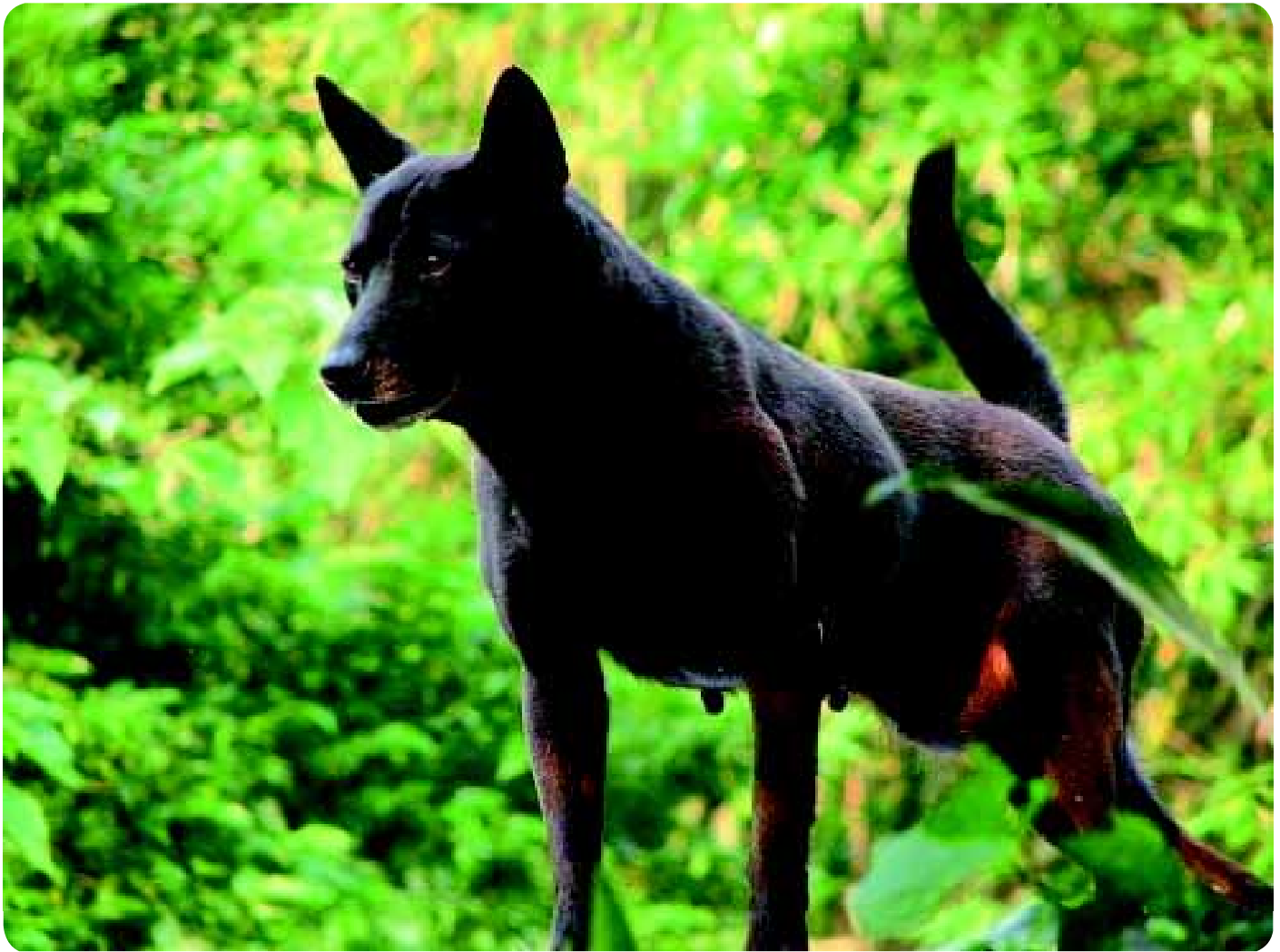
• De huidige gebruikswaarde van de Taiwan Dog is jachthond, waakhond en gezelschapshond. (Foto: www.dogs.com.tw ).

tussen (de Volksrepubliek) China en Taiwan (de Republiek China) een beetje en vanaf die periode streeft men ook naar betere politieke en economische verhoudingen. Taiwan is ongeveer even groot als Nederland en telt ruim 23 miljoen inwoners, van wie ruim 90% Chinezen zijn, en de rest is verdeeld over meer dan 50 stammen. De officiële taal is nu Mandarijn, er is vrijheid van godsdienst en ongeveer een kwart van de bevolking is Boeddhist.