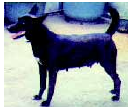
• De teef Black Spirit, stammoeder van de kennel van Chen Ming-nan.

hebben goed bone en stevige spieren en zijn parallel. De voeten , met zwarte nagels, mogen noch naar binnen, noch naar buiten draaien en hebben dikke voetzolen. De sikkelvormige staart is hoog aangezet en wordt rechtop gedragen, met de punt naar voren. Het gangwerk is krachtig en grijpt goed uit. De vacht , met een lengte van 1,5 tot 3 centimeter, is kort en hard en ligt dicht tegen het lichaam aan. De Taiwan Dog komt in een range van kleuren voor: zwart, brindle, fawn, wit, wit en zwart, wit en fawn en wit en brindle. Schofthoogte : reuen tussen 48 en 52 cm; teven tussen 43 en 47 cm. De Taiwan Dog weegt tussen de 12 en 18 kilogram. Fouten zijn onder andere schuwheid, tanggebit, uitpuilende ogen en onder of boven de maat. Enkele eliminerende fouten : agressie of ernstige schuwheid, geen rechtopstaande oren, te lang haar en een gekrulde staart. ◀