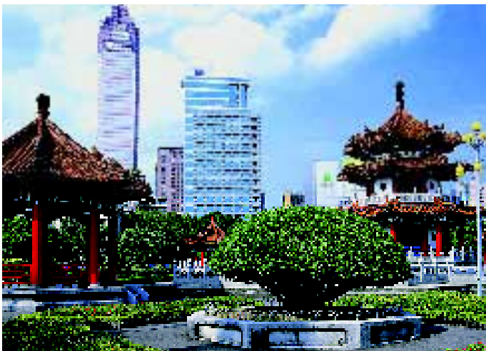
• In de hoofdstad Taipei gaan oud en nieuw hand in hand.

lees ik: 'Oversteken in de miljoenenstad Taipei doe ik bij voorkeur dicht achter een oude Chinees. Daar zijn er genoeg van en die hebben het overleefd' en 'Taxichauffeurs rijden als gekken en vinden het leuk als ik daarom lach. 'No problem', zeggen ze, 'only first class drivers in Taipei. Second class all dead.' Maar een hond? Niet één. Bij het maken van excursies naar het platteland duiken ze wel af en toe op, rondscharrelend op de erven bij kleine huisjes. Van onbestemd ras, hoewel ik de meeste nu onder het type Taiwan