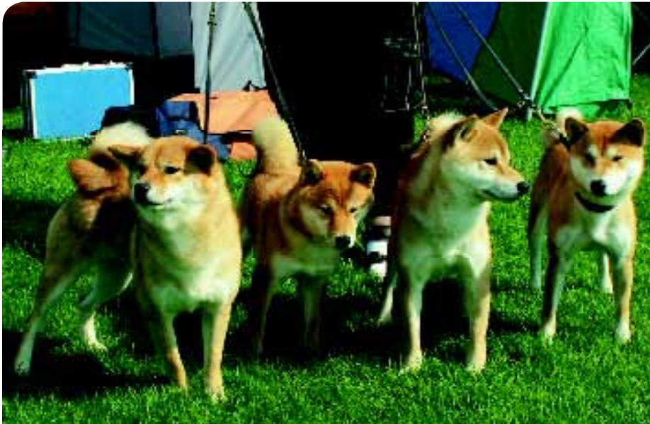
♦ De Shiba lijkt, net zoals een aantal andere Japanse rassen, op de Taiwan Dog. (Foto: Ria Hörter).

Dog zou kunnen rangschikken. Het eerste teken dat er in het oude Formosa – tot 1945 de naam van Taiwan – honden bij de jacht zijn gebruikt, zie ik in Wulai, in het noorden van Taiwan. Het is een metershoog houten beeld van een jager uit de Atayal stam, behorend tot de aboriginals van Taiwan. Naast de jager staan twee honden.