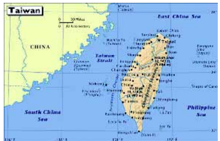
• Taiwan – het vroegere Formosa – is een eiland in de Chinese Zee, met als hoofdstad Taipei.