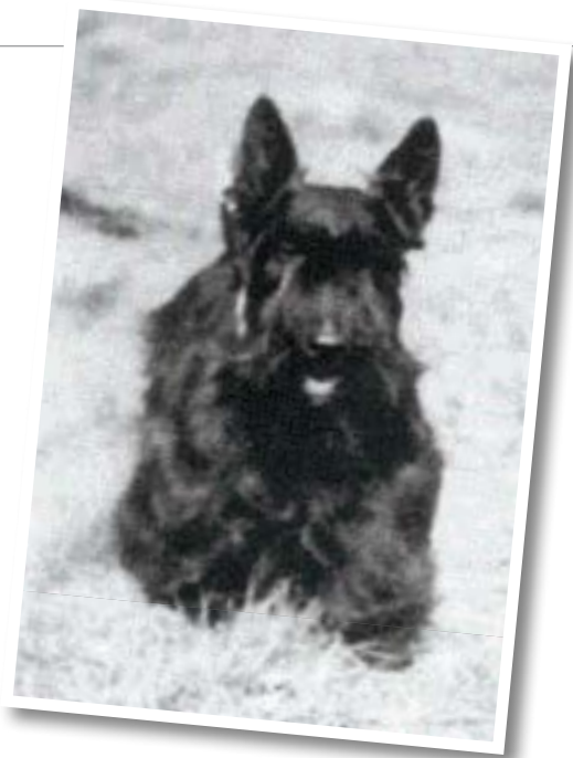
• 'Scotch Rose' , de Schotse Terrier die aan de basis staat van de Cesky Terrier.