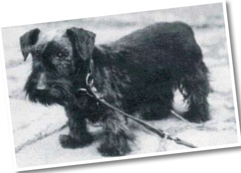
• Diana Lovu zdar' (Balda Lovu zdar x Scotch Rose), geboren uit een zoon x moeder paring.