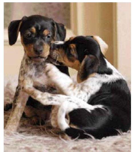
• De 'laboratoriumhond', die mede door Frantisek Horák wordt ontwikkeld: Cesky Strakaty pes. Nu een nationaal ras in Tsjechië.