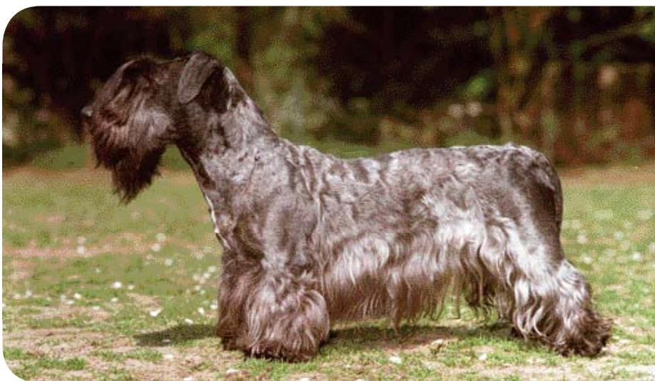
• 'Diana Bohemia Regent' (Chram Kvitko x Alida z Alenciny). Eén van de weinige niet-Tsjechische Cesky's, die de 'Days of the Cesky Terrier' heeft gewonnen. De eerste niet-Engelse Cesky Terrier die een BOS behaalde op Crufts.

een film en staat afgebeeld op postzegels. Ondanks het feit dat het ras ten tijde van het communisme niet of nauwelijks mag worden geëxporteerd, is de Cesky nu bekend in onder andere Nederland, Duitsland, de Scandinavische landen, Amerika, Engeland, Canada en Australië.