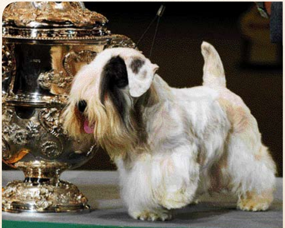
♦ Sealyham Terrier 'Efbe's Hildago at Goodspice', Best-in-Show op Crufts 2009. Tophond van een bedreigd hondenras.

John Owen heeft echter ook niet kunnen bevroeden dat er in 2008 maar 43 Sealyhams in het Engelse stamboek worden ingeschreven, waarmee dit ras aan kop loopt bij de bedreigde hondenrassen ... ◀