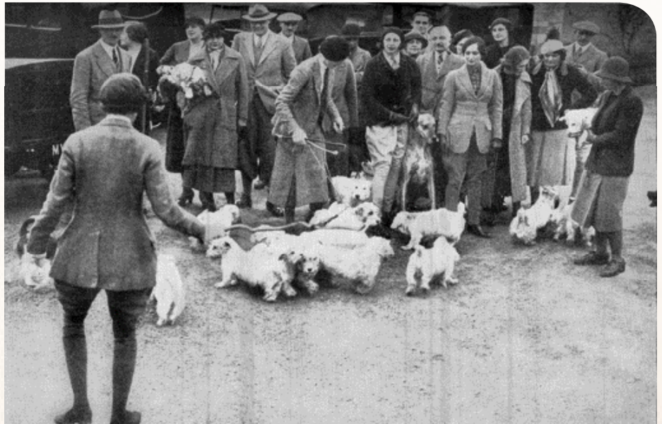
♦ Aankomst op de show van een groep Sealyham Terriers aan het begin van de twintigste eeuw.

Net als bij andere 'nieuwe' rassen weten we niet precies met welke terriers Tucker-Edwardes begint en welk type honden hij bij zijn fokkerij gebruikt. Men gaat ervan uit dat hij de eigen terriers kruist met een Welsh Corgi – ook een lokaal type hond. Dat ras moet voor meer ruglengte en kortere benen zorgen. Tucker-Edwardes streeft ernaar om een kleine, wendbare en lenige hond te fokken en, net als Hinks en Malcolm, weet hij precies wat hij wil: een