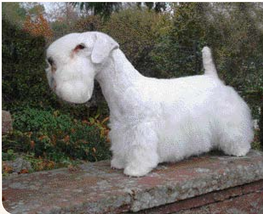
♦ Het ruige jachthondje van toen is nu een elegante, mooi gecoeffeerde showhond geworden. Een prachtige rasvertegenwoordiger uit de Engelse Tannaburs kennel.