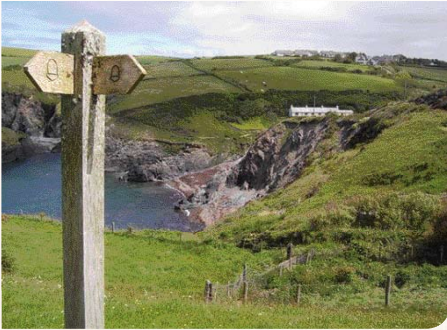
• De familie Tucker-Edwardes is in de negentiende eeuw al zes eeuwen verbonden met het graafschap Pembrokeshire in Wales.