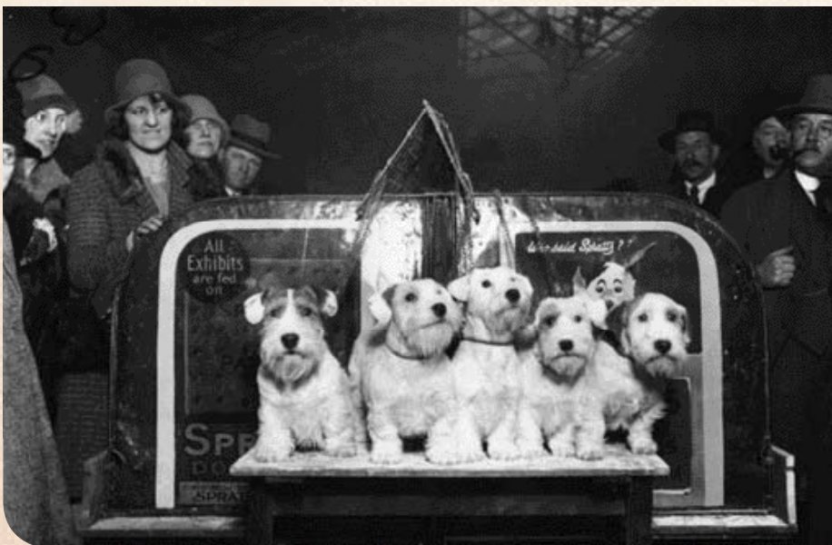
♦ Sealyham Terriers op Crufts, februari 1930.