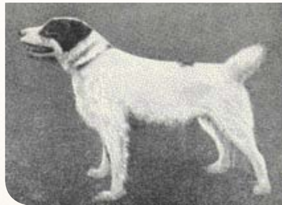
♦ 'Duck', één van de eerste Sealyham Terriers.

Diverse auteurs beschrijven hem als een 'eccentric sportsman' en onze