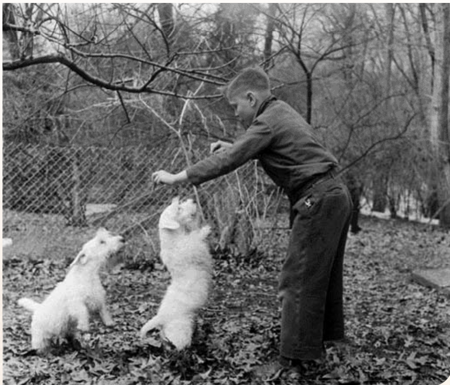
• Sealyham Terriers circa 1955.