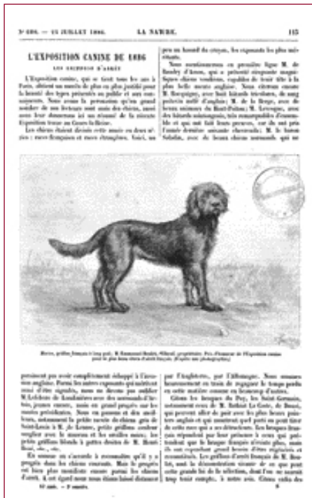
• In het Franse blad 'La Nature' verschijnt in 1886 een artikel over de hondententoonstelling in Parijs met daarbij een afbeelding van 'Marco'.