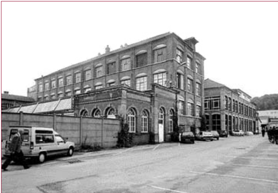
• De spinnerij en weverij van Boulet & Nivert in het Franse Elbeuf.