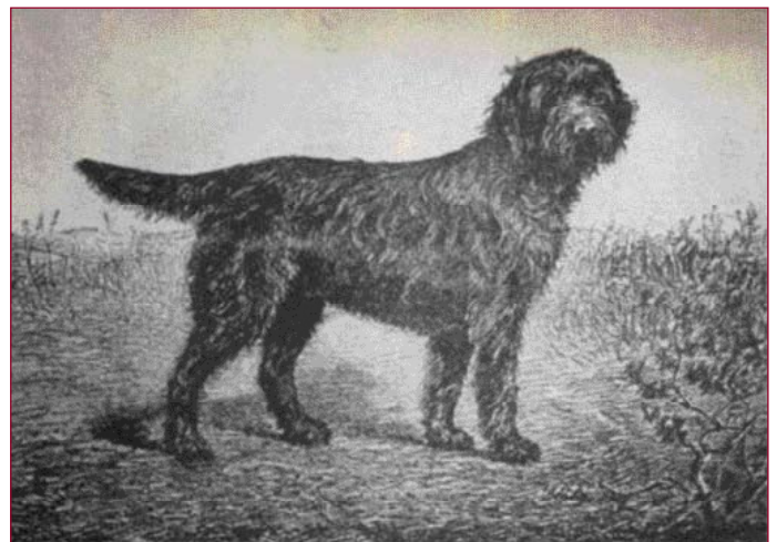
• 'Marco', de nummer 1 in het Franse hondenstamboek. Hij wint prijzen in Parijs en Londen, in 1886 en 1887.