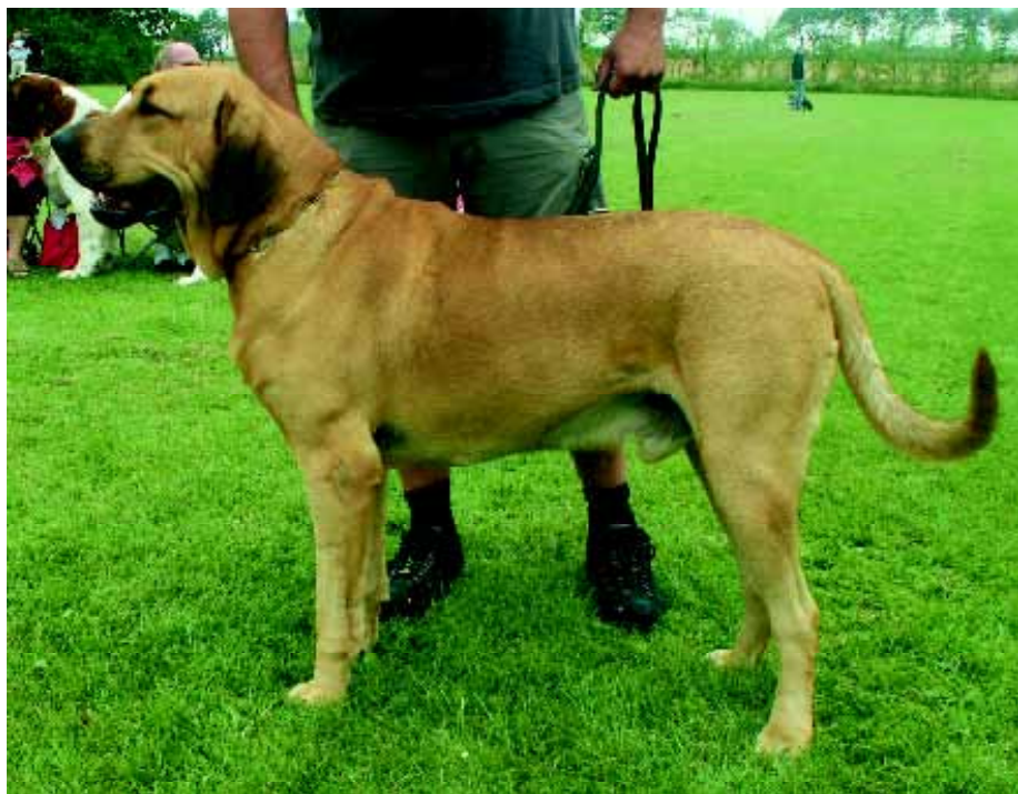
Algemene indruk van de Broholmer is een grote, krachtige hond van het Mastiff type.