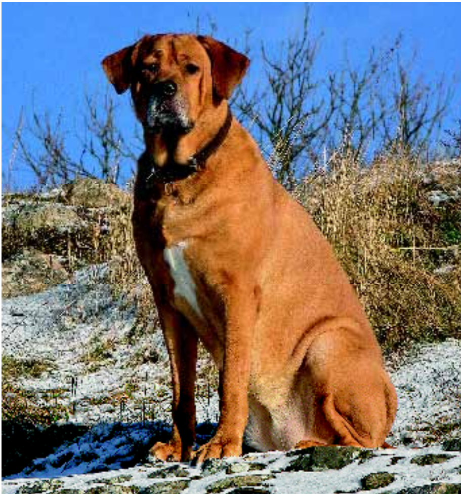
In 1983 zijn er al 35 raszuiver gefokte Broholmers in Denemarken.