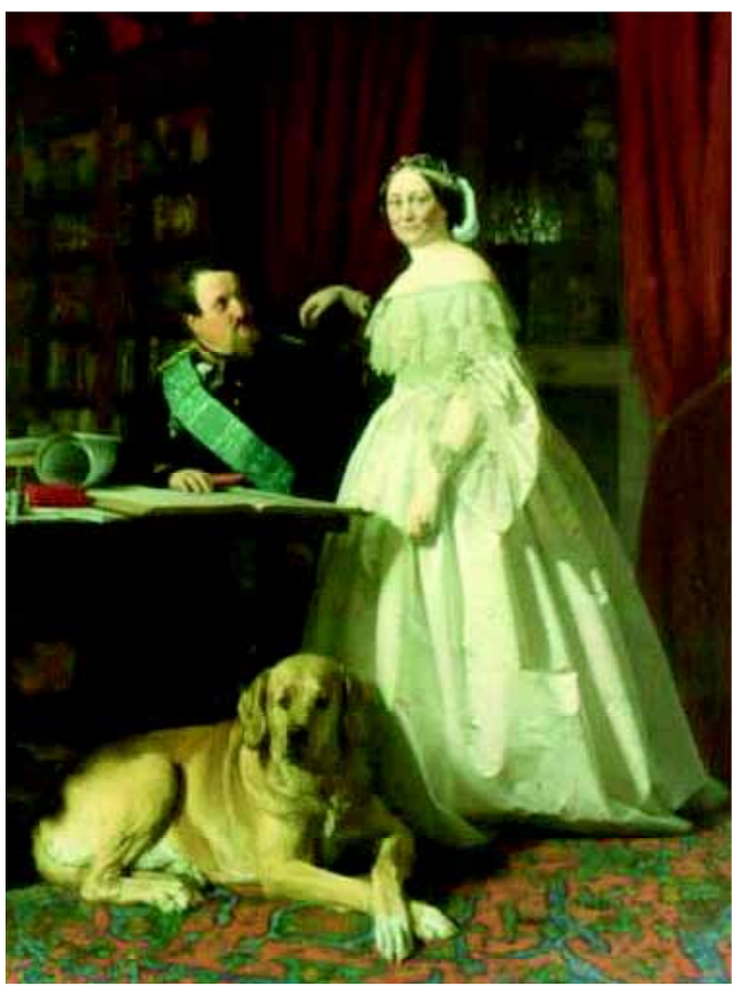
Koning Frederik VII van Denemarken (1808-1863) en zijn vrouw, gravin Danner, zijn grote liefhebbers van de Broholmer. Het koninklijk paar is jarenlang in het bezit van diverse honden van dit ras. Schilderij circa 1859.