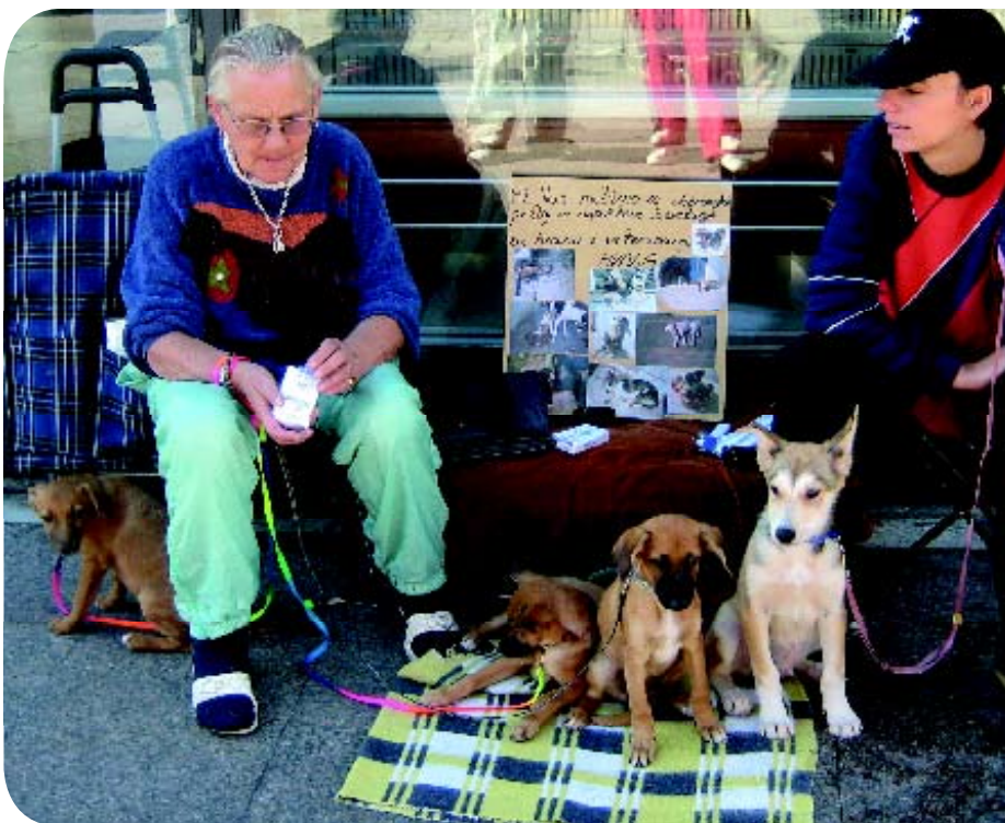
♦ Straatverkoop in een moderne winkelstraat in Rijeka, Kroatië, 2007.

Na de markt- en straathandel zijn het later vooral de dierenwinkels die zich op de verkoop van honden toeleggen. Anno 2011 zijn we er echter helemaal aan gewend dat het uitzoeken van een rashond begint in boeken, op hondententoonstellingen of middels informatie op het internet. Om dan via de rasvereniging een betrouwbare fokker te bezoeken. Toch zijn er nog echte hondenmarkten en straatverkopers, vooral in Oost-Europa, bijvoor-