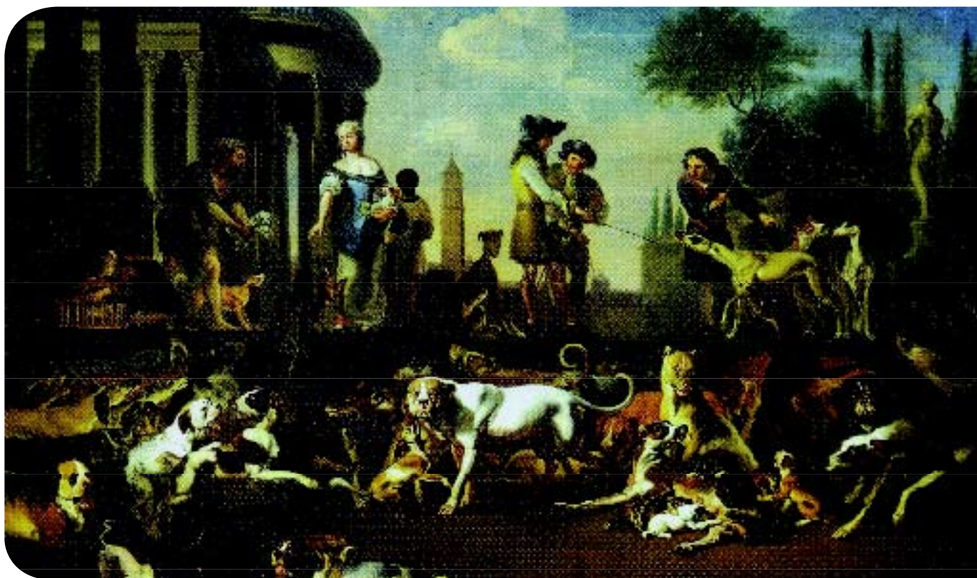
• 'De Hondenmarkt' of 'De honden van de Palatine' van Abraham Hondius (1625-1691).

De aanschaf van een rashond en de verkoop van honden op markten zijn twee werelden die elkaar per definitie lijken uit te sluiten. Hondenmarkten en straatverkoop van honden zijn er echter altijd geweest en zullen er waarschijnlijk ook altijd blijven...