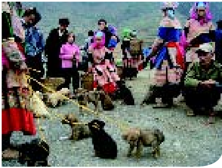
♦ Hondenmarkt in Simacai (Vietnam). Het aanbod bestaat voornamelijk uit pups. (Fotograaf onbekend).

Hondius' schilderij is dit een realistische voorstelling van zaken en de honden zijn reeds als aparte rassen te herkennen. Links onderaan een terrier, misschien een Dandie Dinmont Terrier, het ras dat Ansdell vaker schildert. In zijn linkerhand houdt de verkoper een Poedel of Bichon omhoog, getooid met een rood strikje. De niet aangelijsde jachthonden op de voorgrond zijn waarschijnlijk een Engelse Setter (toen veel zwaarder