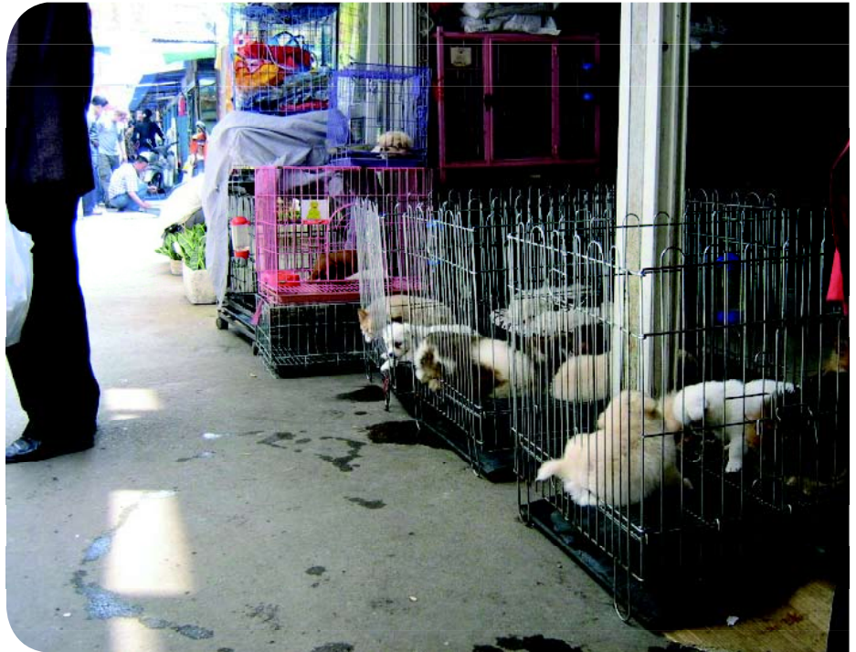
♦ Hondenmarkt in Ganjiang Road, Suzhou (China). Honden vormen hier een onderdeel van de aangeboden waar.

Hondius' schilderij is dit een realistische voorstelling van zaken en de honden zijn reeds als aparte rassen te herkennen. Links onderaan een terrier, misschien een Dandie Dinmont Terrier, het ras dat Ansdell vaker schildert. In zijn linkerhand houdt de verkoper een Poedel of Bichon omhoog, getooid met een rood strikje. De niet aangelijsde jachthonden op de voorgrond zijn waarschijnlijk een Engelse Setter (toen veel zwaarder