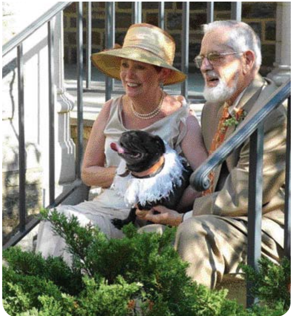
• Modern huwelijksportret. Ook deze hond is feestelijk 'aangekleed'.