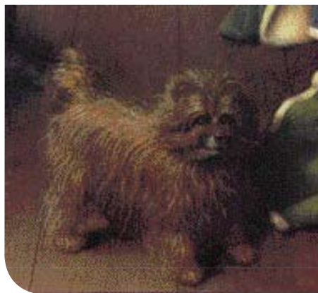
• Detail uit het werk van Van Eyck: een Griffonachtig hondje met een bruine golvende vacht.

We kijken naar een schilderij dat door Jan van Eyck (ca. 1390-1441) in 1434 wordt gemaakt. De meeste kunsthistorici noemen dit werk 'Het huwelijk van Giovanni Arnolfini en Giovanna Cenami' of 'Giovanni Arnolfini en zijn vrouw'. Zij wijzen op de symbolen in dit schilderij die op het huwelijk betrekking hebben. Eén van de aanwijzingen dat het om een huwelijk gaat, is de manier waarop Giovanni en Giovanna – afkomstig uit Italië – zijn vereeuwigd: staand en hand in hand. De opgestoken hand van de bruidegom, een rijke koopman-bankier, wijst op echtelijke trouw en de uitgetrokken houten pantoffels (trippen) kunnen