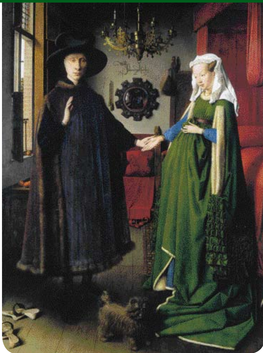
• Schilderij van Jan van Eyck (ca. 1390-1441) dat in 1434 wordt gemaakt: 'Het huwelijk van Giovanni Arnolfini en Giovanna Cenami' of 'Giovanni Arnolfini en zijn vrouw'.