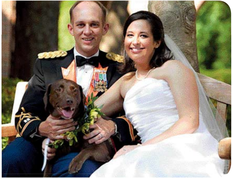
• Modern huwelijksportret met hond, in dit geval Labrador Lady, die op de feestelijkheden 'gekleed' is. .

betekenen dat het paar op gewijde grond staat. Slechts één kaars in de kroonluchter brandt. Naar Vlaams gebruik heeft de bruid die aan haar bruidegom gegeven; het is het symbool voor Gods oog. En dan Giovanna: haar hand ligt op haar uitdijende buik. De verklaring kan tweërlei zijn: ze is zwanger of het verwijst naar de rijkdom van dit echtpaar; immers, een welgevulde buik betekent eten in overvloed. De kleuren zijn ook symbolisch; de rode bedgordijnen verwijzen naar het fysieke bedrijven van de liefde en de kleur groen van Giovanna's dure, met hermelijn afgezette japon staat voor hoop (op een kind). De signatuur staat boven de ronde spiegel: Johannes de Eyck fuit hic. 1434, ofwel Johannes van Eyck was hier, 1434. De schilder is dus één van de aanwezigen bij het huwelijk.