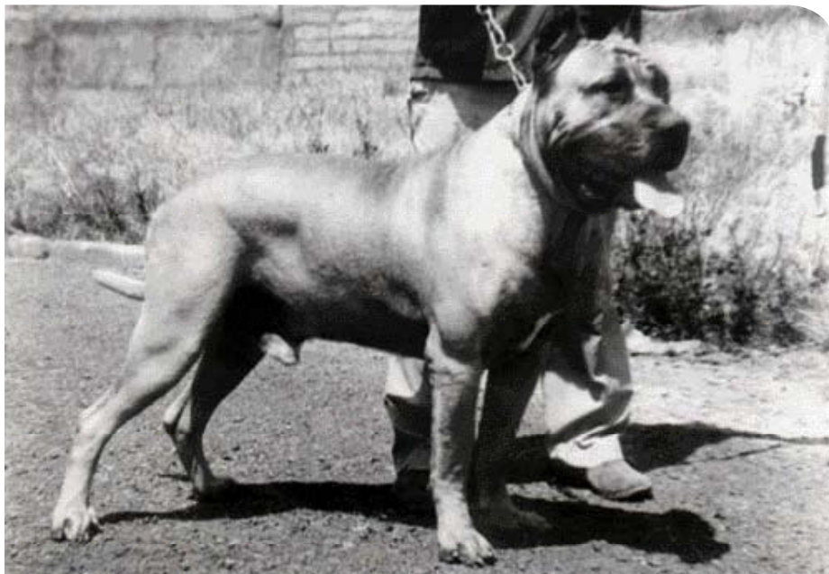
• Foto van een Dogo Canario type van voor 1980.

de populariteit en in de jaren zestig van de vorige eeuw is de Perro de Presa op sterven na dood.