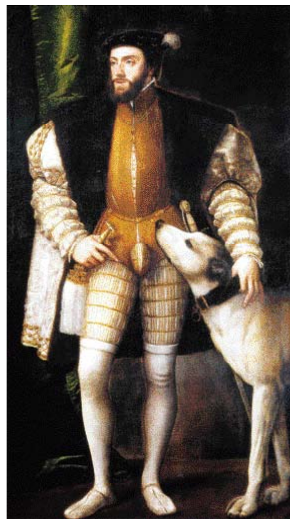
• Keizer Karel V (1500-1558) van 1516 tot 1556 als Karel I koning van Spanje. Een schilderij van de Italiaanse schilder Titiaan (circa 1487-1576) die de keizer afbeeldt met een wit-grijze hond van het doggentype. (Museo del Prado, Madrid).

De Canarische Eilanden zijn ontstaan uit vulkanische uitbarstingen; ze vormen een archipel van eilanden, met bergen van 3.700 meter en een zee ertussen die hier en daar 3.000 meter diep is. De eilandengroep, met 1,5 miljoen inwoners, hoort bij Spanje en ligt voor de West-Afrikaanse kust in de Atlantische Oceaan. De huidige bevolking bestaat uit een vermenigving van Guanchen (de oorspronkelijke bewoners), Portugezen en Spanjaarden. Namen als Tenerife, La Palma, Fuerteventura, Gran