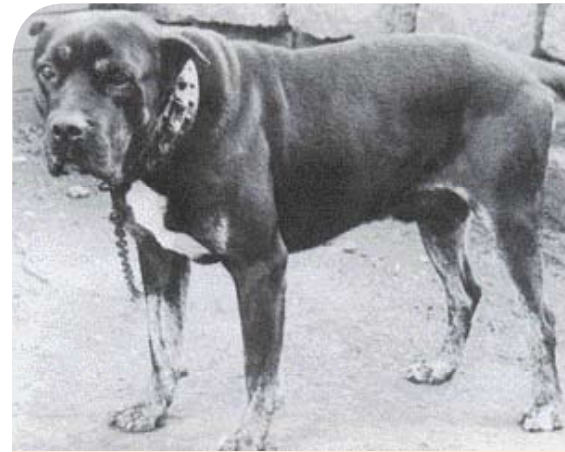
• Een type Dogo Canario uit 1952, waarbij de invloed van de Majorero nog goed is te zien.