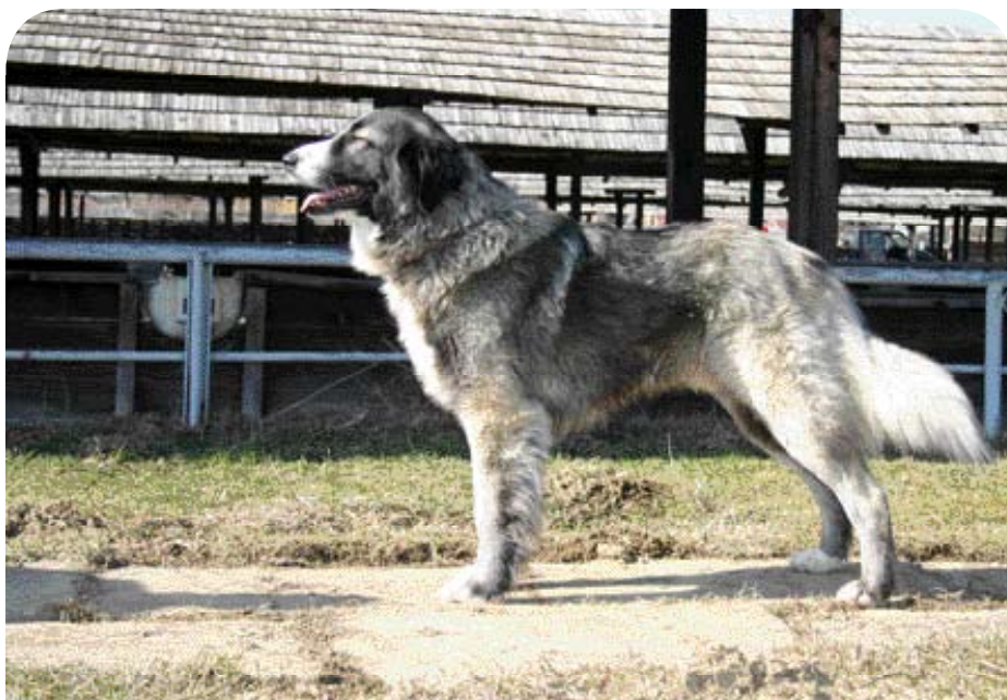
♦ Bij de Ciobanesc Romanesc Carpatin hoort de term 'lupoid type' in de standaard thuis. Dit is 'Gino de Codrisor'. (Foto: Dr. Cristian Vantu, Roemenië).

Behalve fokkers en promotors van het ras, zijn er ook instituten die zich inzetten voor het behoud van Roemeense herdershonden, zoals de Societatea pentru Imbunatatirea Rasei Canine din Romania (Vereniging ter Bevordering van de Roemeense Rassen), opgericht in 1928, en de