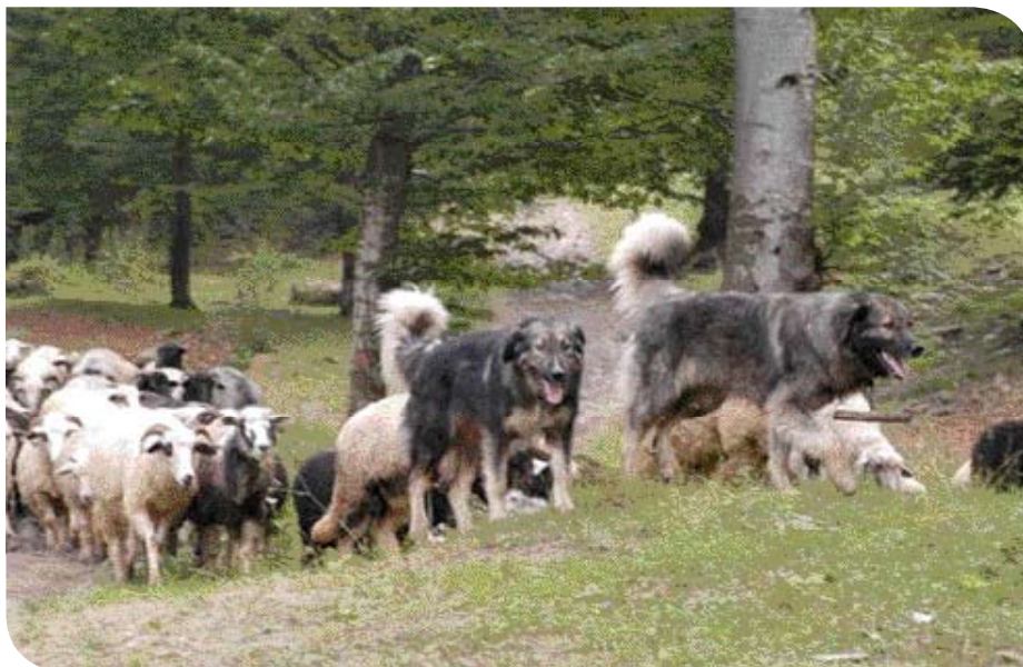
♦ In de zuidelijke Karpaten leven nog wolven, beren en lynxen, en de schaapskudden moeten daartegen worden beschermd.

Na jaren van rellen, onvrede, economische ellende en politieke instabiliteit, lijkt Roemenië nu in rustiger vaarwater te zijn gekomen en dat geldt zeker ook voor de nationale kynologie.