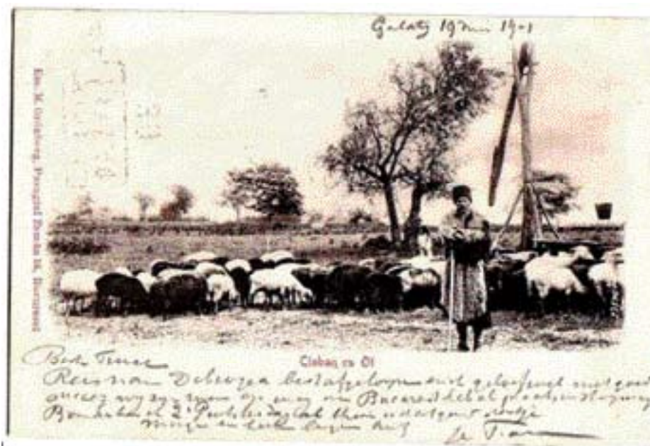
♦ De oudste geschiedenis van de Roemeense herdershonden verschilt niet veel van die van vele andere herdershondenrassen in Europa. Een Hongaarse ansichtkaart uit 1905.

zich na de oorlog aan het beleid van de Sovjet-Unie, zoals dat ook in andere Oost-Europese staten wordt ontwikkeld. In de jaren vijftig knoopt men relaties met het westen aan en de ster van partijleider en president Nicolae Ceaușescu rijst tot ongekende hoogte. Zijn val – en die van de gehate veiligheidsdienst Securitate – komt in 1989.