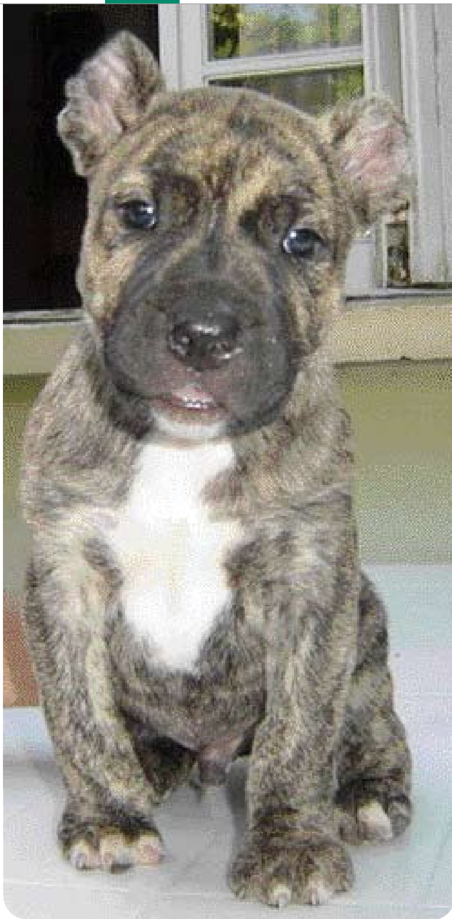
• Cimarrón pup. De oren zijn rond gecoupeerd en lijken op die van een poema.