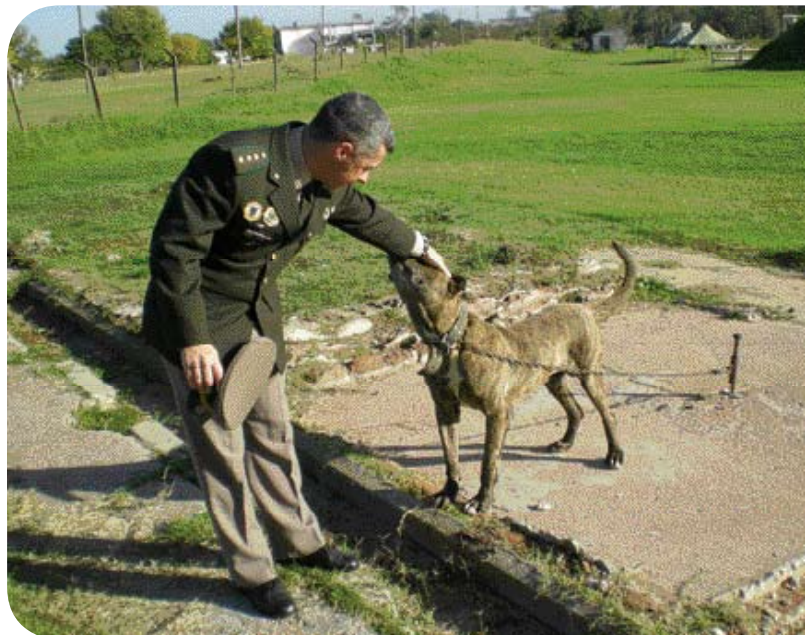
• De Cimarrón Uruguayo is mascotte van het Uruguayaanse leger.

onder bevel van generaal Artigas, in het centrum van Montevideo. Fokkers van het ras verenigen zich in de Sociedad de Criadores de Cimarrón Uruguayo ( www.sccu.com.uy ) en het feit dat een postzegel met de afbeelding van een Cimarrón verschijnt, is een teken van hun populariteit.