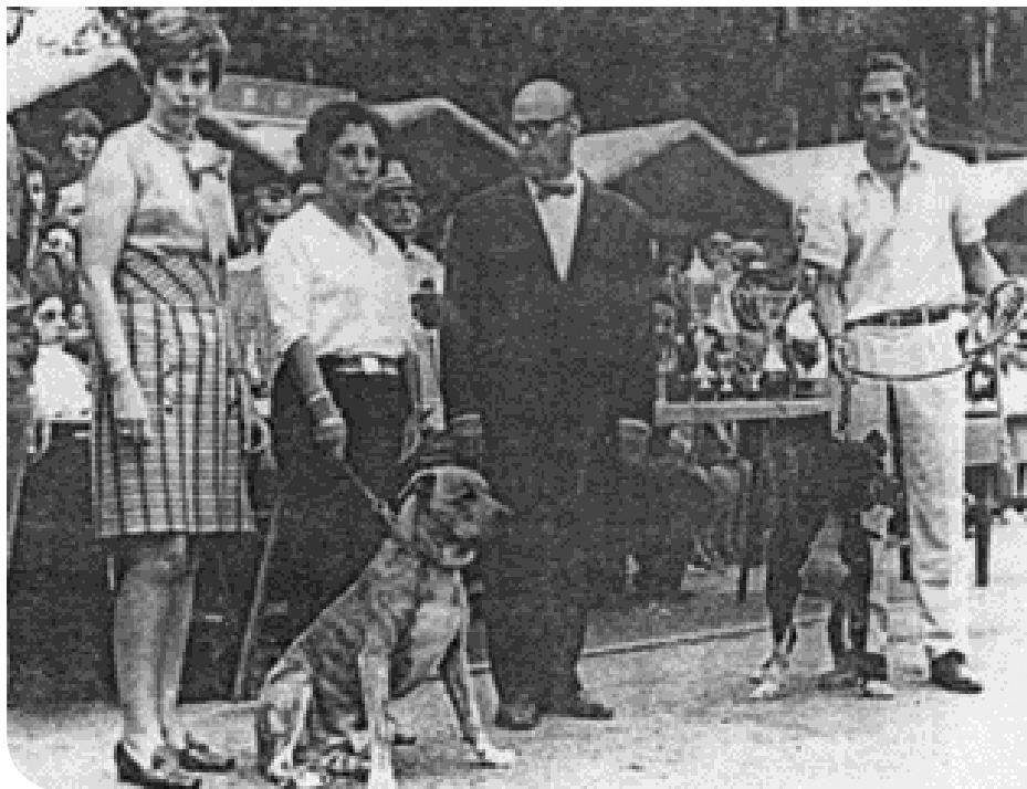
• Cimarróns 20 jaar geleden op een show van de Kennel Club van Uruguay (1989).