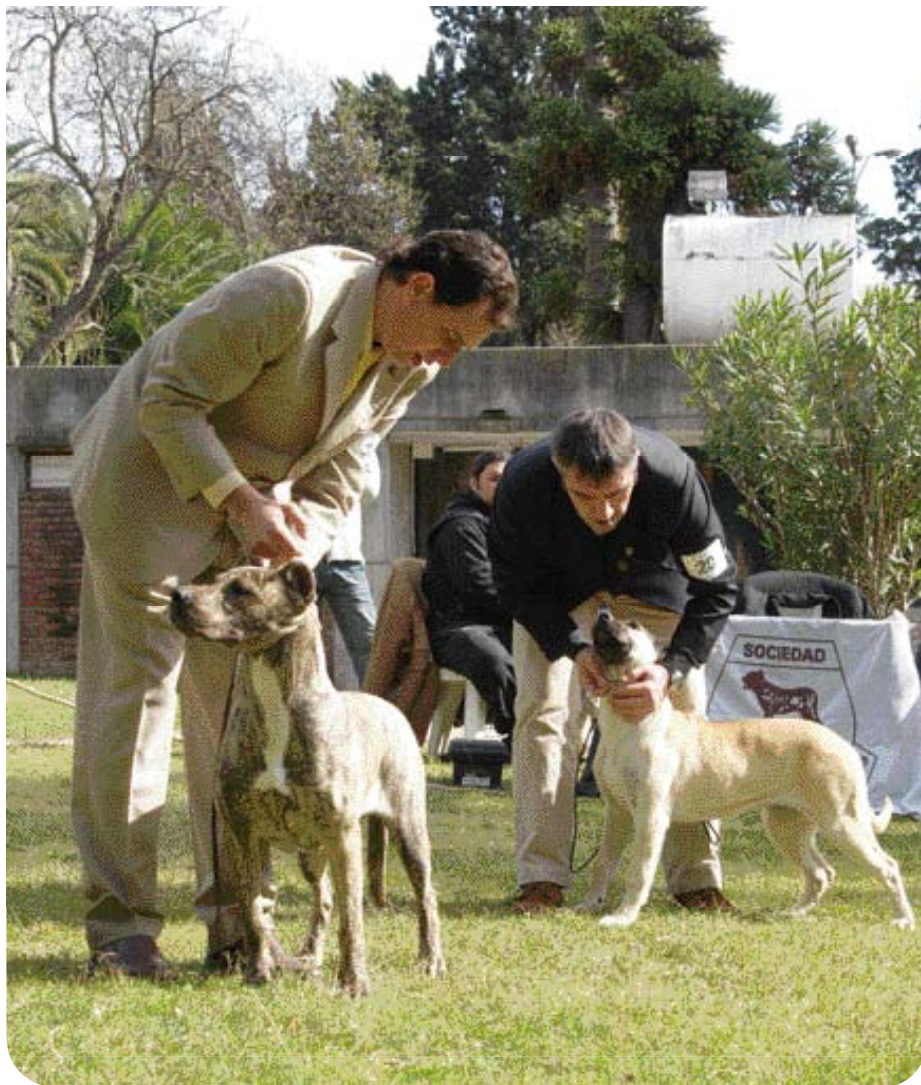
♦ Cimarróns tentoonstellen in Uruguay gebeurt soms met behulp van eenvoudige middelen.

de vroegste historie van deze hond gelegd: 'wild in Uruguay'. In Uruguay gebruikt men het woord Cimarrón voor alles dat in het wild leeft, zowel dieren als planten.