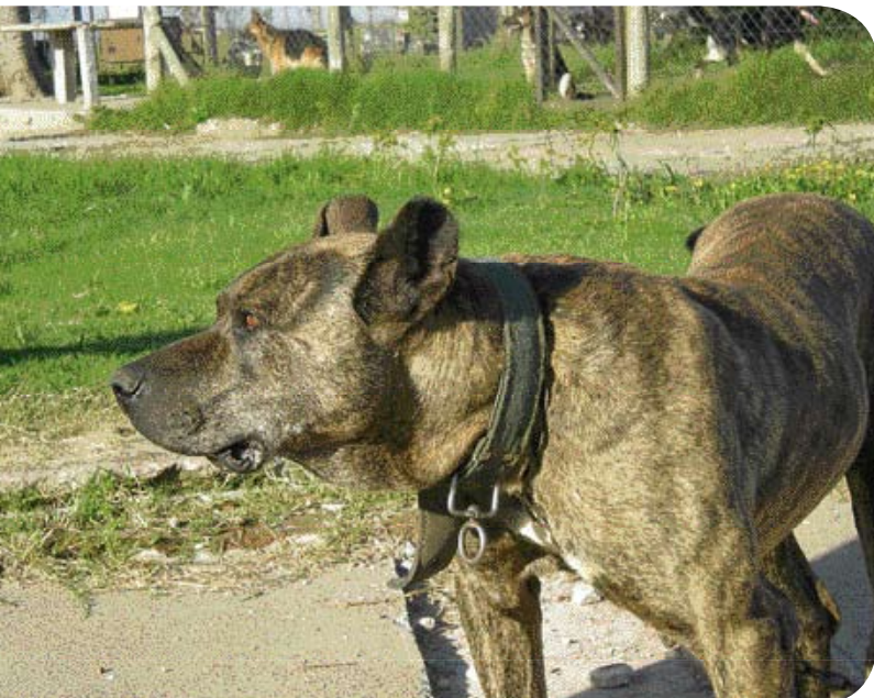
• Als waakhond maakt de Cimarrón een stoere indruk.