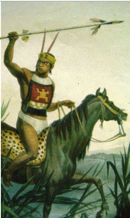
• Charrúa indiaan, de oorspronkelijke bewoners van Uruguay.

zijn voor het merendeel blank en stammen af van Spaanse (vooral Basken) en Italiaanse veroveraars, kolonisten en immigranten – in die volgorde. Maar ook van immigranten die afkomstig zijn uit vrijwel alle andere Europese landen. Slechts een paar procent wordt gerekend tot de mestiezen, mulatten en Afrikanen. Montevideo is de hoofdstad; daar woont meer dan de helft van de bevolking. Het land telt 19 departementen, met een beperkt zelfbestuur.