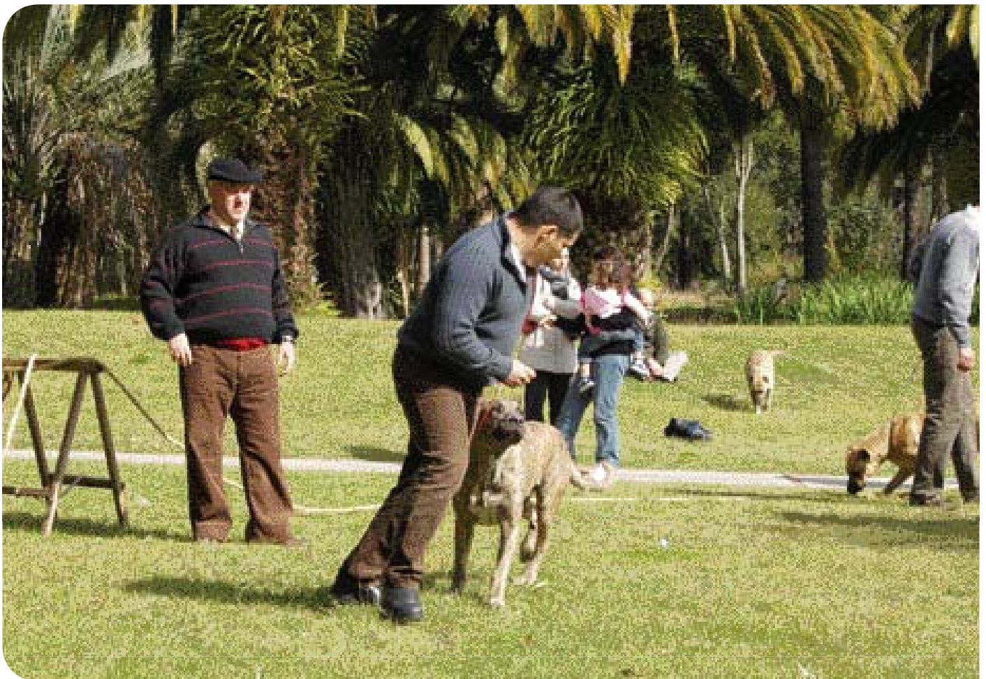
• Het voorbrengen van Cimarróns in Uruguay, in de openlucht.

Juan Diaz de Solis om tijdens diens ontdekkingsstocht op de Rio de la Plata. Die moord veroorzaakt dat Spaanse kolonisten dit gedeelte van het land voorlopig niet meer in hun tochten opnemen. Zilver en goud lokken Europeanen naar dit deel van Zuid-Amerika en met hen komen, in de zeventiende eeuw, de honden, paarden en koeien naar Uruguay. In 1726 nemen de Spanjaarden de stad Montevideo in, tot dan in het bezit van de Portugezen. Bij deze acties vinden honderden autochtone bewoners de dood. Vijftig jaar later gaat Uruguay deel uit maken van de Virreinato del Rio de la Plata , waarvan Buenos Aires (nu in Argentinië) de hoofdstad is. Als Napoleon in Europa de Spaanse monarchie onttroont, breekt er ook in Uruguay een opstand