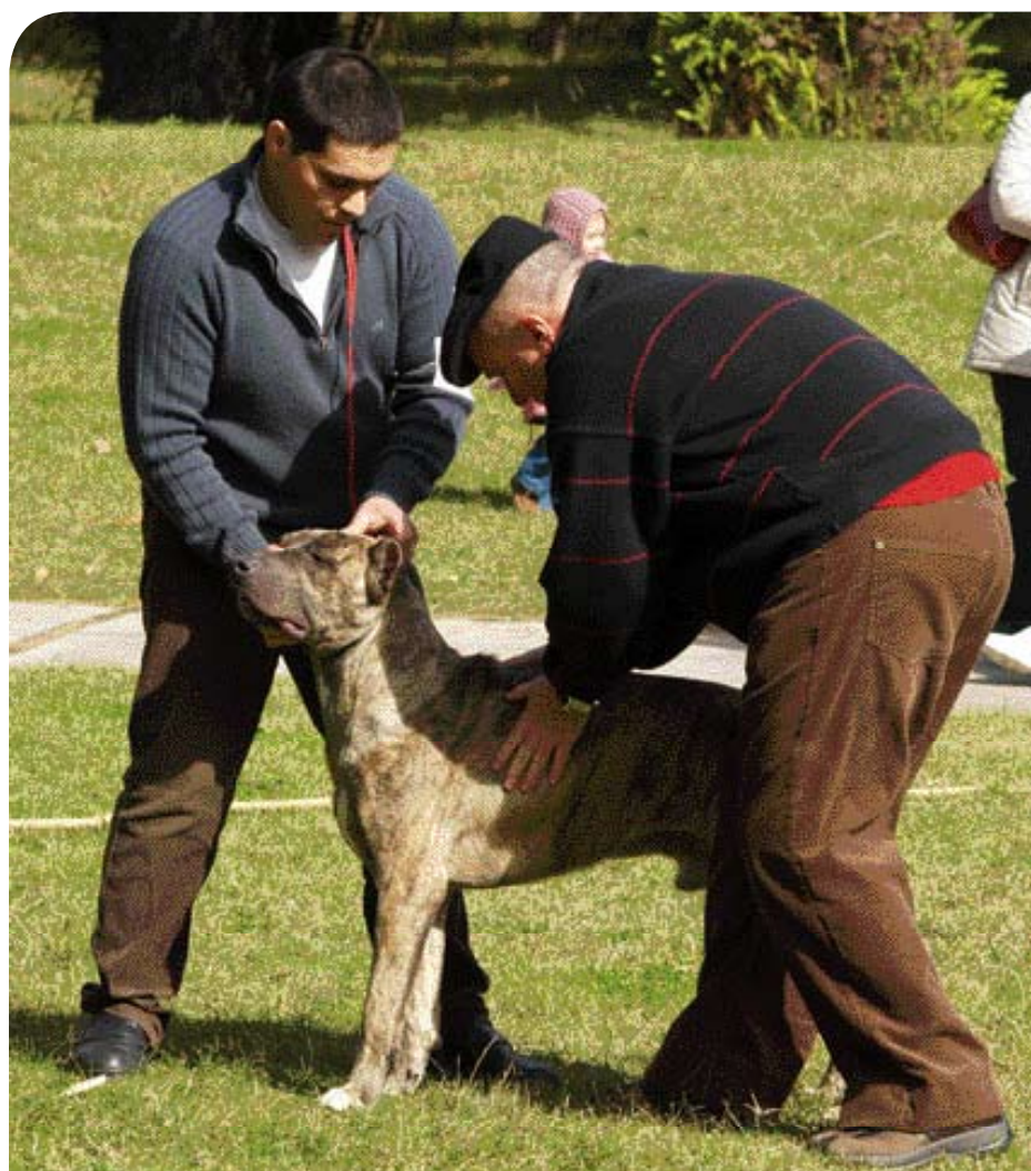
• Beoordeling van een Cimarrón door een keurmeester in Uruguay.

gemeten bij de croupe (kruis). De topline is recht, maar een lichte zadeldrug is ook toegestaan. De lendenen zijn kort, sterk en licht gewelfd. De diepe borst moet tenminste tot de ellebogen reiken; de dikke staart moet tot aan de hakken komen en wordt, in rust, laag gedragen.