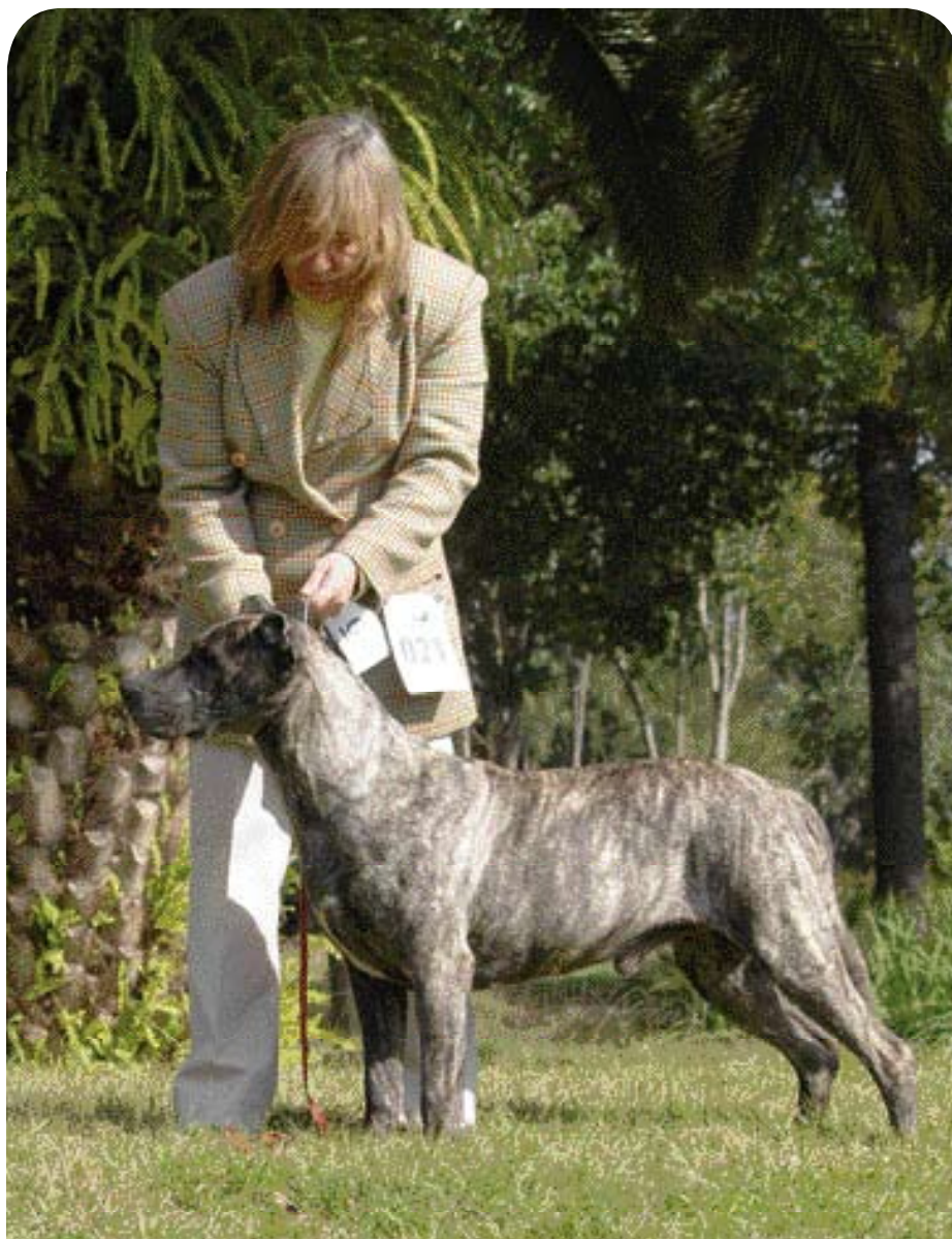
♦ De Cimarrón Uruguayo is een middelgrote hond van het Molosser-type. Hij is sterk, compact, goed bespied en lenig.

bij de Olimar rivier, in de Sierra de Otazo en de Cerros Largos. Lokale rangers, die in deze honden goede veedrijvers en bewakers herkennen, gaan met hen fokken en selecteren de pups op deze kwaliteiten. De gaucho's – de veehouders op de pampa's van Europese afkomst – gebruiken de honden bij hun vee, maar ook bij de jacht en de bewaking zijn ze nuttig. Dankzij die mensen beschikt Uruguay tegenwoordig over een nationaal ras met diverse werkkwaliteiten.