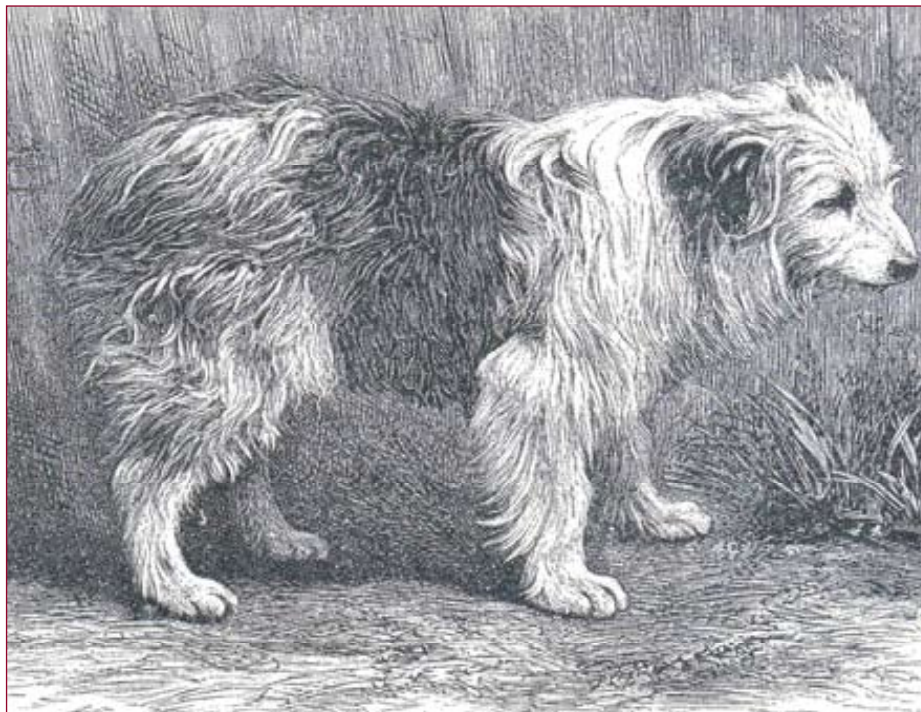
• Een 'Bob-tailed Sheepdog' uit 'The Book of the Dog' (1881) van Vero Shaw.

In 1845 wordt het ras 'erkend' door de Royal Agricultural Society (RAS), maar in de vroege jaren zestig van de vorige eeuw moet men vaststellen dat het ras bijna is uitgestorven. De redding komt van de ANKC, die in 1988 een 'Development Register' opent, waardoor het voortbestaan is gegarandeerd. Om het inschrijven van de atypische honden te vermijden, ontwikkelt de ANKC een waarderingssysteem, dat door drie keurmeesters wordt gehanteerd. Het systeem kent drie kwalificaties: A (uitmuntend rastype), B (kan van een goed type zijn, maar mist sommige kwaliteiten) en C (geen goed rasbeeld – mogelijk tan aftekeningen).