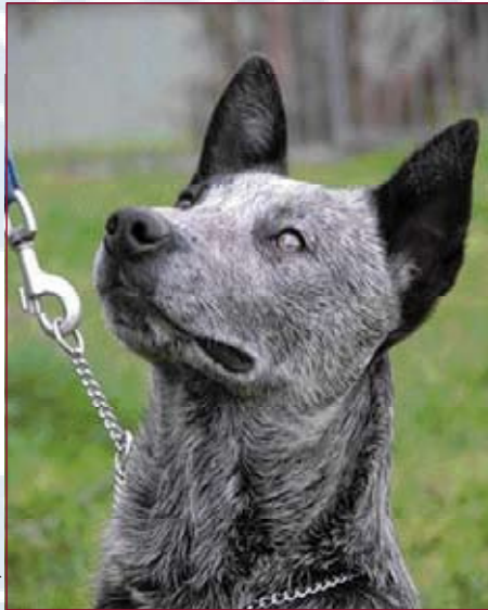
Maryheather Kennel, Australië