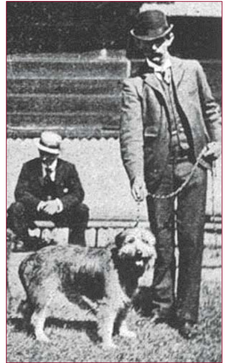
• Veedrijverhond 'Jack', een Smithfield type, gefotografeerd in Sydney in 1898.