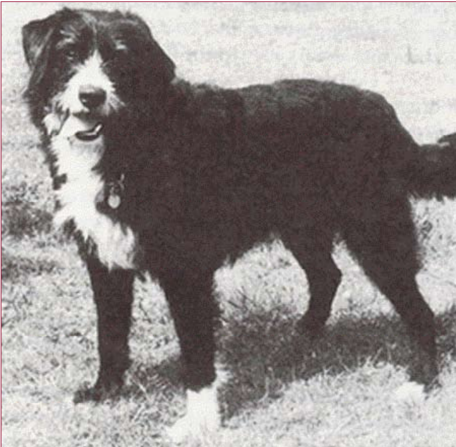
• Hond van het Smithfield type. Deze types spelen een grote rol bij de ontwikkeling van de Australische veedrijverhonden.

van de 'Central Smithfield Meat Markets' in Engeland. Daar tonen dit type honden hun talenten bij het 'bewaken' van varkens, kippen, pony's, schapen en koeien. 'Smithfields' staan ook bekend onder de naam 'English stock dog' of 'Black Bobtail'.