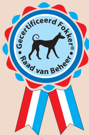
Logo gecertificeerde fokker

Als in de komende jaren de certificering van rasvereni-