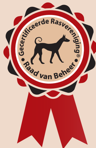
Logo gecertificeerde rasvereniging

gingen een feit wordt, dan wordt een erkende rasvereniging ook duidelijk herkenbaar aan een door de Raad van Beheer verstrekt logo 'Gecertificeerde Rasvereniging'.