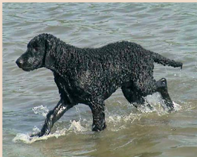
Curly Coated Retriever

logisch Reglement, kortweg KR, de wegwijzer in de georganiseerde kynologie. Het KR is te downloaden op www.raadvanbeheer.nl