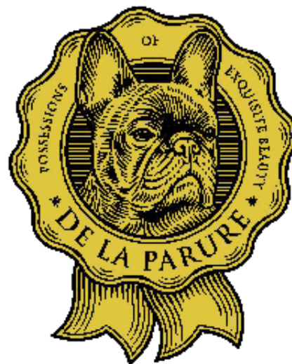
Logo 'de la Parure', wereldwijd bekend.