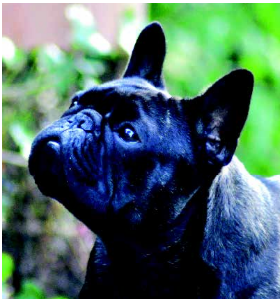
Multi Ch. Kokette de la Parure wordt Best of Breed op Crufts 2015.