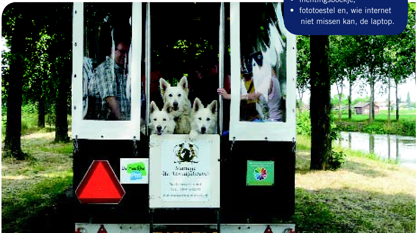
• Er zijn best uitstapjes te verzinnen die voor kinderen én honden mogelijk zijn, zoals dit ritje door het mooie Peelland. (Foto Sylvia Nijsten).