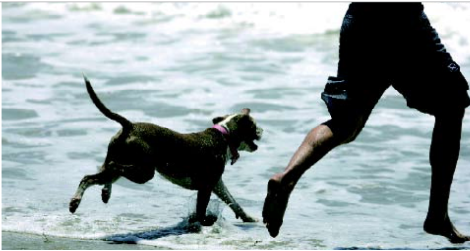
• Een vakantiepark, stacaravan of hotel bij het water is voor de meeste honden en kinderen een extra attractie...