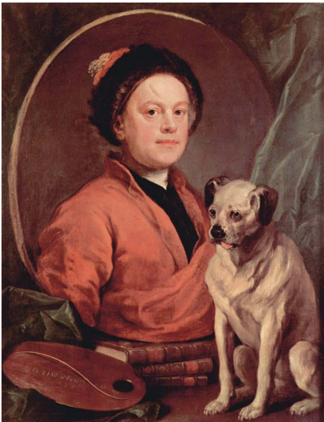
'The Painter and his Pug' (1745) van William Hogarth hangt nu in de Tate Gallery in Londen.

Schilderstukken van honden zijn onmisbaar bij het ontrafelen van de geschiedenis van rashonden. In de 18de en 19de eeuw, en dan vooral in Engeland, zijn er honderden kunstschilders van naam die het beeld van een hond vastleggen. Soms als ‘versiering’ van het landschap, soms als herinnering aan talentvolle jacht-, show- en werkhonden. Het komt zelden voor dat we een hond op een schilderij én als standbeeld kunnen zien.