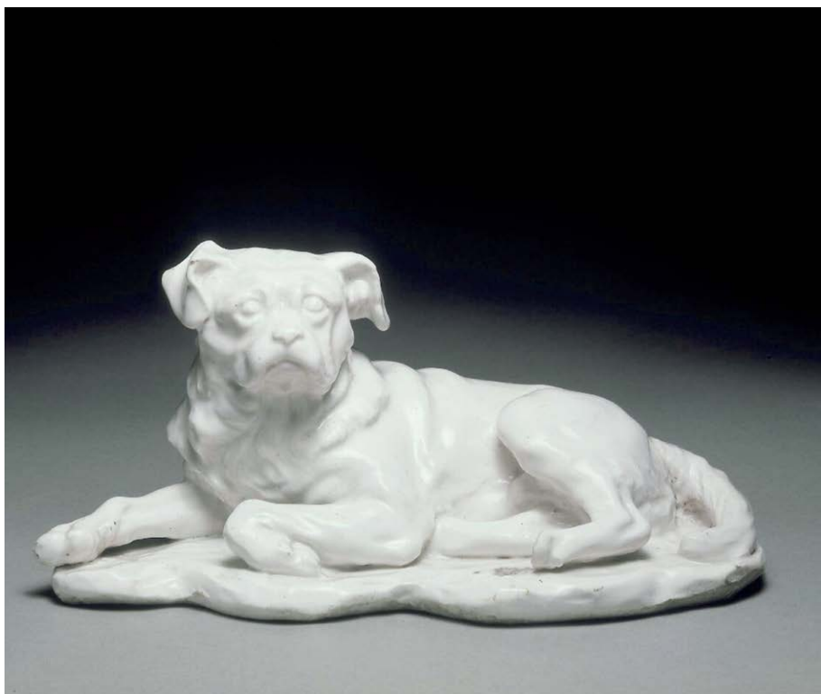
Mopshond Trump inspireerde onder andere de Franse beeldhouwer Louis François Roubillac. Hij maakte een beeldje van de hond dat in het Victoria en Albert Museum in Londen is te bewonderen.