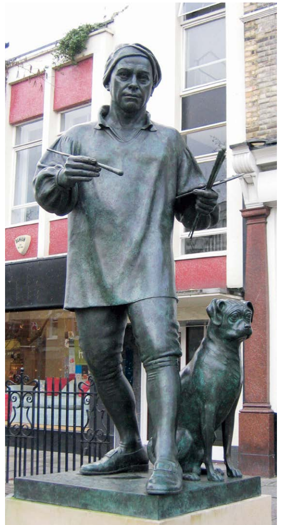
Het standbeeld van Hogarth en een veel te grote Trump in Londen.