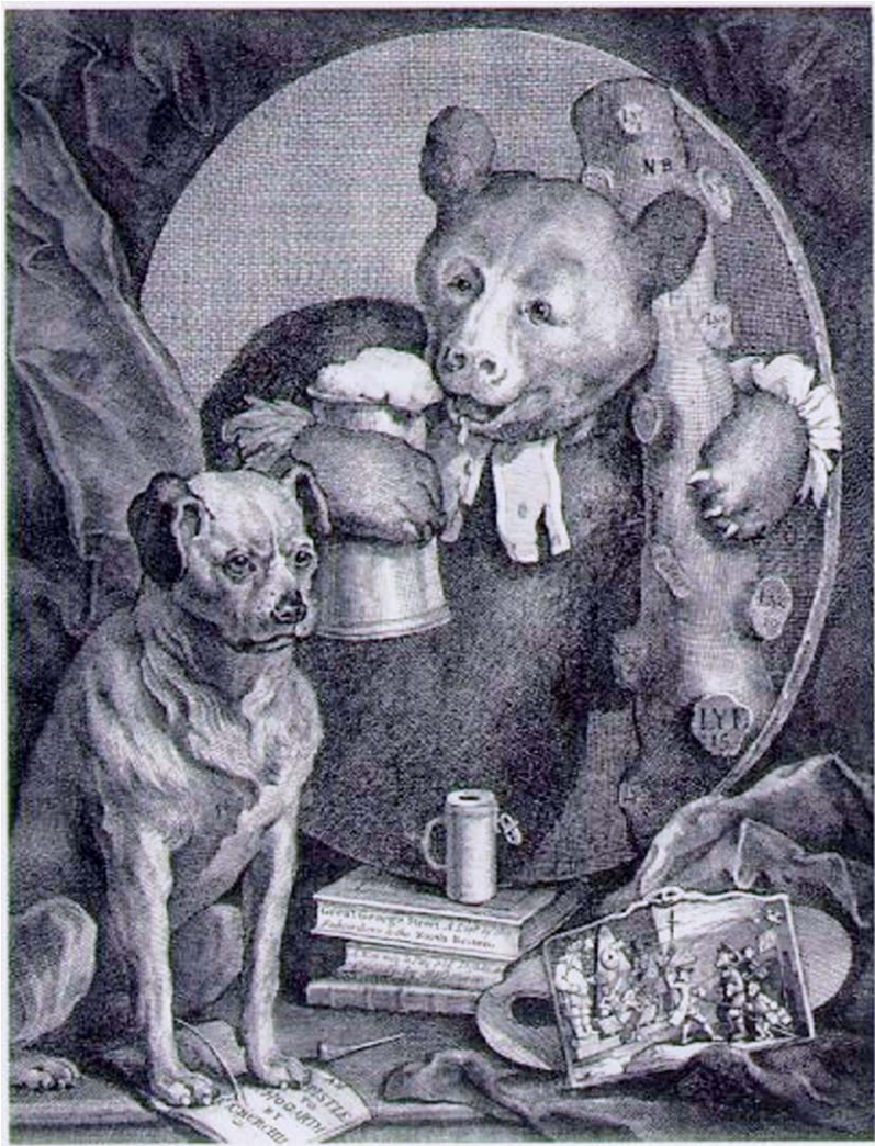
Hogarth gebruikt zijn Mopshond in 1763 in een satirische gravure, The Bruiser genaamd. Kunstcriticus Charles Churchill wordt hier afgebeeld als een dronken, kwijlende beer. De hond plast zittend over het Epistle to William Hogarth , gepubliceerd door Hogarths aartsvijand Charles Churchill.

het schilderij niet bepaald de mode uit die tijd. In 1824 wordt The Painter and his Pug aangekocht door de National Gallery in Londen en in 1951 is het overgebracht naar de Tate Gallery aldaar.