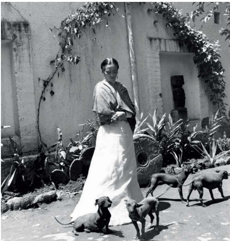
Frida Kahlo met vier Mexicaanse Naakthonden, het ras dat ze haar hele leven bezat. De foto is gemaakt door Gisèle Freund, destijds een bekende fotografe van schrijvers en kunstenaars.