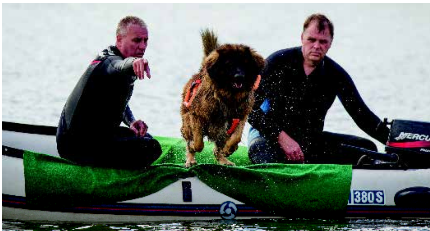
'Nationale Brevetten Waterwerk'. De honden gaan te water en leggen verschillende proeven af.

en alle in (ras)honden geïnteresseerden belangrijk. Dat wordt bevestigd door het besluit dat de nieuwsbrief Raadar weer iedere maand gaat verschijnen en aan duizenden abonnees (gratis) wordt verzonden. In het kynologisch maandblad ONZE HOND wordt iedere maand, in de rubriek Raadar XL , een artikel gepubliceerd over onderwerpen en zaken waar de Raad van Beheer mee bezig is.