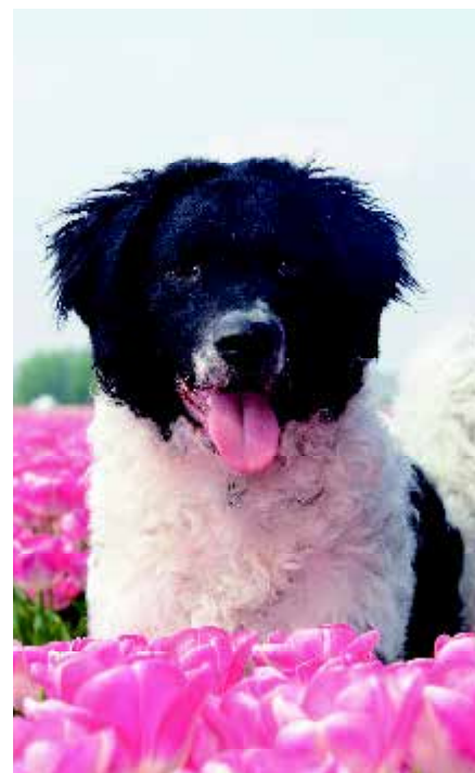
De Wetterhoun is het eerste ras waarvoor toestemming wordt gegeven om een hond van een ander ras in te kruisen.

Een novum in Nederland is de zogenoemde 'Eendaagse', een show voor alle rassen op één dag, voorafgaand aan een tweedaagse show. De Winner 2013 heeft de primeur. Het zijn dagen waarop uiterlijke schoonheid meer dan waar ook in de kynologie in de belangstelling staat, maar de keurmeesters weten dat dit