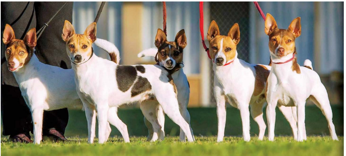
Gumhaven Tenterfield Terriërs.