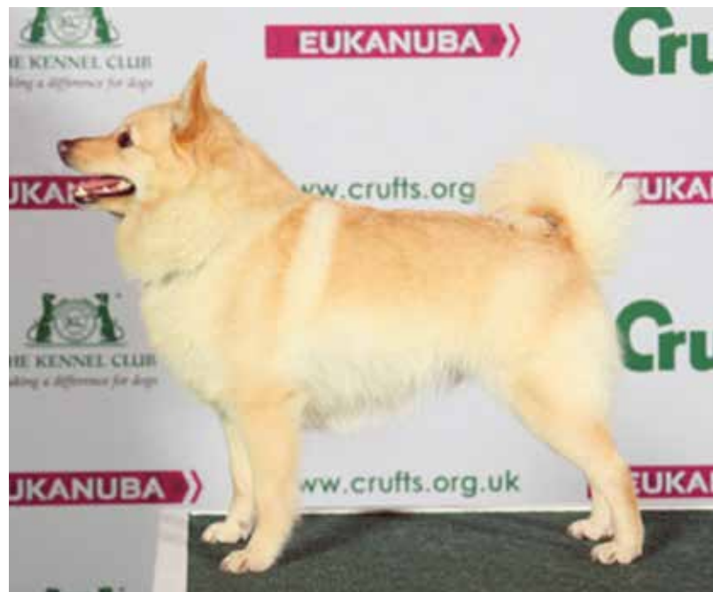
Beste van het ras bij de Schipperkes op Crufts 2015 wordt Chadbower Bonnie Rye, een crèmekleurig teefje. In Nederland wordt uitsluitend de kleur zwart geaccepteerd.

zoeken wordt vermeld. Zo zijn een preventieve screening m.b.t. heupdysplasie, elleboogdysplasie, oogonderzoeken en doofheidonderzoeken verplicht. Met Schipperkes die lijden aan epilepsie, distichiasis en patella luxatie (losse knieschijf) mag niet worden gefokt. Schipperkes kunnen bij de geboorte een staart hebben of staartloos zijn. In 2006 wordt in België het couperen van staarten verboden en daarom zien we nu een staart, die bij voorkeur hangend wordt gedragen.