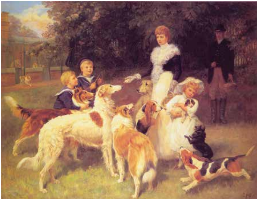
Ook koningin Alexandra van Engeland (1844-1925) heeft in haar kennels een Schipperke. Op dit schilderij, gemaakt in 1902 door Thomas Blinks en Frederick Morgan, zien we de koningin met drie van haar kleinkinderen. Het Schipperke springt op tegen prinses Mary (1897-1935). Zij is geboren op 'Sandringham House'.

ler is voortgekomen uit de grotere Leuvenaars, terwijl het Schipperke zijn voorouders vindt in de kleine Leuvenaars. Bij het opstellen van de eerste rasstandaard voor het Schipperke, in 1888, wil men ook de Leuenaar daarin opnemen. Echter, met de opstelling van de tekst 'struikelt' men over de eis van het gewicht, maximaal 9 kilo. En daarmee is er geen plaats voor de Leuenaar in de rasstandaard van het Schipperke.