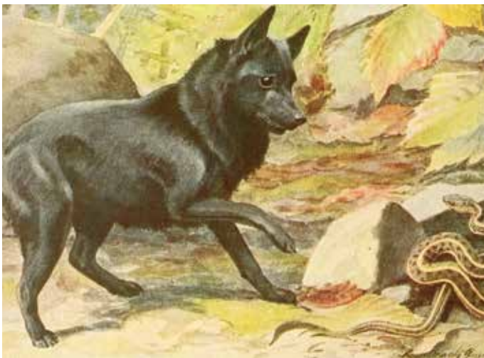
Louis Agassiz Fuertes (1874-1927) tekende dit Schipperke dat een slang ontmoet. Afbeelding uit 'The National Geographic Book of Dogs', dat in 1919 verschijnt.

ler is voortgekomen uit de grotere Leuvenaars, terwijl het Schipperke zijn voorouders vindt in de kleine Leuvenaars. Bij het opstellen van de eerste rasstandaard voor het Schipperke, in 1888, wil men ook de Leuenaar daarin opnemen. Echter, met de opstelling van de tekst 'struikelt' men over de eis van het gewicht, maximaal 9 kilo. En daarmee is er geen plaats voor de Leuenaar in de rasstandaard van het Schipperke.