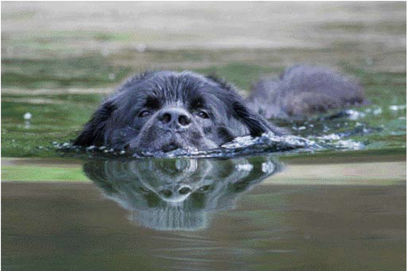
• Ieder jaar wordt de 'beste waterwerkhond van het jaar' gekozen.

achtergelaten? In de zestiende en zeventiende eeuw zijn het voornamelijk Basken, Fransen en Engelsen die de walvisrijke wateren van Canada bevissen. Hebben zij dogachtigen uitgevoerd of ingevoerd? Zijn zwart-witte dogachtige 'slagershonden' uit Engeland meegenomen naar Canada of juist gekruist met uit Newfoundland meegebrachte honden? De mogelijkheden zijn legio.