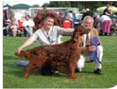
• Ierse Setter uit de kennel 'Dubliner' op een buitententoonstelling in Zweden, meer dan zeventig jaar later. (Fotograaf onbekend).

In de jaren 1799-1805 publiceert Sydenham Edwards in Engeland zijn 'Cynographia Britannica', waarin sublieme gravures staan van tientallen hondensrassen. Ook de drie setter variëteiten zijn present: Ierse Setter