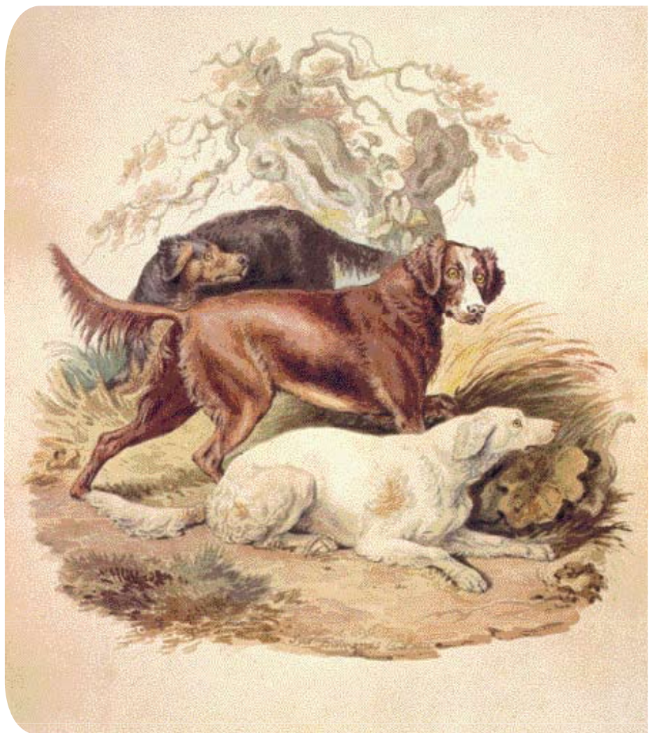
• Drie Settervariëteiten op een afbeelding uit 'Cynographia Britannica' (1799-1805) van Sydenham Edwards. De Ierse Setter, met een witte bles, staat in het midden.