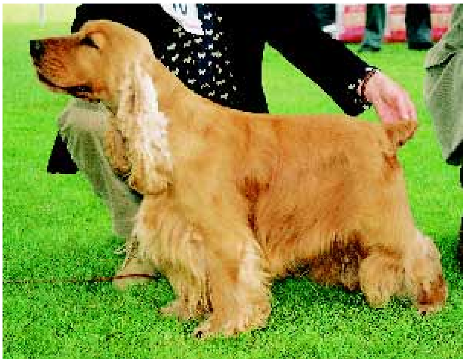
Meer dan 70 jaar later is de Engelse Cocker Spaniel nog steeds een veel geziene ras op tentoonstellingen. Maar nu met meer beharing en lager op de benen.