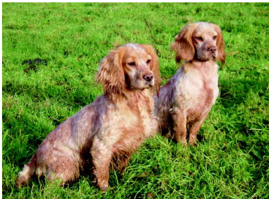
'Hartways' working Cockers. Het verschil in type met de 'show Cocker' is erg groot.

grootste rasvereniging. Net zoals vele andere clubs wordt ook zij geconfronteerd met een tweede, een derde en zelfs een vier erkende rasvereniging. Zo zijn er nog de Cocker Spaniel Club ( www.engelsecockerspanielclub.nl ), de Engelse Cocker Spaniel Club Nederland ( www.ecsn.nl ) en de Vereniging voor Liefhebbers van de Engelse Cocker Spaniel ( www.vlecks.nl ). Voor consumenten zeer verwarrend, én of vier rasverenigingen bevorderlijk zijn voor de gezondheid, het welzijn en het op peil houden van de kwaliteit van de Engelse Cocker Spaniel, is maar zeer de vraag. Op den duur zal er toch overeenstemming moeten worden bereikt over een aantal belangrijke zaken, bij voorbeeld over het fok- en gezondheidsbeleid. En als daarover overeenstemming is bereikt, dan lijkt mij het bestaan van vier rasverenigingen, die alle vier in dezelfde vijver vissen en min of meer hetzelfde nastreven, overbodig. Met dank aan de NMa en anderen... ■