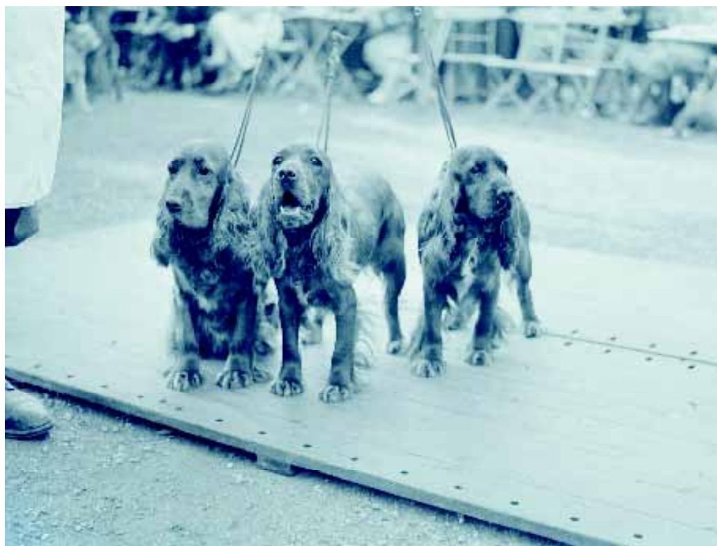
De groep rode Cocker Spaniels van mevr. Van Herwaarden in 1938.

vervolgt met de cryptische tekst: 'Zoo'n bemoedigend resultaat geeft weer hoop voor de toekomst en wie weet, als alle strubbelingen nu op bevredigende wijze worden opgelost, overbodige conflicten worden bijgelegd en als allen verder handelen in een geest van verdraagzaamheid, dat dan