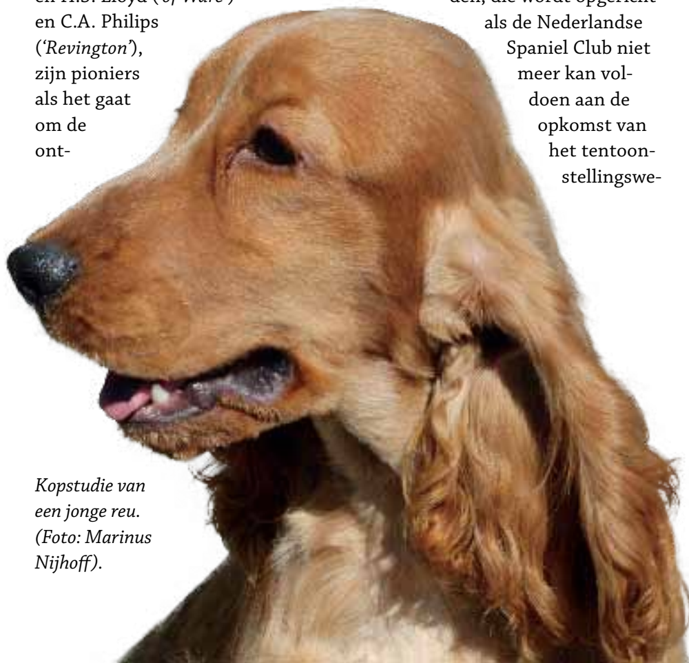
Kopstudie van een jonge reu. (Foto: Marinus Nijhoff).

Een ander bekend kynologisch echtpaar dat in de jaren twintig een stempel drukt op de Cocker Spaniel wereld, is baron en baronesse Tindal ('Negro'). Zij zijn, net als de Van Herwaardens, betrokken bij de oprichting (1926) van de Club voor Spaniels en Wachtelhonden, die wordt opgericht als de Nederlandse Spaniel Club niet meer kan voldoen aan de opkomst van het tentoonstellingswe-