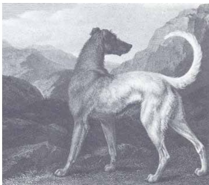
Irish Greyhound 'Oisian' in 'Sportman's Cabinet' (1803) op een gravure van Phillip Reinagle.

uit Dublin worden gezien als de laatste pure Ierse Wolfshonden én als belangrijke links naar het heden; veel hedendaagse Ierse Wolfshonden gaan terug op zijn fokkerij. De honden van Hamilton Rowan gaan terug op 'Oisian', de Ierse Wolfshond die Phillip Reinagle in 1803 tekent en die is afgebeeld in Sportman's Cabinet . De meest bekende teef in die periode is 'Bran', die Archibald Hamilton Rowan later aan Lord Nugent schenkt.