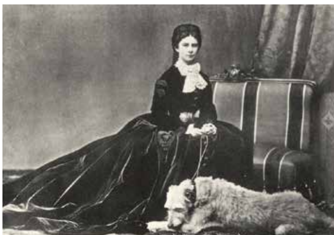
De Oostenrijkse keizerin Elisabeth (1837-1898) – Sisi – was een liefhebster van de Ierse Wolfshond.

Een Ierse Wolfshond is een indrukwekkende verschijning, die ontzag in boezemt. Hij is aanhankelijk, rustig en bedachtzaam, stelt gezelschap op prijs, maar blijft een typische windhond, die zelf wel bepaalt of een opdracht wordt uitgevoerd of niet.