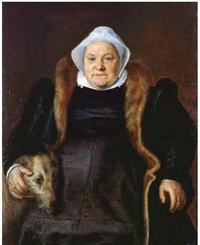
'Portrait d' une vieille dame' of 'La femme du fauconnier'. De vrouw van de valkenier, uit 1558 en geschilderd door de Vlaamse schilder Frans Floris de Vriendt (1517-1570). Links van deze gezette dame het hoofd van een Ierse Wolfshond. (Musée des Beaux-Arts, Caen, Frankrijk.)

Irish Greyhound, (Irish) Wolfdog, Canis graius Hibernicus en Wolfhound. Dat de vermeldingen zo talrijk zijn, komt omdat deze wolvenjager regelmatig als geschenk fungeert aan koningen en de adel. De 'export' van Wolfshonden wordt door Oliver Cromwell, lord protector van Engeland, in 1652 aan banden gelegd, omdat hun aantal te drastisch vermindert. Maar in feite zet Cromwell een streep door de niet aflatende stroom