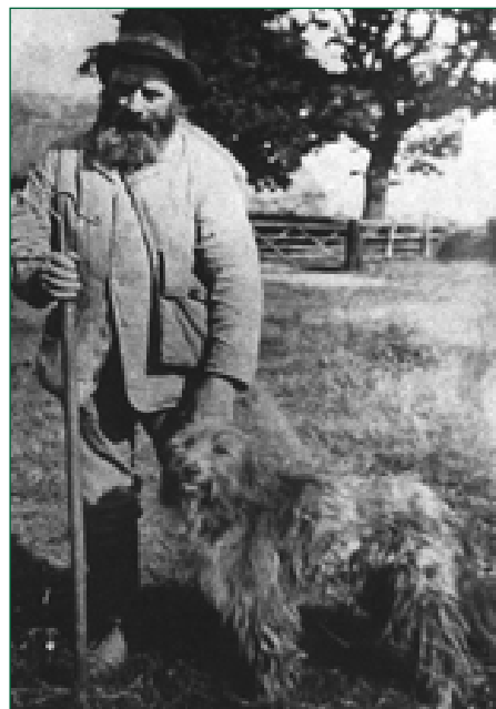
• Oude foto van een herder in Norfolk (1923) met zijn Smithfield Sheepdog. (Uit: Hancock, 'Old Farm Dogs').