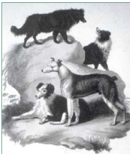
• 'Sheepdogs and shepherd's Cur dog', circa 1800. De Cur dog is de kortharige met de kleine oortjes. (Uit: Sydenham Edwards, 'Cynographia Britannica').

E en classificatiesysteem voor honden is eeuwenoud. Al voor de Romeinse tijd onderscheidt men verschillende typen. Maar ook de Romeinen zelf maken zo'n indeling; zij onderscheiden huishonden, jachthonden, vechthonden, speurhonden, windhonden en schepershonden of herdershonden. Laatstgenoemden zijn de Canis pastorales pecuarii en op hen komen we terug.