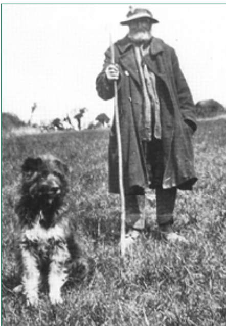
• De Old Welsh Grey Sheepdog, een kleine, ruige herdershond uit Wales. (Uit: Hancock, 'Old Working Dogs').

er niet vandoor kunnen gaan. Een niet onbelangrijk aspect van het werk van schepers- en herdershonden is ook het verjagen van veedieven, wilde dieren en hongerige zwerfhonden. We moeten ons voorstellen dat in het Engeland, Ierland, Schotland en Wales van een paar eeuwen geleden