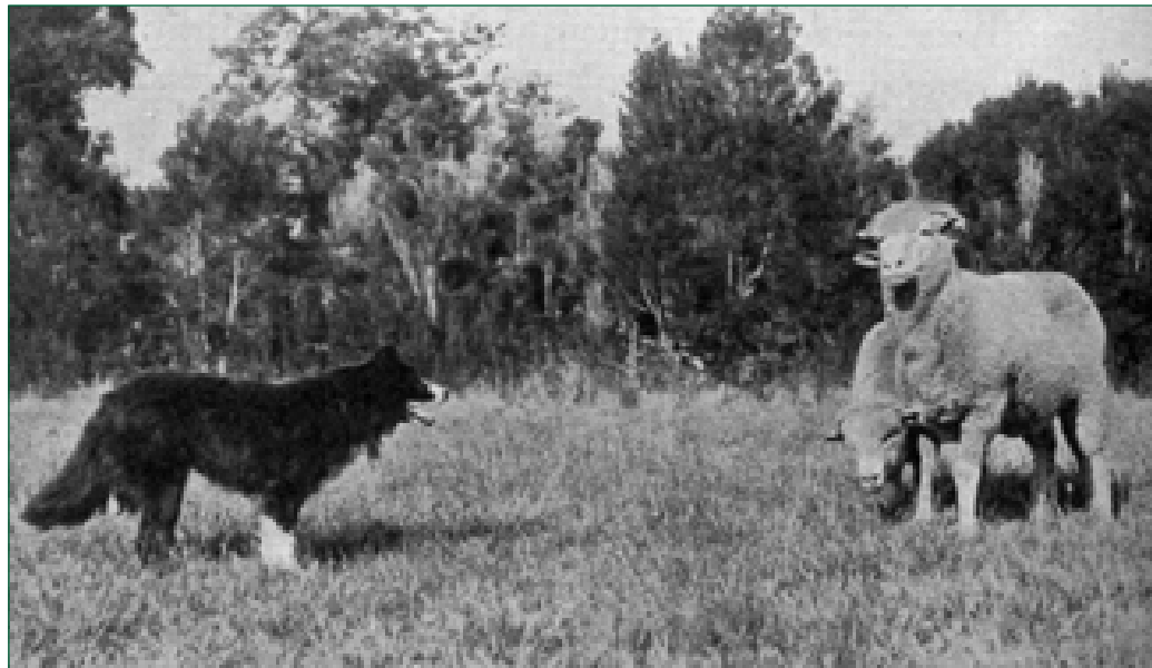
• Een Welsh Sheepdog aan het werk tijdens een Field Trial.

zoveel kuddes te bewaken en te begeleiden zijn, dat er zich in ver uit elkaar gelegen gebieden eigen typen – soms zelfs rassen – herders- en schepers-honden ontwikkelen.