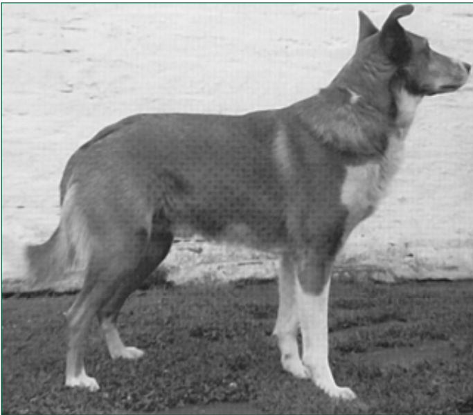
• Geen echte Welsh Hillman, maar een frappante terugslag op dit oude ras. (Uit: Hancock, 'Old Working Dogs').