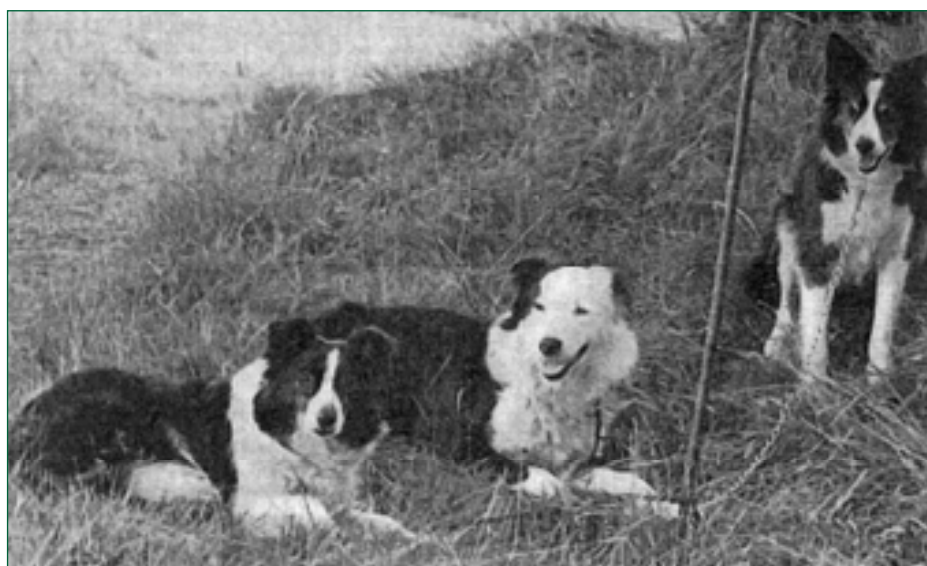
• Cumberland Sheepdogs tijdens een Sheepdog Trial.

In deze eerste aflevering van 'Oude Hondenrassen' nemen we de Canis pastorales pecuarii of wel de herdershond onder de loep. Deze groep ontwikkelt zich in Europa tot vele verschillende rassen, waarin echter de