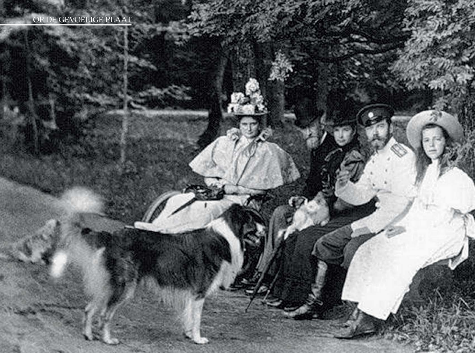
Tsaar Nicolaas II (tweede van rechts) en tsarina Alexandra Fjodorovna (eerste van links). Rechts van de tsaar zijn jongere zuster Olga Alexandrovna, ook een groot liefhebster van de Schotse Herdershond. Deze foto is gemaakt bij het Gatchinapaleis, even buiten Sint-Petersburg.

een prachtige Collie cadeau, die ik Iman zal noemen.' Iman overlijdt in 1902 aan een hartkwaal, waarop een treurende Nicolaas aan zijn moeder schrijft: 'Ik heb zojuist een zwaar verdriet geleden – het verlies van de dierbare Iman. Hij stierf vannacht en ik ben de hele dag niet opgehouden met huilen.' Niet te geloven dat dit door dezelfde man geschreven is als hij die van zijn onderdanen de bijnaam 'bloedige Nicolaas' krijgt. Wanneer de tsaar en de tsarina in 1901 Parijs bezoeken, zijn ze in gezelschap van Lofki, hun Greyhound.