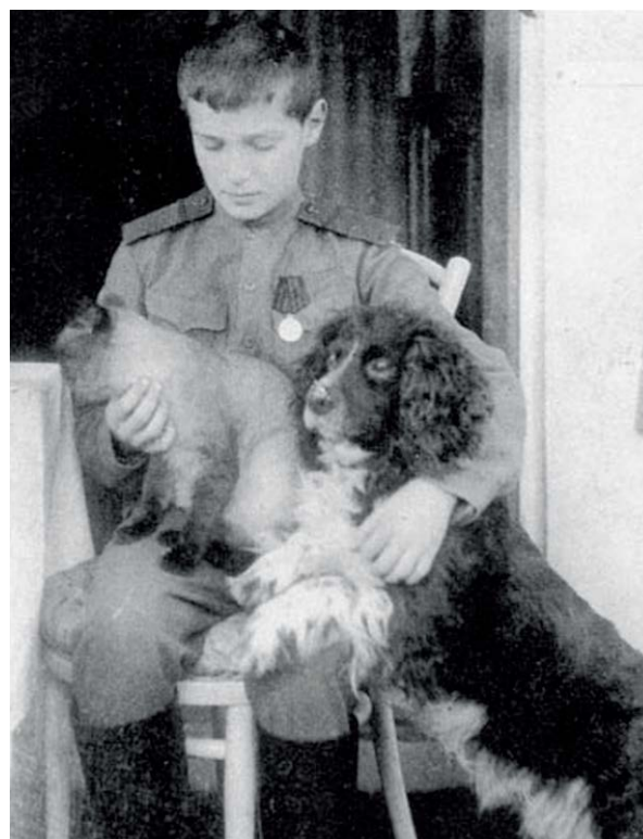
Tsarevitsj Aleksej (1904-1918) met zijn Engelse Springer Spaniel Joy en poes Kotka. Vanaf zijn vroegste jeugd draagt hij uniformen.

In datzelfde jaar krijgt Nicolaas van zijn schoonzuster, Elizabeth Fjodorovna, een Colliepup cadeau. Ter vervanging voor Raven. In zijn dagboek lezen we: 'Ella gaf me