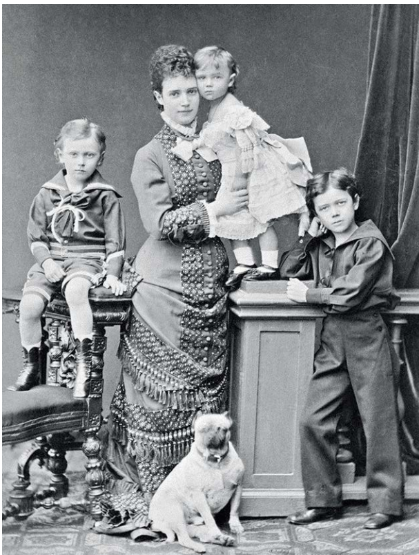
Tsaar Nicolaas II als kind (rechts) met zijn moeder Maria Fjodorovna (1847-1928), zijn broertje Georgi (1871-1899) en zusje Xenia (1875-1960). Op de voorgrond een Engelse Bulldog.

na, geboren als prinses Dagmar van Denemarken. Gaan we Nicolaas' stamboom na, dan zien we in drie generaties slechts drie Russische vorsten tegenover elf Duitse en Deense prinses en prinsessen. Zelf trouwt hij in 1894 ook met een Duitse prinses, Alix van Hessen-Darmstadt (1872-1918), die na haar huwelijk als tsarina Alexandra Fjodorovna door het leven gaat. Na de grootvorstinnen Olga (1895), Tatjana (1897), Maria (1899) en Anastasia (1901) wordt in 1904 zoon Aleksej geboren. Hij lijdt aan hemofilie, toen nog een dodelijke ziekte. De tsaar, de tsarina en hun