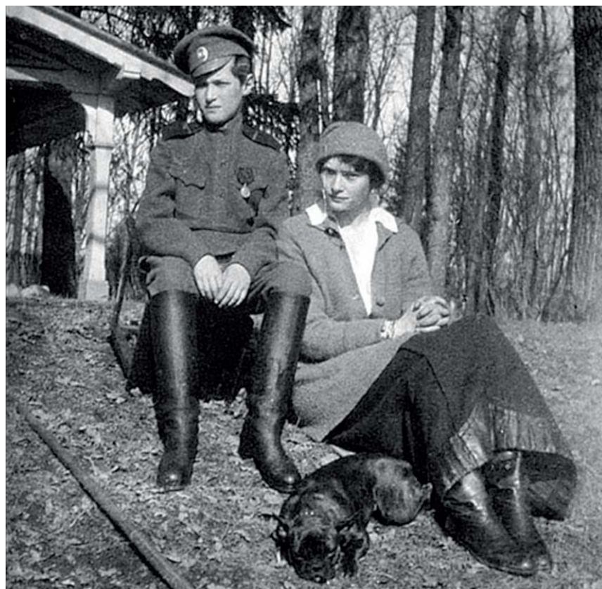
Tsarevitsj Aleksej (1904-1918) en grootvorstin Tatjana (1897-1918) met haar Franse Bulldog Ortipo, gefotografeerd tijdens hun gevangenschap.

burg vermoord door soldaten van het Rode Leger. Die moord had absoluut voorkomen kunnen worden, de tsaar was immers een volle neef van de Engelse koning George V, de Duitse keizer Wilhelm II, de Noorse koning Haakon VII, de Deense koning Christiaan X en de Griekse koning Constantijn I. Koning George V biedt aanvankelijk aan om naar kasteel Balmoral in Schotland te komen, maar die uitnodiging trekt hij onder druk van de politiek en het volk ook weer in. De stemming in het Verenigd Koninkrijk is tijdens de Eerste Wereldoorlog anti-Nicolaas en anti-Duits. Het volk aldaar is van mening dat deze tiran het beste kan blijven waar hij is, gevangen in Jekaterinenburg in het Oeralgebergte. Omdat geen van de familieleden asiel verleent aan het gezin Romanov, kan de gruwel daad zich voltrekken. Wanneer de lichamen van de vermoorde grootvorstinnen op een lorry worden geladen, valt uit een van hun wijde mouwen een klein hondje. Het is Jimmy, de King Charles Spaniel.