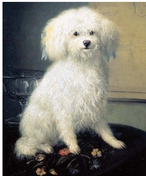
Dit schilderij van de Nederlands-Belgische kunstenaar Henriëtte Ronner-Knip (1821-1909) wordt Witte terriër genoemd. Er is een grote gelijkenis met leden van de Bichon-familie, zoals de Coton de Tuléar.

De Coton de Tuléar kwam in het begin van de jaren zeventig naar Amerika en werd in 2014 erkend door de American Kennel Club. Nu is het ras regelmatig te zien op de Westminster Dog Show. (Fotograaf onbekend.)