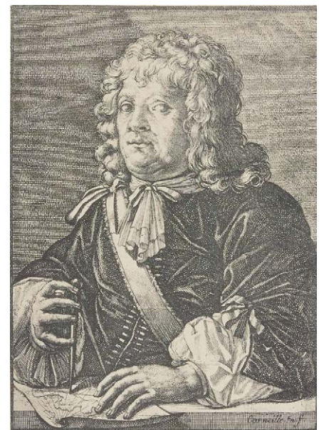
De Franse regionale gouverneur Etienne de Flacourt schreef het boek Histoire de la Grande Isle Madagascar , waarin kleine, witte hondjes worden vermeld.

van een uitgestorven Terrier-soort die op Madagaskar geleefd heeft. Ondanks de afstanden tussen de (ei)landen van herkomst zijn de diverse Bichons wel duidelijk aan elkaar verwant en delen ze een aantal kenmerken: een goed zichtbare overgang van het voorhoofd naar de neus, zwarte neusgaten, zwarte lippen, hangende oren en een staart die in een krul of gekruld over de ruglijn gedragen wordt. Een van de belangrijkste kenmerken van het ras is de witte vacht. Lichtgrijze schakeringen (een mix van witte en zwarte haren) en roodschemel (een mix van witte en reebruine haren) op de oren zijn toegestaan. Ook op andere delen van het lichaam kunnen die schakeringen aanwezig zijn, maar echt gewenst zijn ze niet.