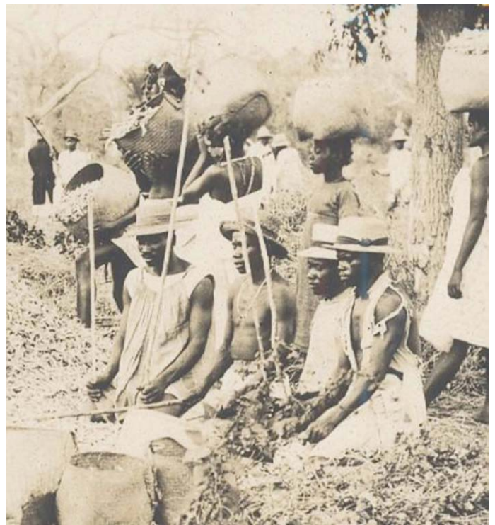
Katoenoogst op Madagaskar, 1924.

Het tweede deel van zijn naam dankt de Coton de Tuléar aan de havenstad Tuléar (ook bekend als Toliara) op het eiland Madagaskar, dat aan de oostkust van Afrika ligt. Het eerste deel verwijst naar zijn vacht, die aan katoenpluis doet denken. Vandaar coton , het Franse woord voor katoen. Met die vacht onderscheidt de Coton de Tuléar zich van andere Bichons, van wie de volledig witte vachten glad, gekruld of gegolfd zijn. Daarnaast herken je een Coton de Tuléar ook aan de vorm van zijn hoofd met een relatief lange en ietwat spitse neus. Die neus zou de erfenis zijn