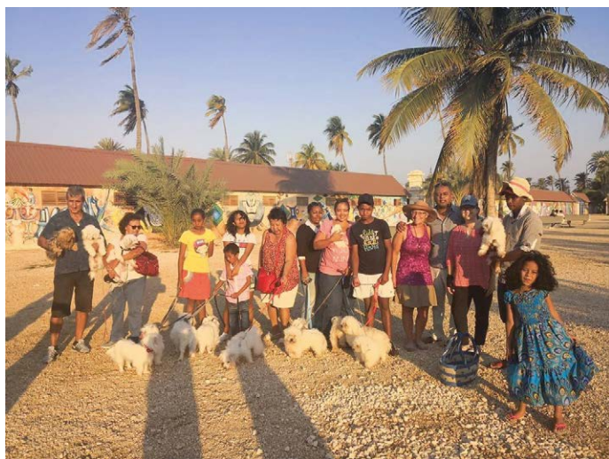
Groep Cotons op Madagaskar in 2018.

Ook na het Merina-koninkrijk verbleef de Coton de Tuléar in de hoogste kringen van de maatschappij. Op veel Franse schilderijen uit de achttiende en negentiende eeuw zijn Cotonachtige hondjes te zien, vaak in het gezelschap van Franse aristocratische dames. Als Franse families naar hun vaderland terugkeerden, namen ze uiteraard hun witte