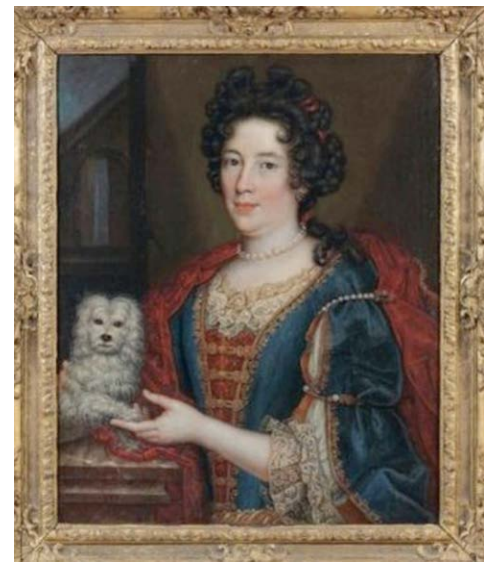
In het zeventiende- en achttiende-eeuwse Frankrijk was de beau monde dol op de kleine, witte schoothondjes, die de harten van de Franse adel stalen. Soms leken ze op een Coton de Tuléar, soms op een Maltezer.

uitgehongerde dieren, die in dorpen rondzwerven, vechtend om het smerigste varkensafval, of die naar de bossen gaan, waar ze als wilde dieren overleven tijdens hun jacht.' Diverse auteurs zijn van mening dat de Coton de Tuléar altijd een gezelschapshondje is geweest, dat nooit heeft gejaagd. Het voorgaande citaat van een ooggetuige bewijst het tegendeel.