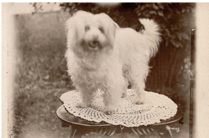
Zeldzame prentbriefkaart van een Coton de Tuléar, circa 1915.

hondjes mee. Zo kwam het dat de Cotons tot aan het begin van de twintigste eeuw voornamelijk in het bezit van de heersende klasse waren. Uiteindelijk heeft de Fédération Cynologique Internationale (FCI) bepaald dat Madagaskar weliswaar het land van oorsprong is, maar Frankrijk de patronage krijgt.