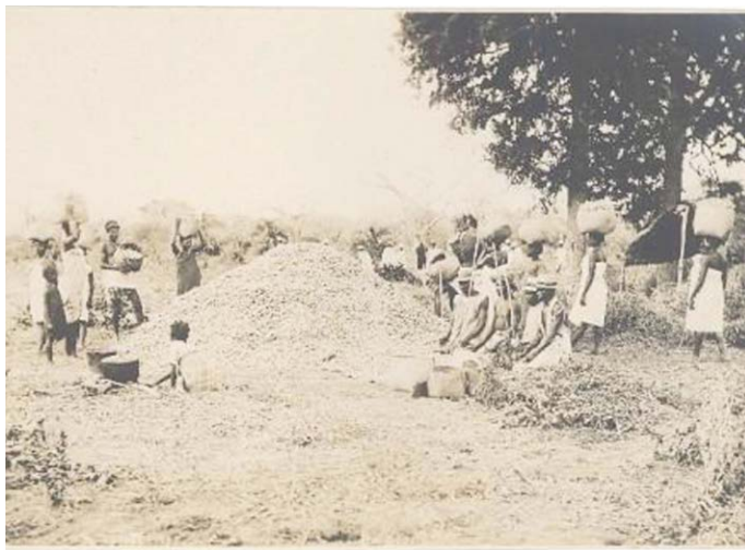
Katoenoogst op Madagaskar, 1924.

Toegegeven, niet direct een hondenras waarbij je onmiddellijk een beeld voor ogen hebt. En dat geldt ook voor het (ei)land van herkomst: Madagaskar. Daarbij komt nog dat de Coton de Tuléar een aantal lookalikes heeft. Dit ras behoort tot de familie van de Bichon, net zoals zeven andere kleine rashondjes die allemaal veelal een witte vacht hebben. Zo is er de Maltezer van het eiland Malta, de Bolognezer uit de Italiaanse stad Bologna, de Havanezer uit de Cubaanse hoofdstad Havana, het Leeuwhondje uit Frankrijk, de Bichon Frisé (of Bichon Tenerife) uit Frankrijk-België en tot slot de Bolonka Zwetna en de Bolonka Franzuska, beide uit Rusland. In 2008 publiceerde de Duitse kynoloog Wolfgang Knorr het boekje Bichons. Kleinhunde mit Chic und Charme . Met die titel is de Coton de Tuléar meteen goed gekarakteriseerd: een chique en charmant hondje.