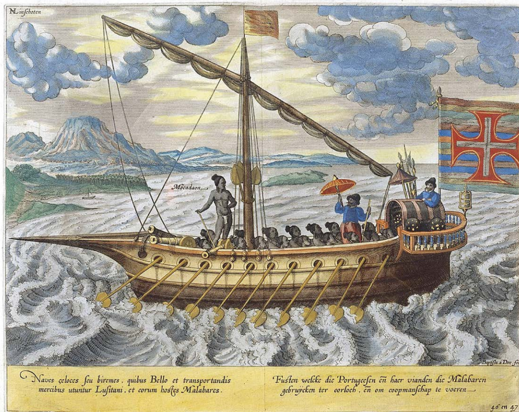
Een vergelijkbaar schip zou omstreeks 1500 schipbreuk hebben geleden in het Malagasy Kanaal. Een paar witte, kleine hondjes zouden dat overleefd hebben door naar Madagaskar te zwemmen. (Handgekleurde gravure van Jan Huygen van Linschoten, 1596.)

De eerste Nederlandse kampioen was de teef Duchesse du Ticoquin (Zwaagstra-Van Lier). De eerste internationale kampioentitel ging naar de reu Trigano van Brista's Hofke (Schiltman).