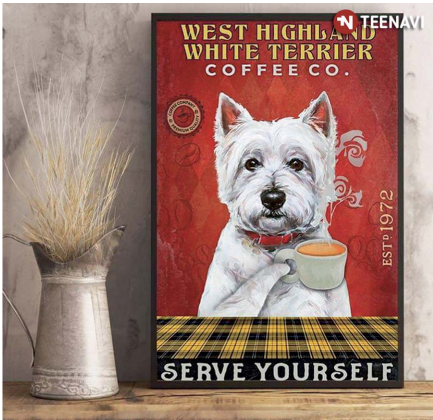
De Westie is van oudsher een veelgebruikt ras in reclames.