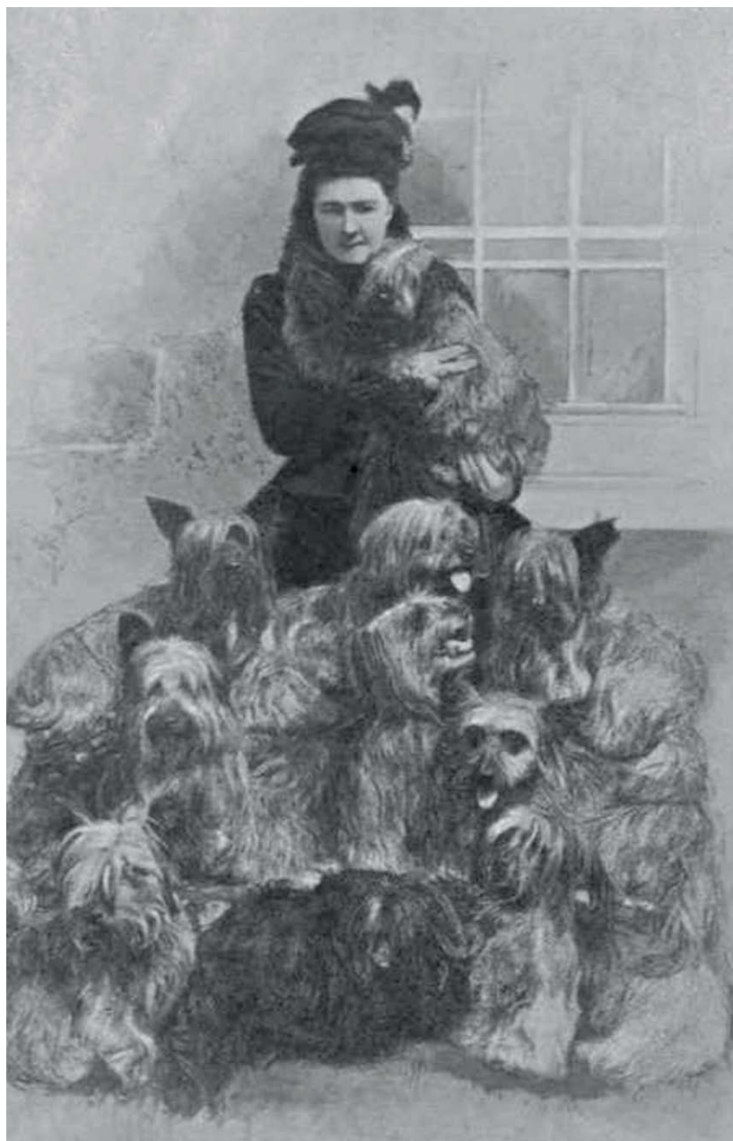
In 1871 vond de eerste hondenshow in Schotland plaats met diverse klassen voor verschillende types Schotse terriërs. Die types zie je op deze foto, samen met de gravin van Aberdeen.

Op de tentoonstelling in Birmingham, 1860, is al een klas opengesteld voor 'Schotse Terriërs'. Classificatie vindt onder andere plaats op grond van kleur en van staande of hangende oren. In 1871 vindt de eerste hondenshow in Schotland plaats met klassen voor verschillende types terriërs uit Schotland. In de 18de en 19de eeuw kunnen die verschillende types zich, dankzij hun geïsoleerde bestaan in afgelegen streken, regionaal ontwikkelen; soms zelfs binnen een groep van boeren of binnen een clan (familie). Zonder uitzondering zijn het jachthondjes op vossen, dassen, marters, wezels en ander klein schadelijk wild. Sommige families kunnen zich meutes veroorloven en dat stelt hen in de gelegenheid om een eigen type terriër te fokken. Dat persoonlijke voorkeuren daarbij een rol spelen, is zeker bij de West Highland White Terriër het geval.