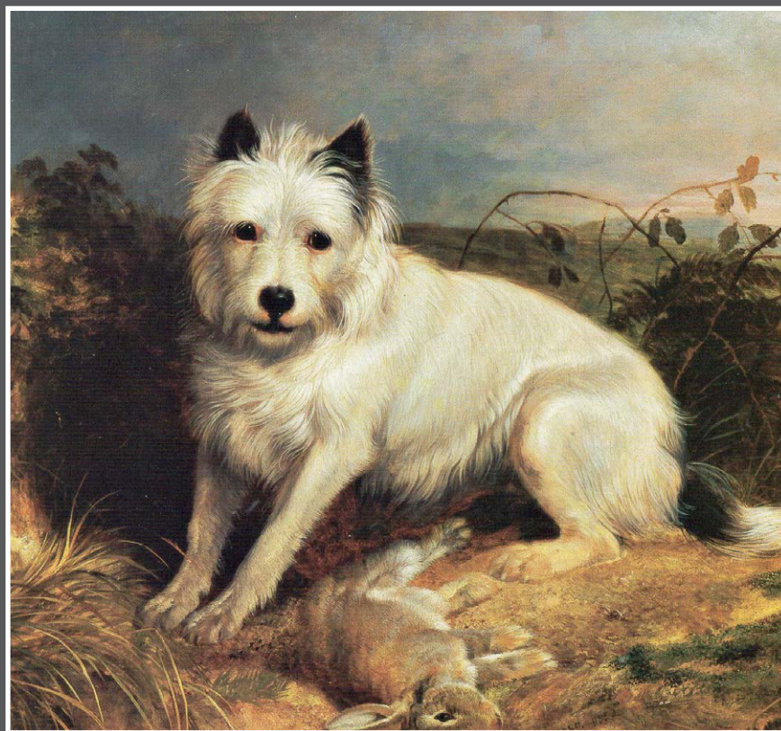
'The End of the Day', een schilderij van rond 1872 van Abel Hold van een vroeg type West Highland White Terriër met jachtbuit.

Voorheen de Poltalloch Terriër, vandaag de dag 'Westie'