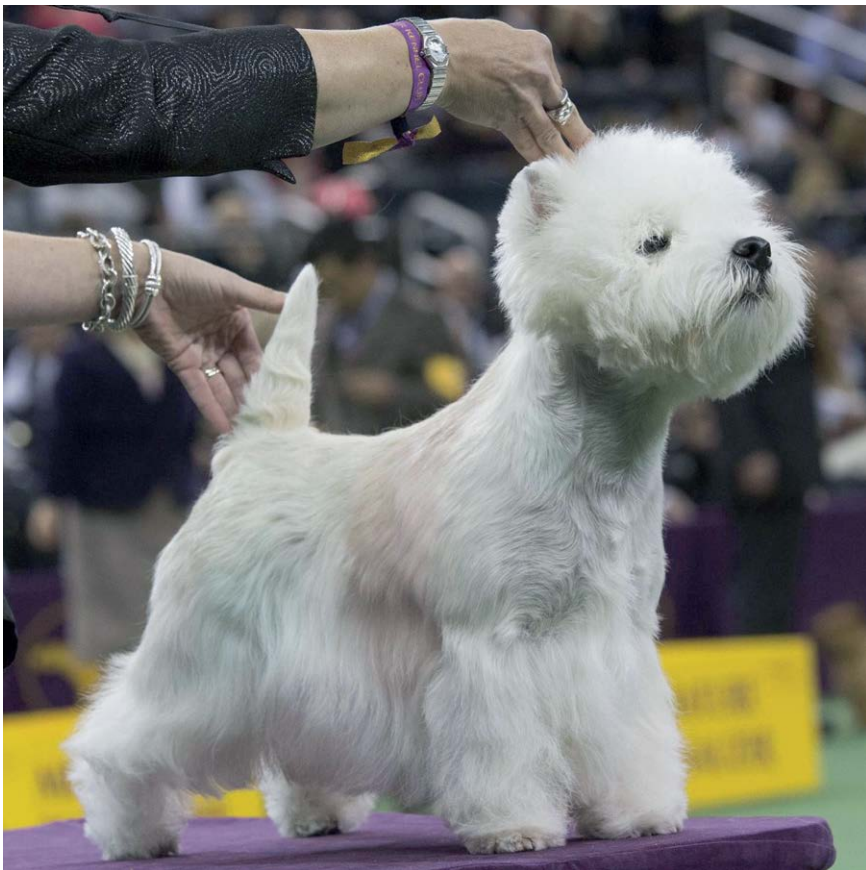
'Ch Burneze Geordie Girl' wint in 2016 een BIS op Crufts.