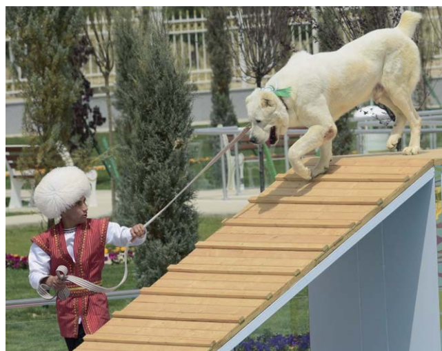
Behalve een show wordt er op de nieuwe nationale feestdag ook een behendigheidsdemonstratie georganiseerd. Hier is goed te zien dat de Alabay is gecoupeerd aan de oren en de staart.

er ook artikelen in over de folklore, de literatuur en de filosofie van Turkmenen, de wijze waarop het fokken en trainen van de Alabay moet gebeuren en over de unieke archeologische vondsten die in Turkmenistan zijn gedaan met betrekking tot de Alabay.