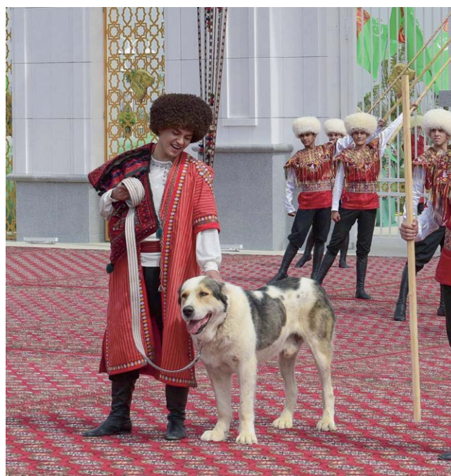
Bij de feestelijkheden op de Dag van de Alabay, de laatste zondag in april, wordt een wedstrijd georganiseerd waaraan Alabay's meedoen. De handlers dragen het nationale kostuum.

Het is verbazingwekkend hoeveel artikelen er in de pers verschijnen bij het instellen van de feestdag voor de Alabay. Ook grote buitenlandse persbureaus, zoals Reuters en Associated Press, wijden er lange berichten aan. President Berdimoeammedov heeft een feilloos gevoel hoe hij de persbureaus over de gehele wereld kan verleiden tot positief nieuws over Turkmenistan. Ook op social media vind je regelmatig berichten over de Alabay en de Akhal-Teke. President Berdimoeammedov fokt zelf Alabay's en hij doet dat met dezelfde reden als zijn Turkmeense voorouders, namelijk vanuit zijn plicht om het ras te beschermen en te behouden, zodat het erfgoed kan worden doorgegeven. Bij de viering van de 29ste verjaardag van Turkmenistans onafhankelijkheid werd het eerste nummer van het tijdschrift Türkmenin nusgalyk alabaýy gepubliceerd. Het nieuwe tijdschrift is bedoeld om de Alabay ook buiten Turkmenistan bekender te maken. Maar behalve dat staan