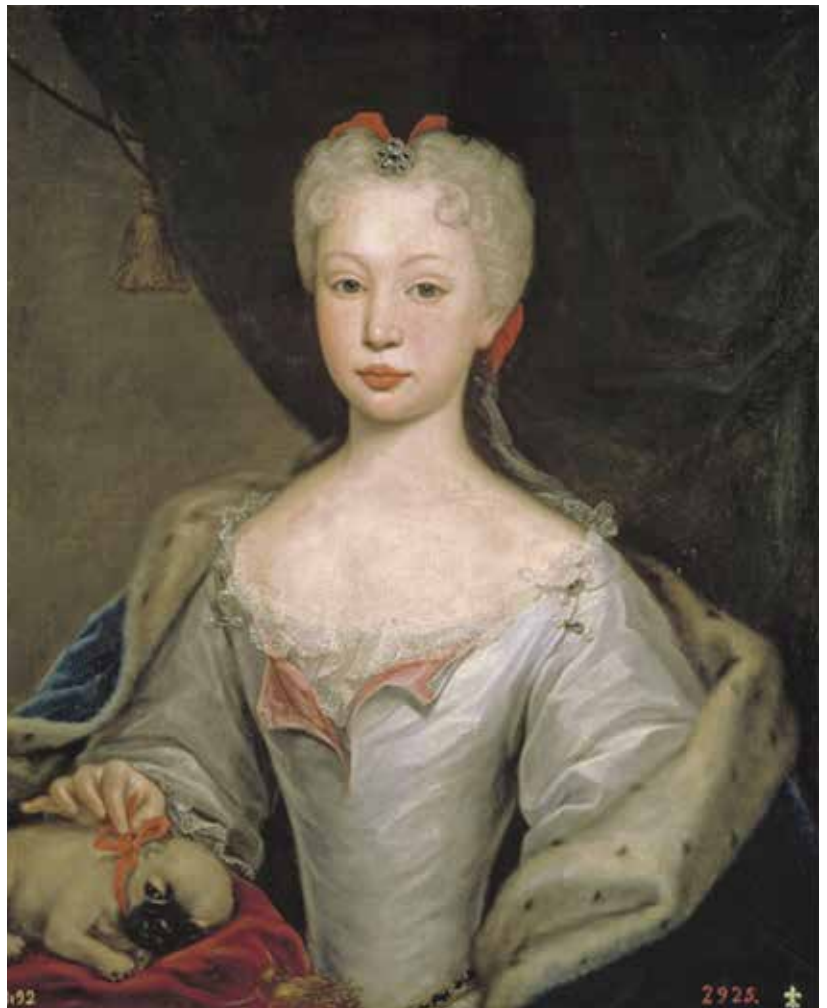
In 1725 schildert de Italiaanse kunstenaar Domenico Duprà (1689-1770) prinses Barbara van Portugal (1711-1758), echtgenote van koning Ferdinand VI van Spanje. Haar Mopshondje is getooid met een oranje strikje, een verwijzing naar de Mopsen van stadhouder-koning Willem III van Oranje.

Al in 1115 voor Chr. bestaat er in China nauwelijks de functie van Chanchien. Dat is een soort hondenverzorger, maar wellicht meer dan dat omdat deze Chanchien ook als taak heeft de kwaliteit van bepaalde honden te beoordelen. Keurmeester avant la lettre. Een kleine, kortneuzige hond, laag op de benen, wordt in China pai genoemd. Chinezen zijn gewend om op matten