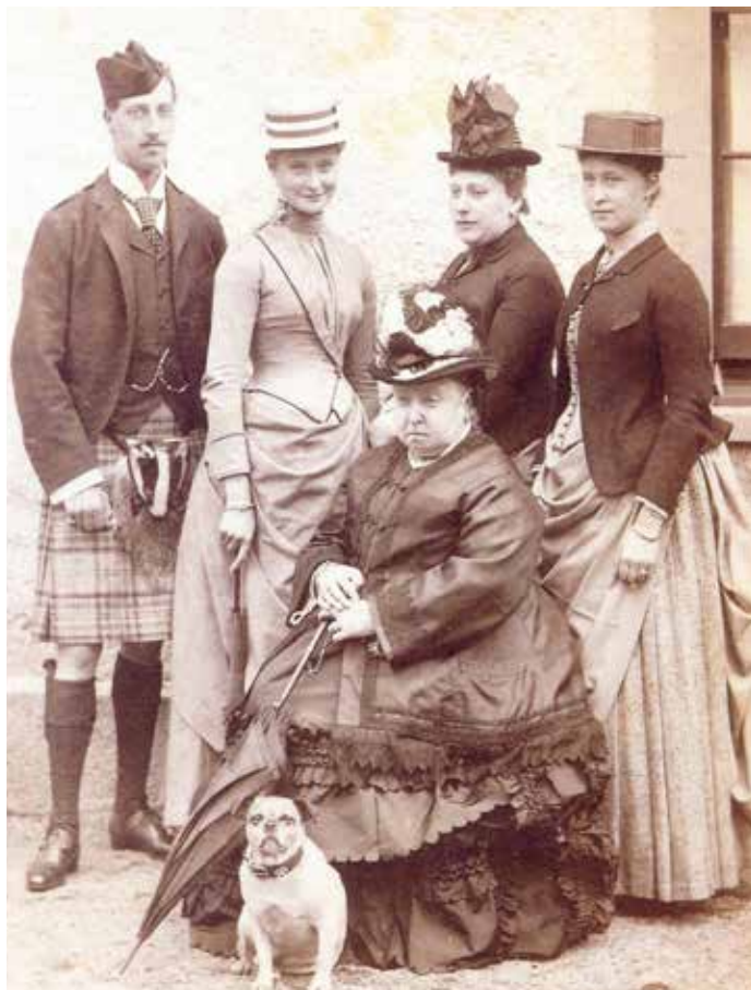
Koningin Victoria (1819-1901) van het Verenigd Koninkrijk met enkele familieleden, gefotografeerd op Balmoral Castle in 1887. Victoria fokt apricot Mopshonden. (Uit: Noble Hounds and Dear Companions .)

scheutje Pinscherbloed toegevoegd, met als gevolg dat zelfs vandaag de dag de 'Duitse Mops' in type en bouw nog steeds sterk afwijkt van het Engelse type Mopshond. De langneuzige, slanke, tamelijk hoogbenige Duitser is feitelijk een op zichzelf staand ras geworden, wat in de belangrijkste kenmerken niet overeenkomt met wat de standaard eist, zij het dan dat hij juist uitmunt in de aalstreep. (Dat is een donkerkleurige streep op een lichtere ondergrond, vanaf de schouder tot aan de staartaanzet.)