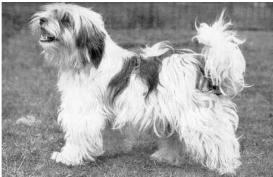
Deze Tibetaanse Terriër wordt in Hutchinson's Dog Encyclopaedia (1935) opgevoerd als een van de beste binnen het ras.