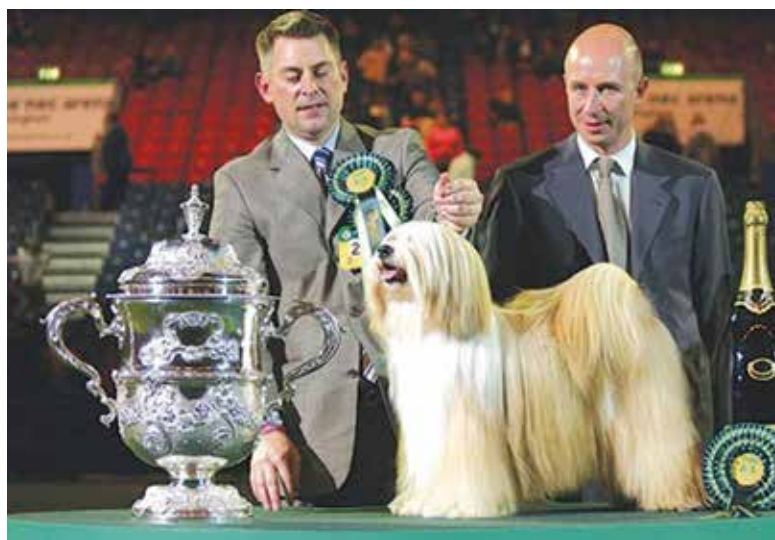
In 2007 wordt een Tibetaanse Terrier Best in Show op Crufts. Ch. Araki Fabulous (roepnaam 'Willy'), is eigendom van Smith en Shaw en vorgebracht door de Amerikaanse handler Larry Cornelius.

De rasverenigingen hebben elk hun fokreglement en letten daarmee op de gezondheid van het ras. Belangstellenden voor een pup kunnen op de websites van de aangesloten fokkers hun licht opsteken. ■