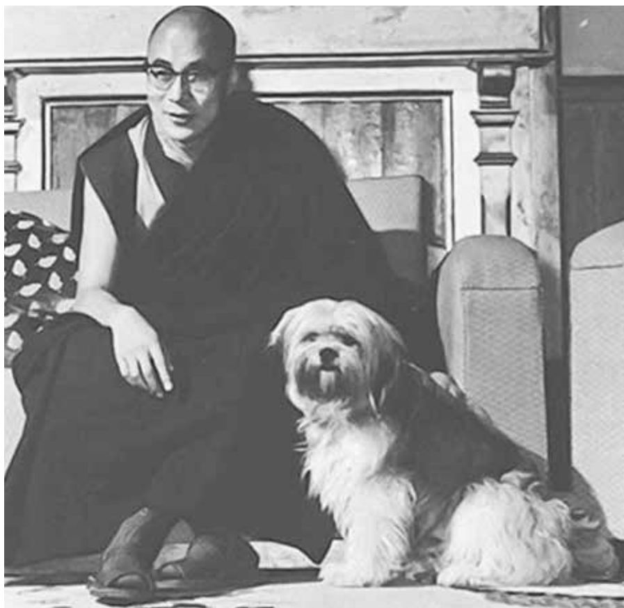
Zijne Heiligheid de veertiende Dalai Lama met een Tibetaanse Terriër. Hij wordt in 1935 geboren als Lhamo Dhöndup en heet nu Tenin Gyatso. De dalai lama's zijn de belangrijkste tulku's, reïncarnaties van verlichte lama's.

Vanuit de historie van rashonden weten we: geef een