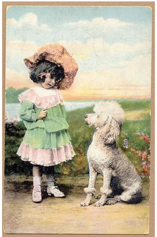
Poedels zijn vertegenwoordigd geweest in het circus, bij het variété, kunnen truffels zoeken, zijn geleide- of hulphonden en kunnen deelnemen aan verschillende hondensporten.

Het is opmerkelijk hoe weinig oude kynologische rasmonografieën er in de Franse taal over de Poedel zijn verschenen; voor oude beschrijvingen zijn we voornamelijk aangewezen op Duitse en Engelstalige literatuur. Dat geldt ook voor oude portretten van Poedels: zij zijn geschilderd door de meest vooraanstaande Engelse kunstschilders.