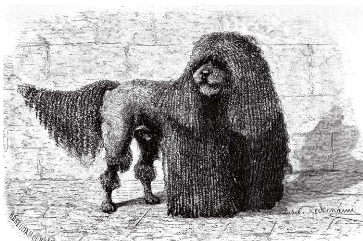
Schnüren Pudel uit Ludwig Beckmanns 'Die Deutschen Hunde und ihre Abstammung', verschenen in 1895.