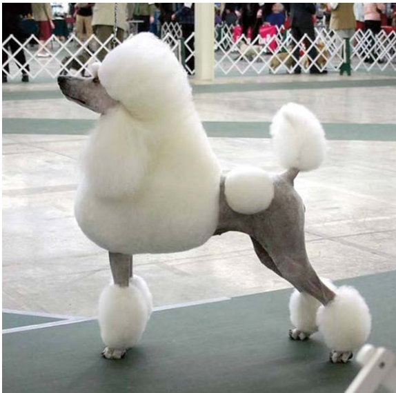
Een Duitse Fransman of een Franse Duitser?