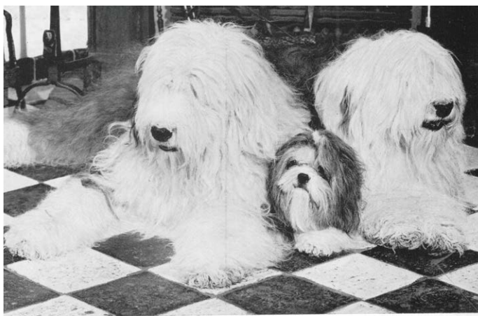
Drie kampioenen in kennel „Reeuwijk“