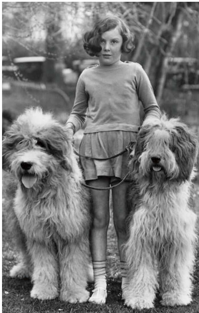
Een meisje met twee Old English Sheepdogs op de eerste tentoonstelling van de West of England Ladies' Kennel Society in Cheltenham, Gloucestershire.

De geschiedenis van de OES als rashond neemt een aanvang rond 1860; in 1865 wordt de eerste op een show in Islington tentoongesteld. In 1873 wordt er op de tentoonstelling in de Curzon Hall in Birmingham een aparte klas voor het ras opengesteld; daarin worden maar drie honden ingeschreven. Die zijn, aldus keurmeester Mr. M.B. Wynn, of poor quality. In 1888 worden er op dezelfde show 20 ingeschreven; 10 jaar later, op de Kennel Club Show, is dat aantal gestegen tot 55. Daaruit kun je afleiden dat de OES snel aan populariteit wint. In 1877 worden de eerste twee Bobtails door The Kennel Club geregistreerd als Sheepdog, short-tailed English. Niet verrassend: ze heten allebei Bob. De afstamming en de fokkers zijn onbekend. Pas in 1890 wordt de huidige naam van het ras, Old English Sheepdog, gebruikt. In 1888 (andere bronnen 1885) wordt de rasstandaard geschreven door Freeman Lloyd, later herschreven door Dr. Edwardes-Kerr.