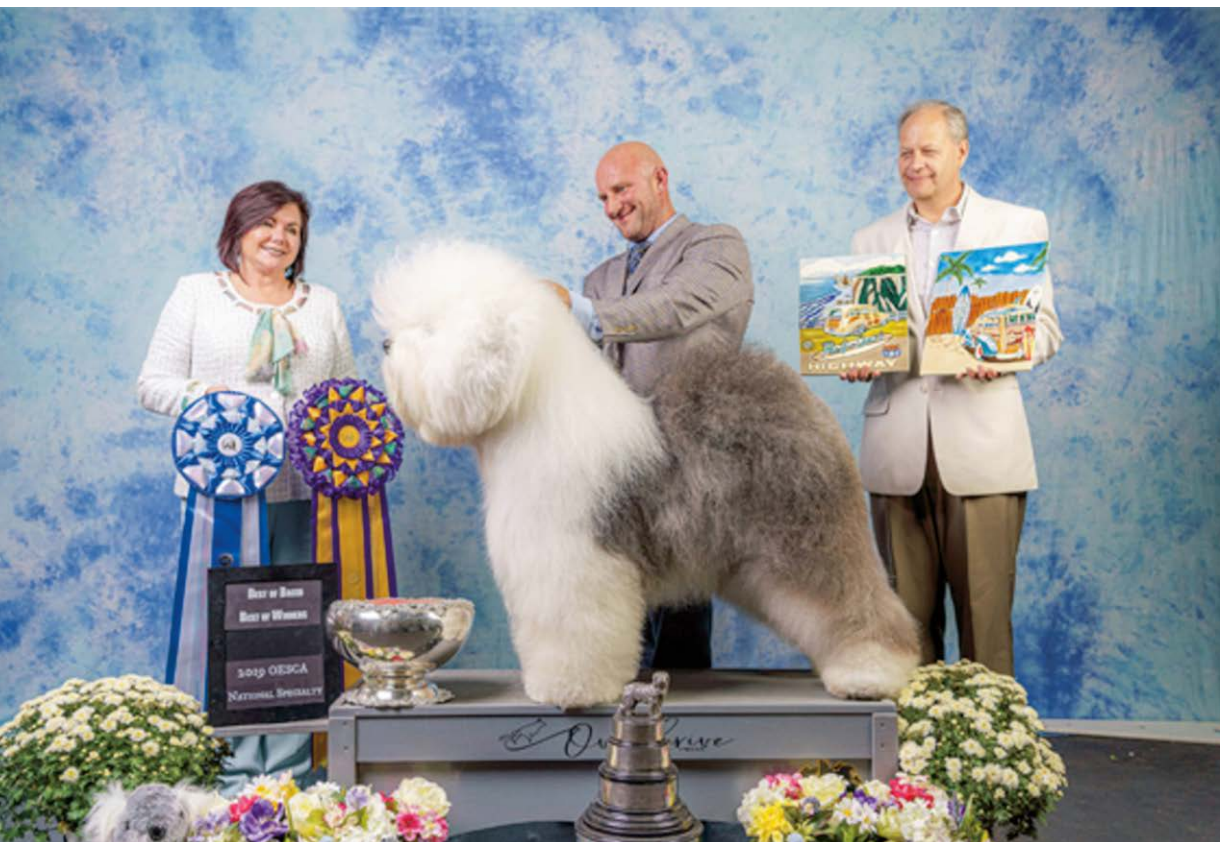
Ook in Amerika wordt de Old English Sheepdog een populair ras. Foto van de OESCA National Specialty met als beste van het ras 'Bugaboo's Courage of Conviction'.