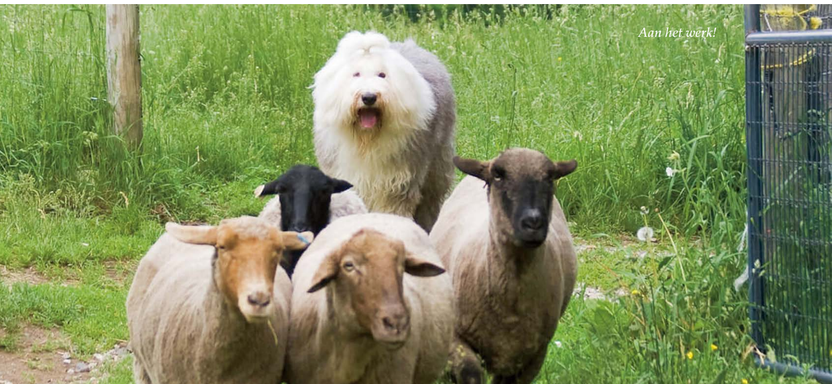
Aan het werk!

Andere bekende en succesvolle honden uit de Reeuwijk's kennel zijn Reeuwijk's Honest to Goodness , Reeuwijk's Fashionable Beauty (1979), Reeuwijk's Filmstar in Silver (1977)