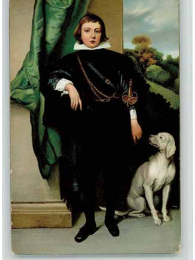
Anthony van Dyck (1599-1641) schildert in 1631 prins Ruprecht von der Pfalz (1619-1682) in gezelschap van een zilvergrijze hond met een witte borstvlek en een lange staart. (Kunsthistorisches Museum, Wenen.)

Natuurlijk moet in deze historie ook iets worden gezegd over het jagen met een Weimaraner. Vanaf zijn vroegste geschiedenis doet deze hond niets anders. Zoals eerder vermeld, is de Weimaraner een 'all round' jachthond. Zo wordt hij ook door jagers gekwalificeerd en geapprecieerd. In het Europa van de negentiende en de eerste helft van de twintigste eeuw is jagen bij de