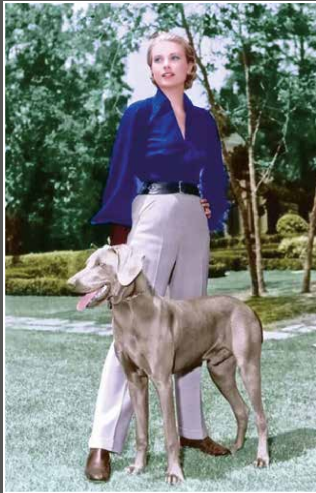
De Weimaraner is een keuze geweest van diverse royals, kunstenaars en filmsterren. Zo ook van prinses Gracia van Monaco (1929-1982).

- VOOR EN NA HET SCHOT, APPORTEUR EN ZWEETHOND -