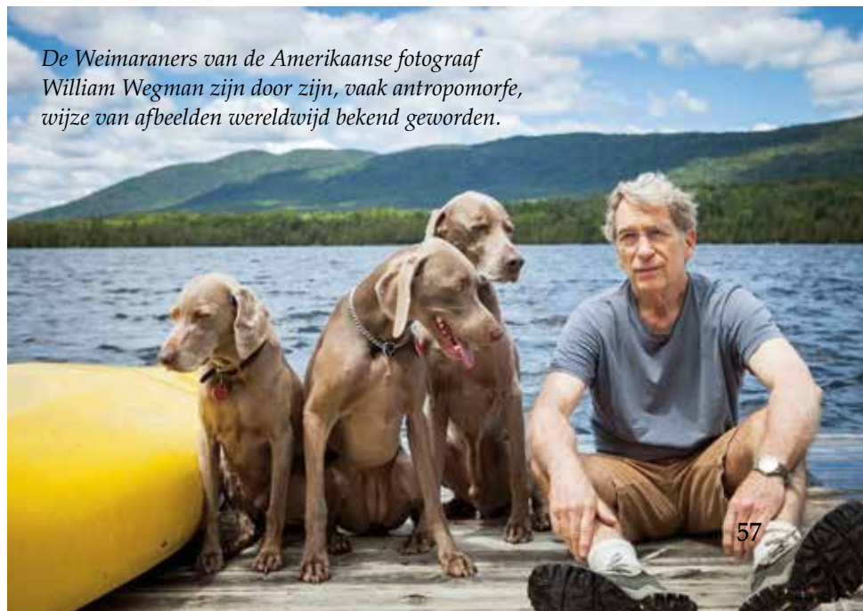
De Weimaraners van de Amerikaanse fotograaf William Wegman zijn door zijn, vaak antropomorfe, wijze van afbeelden wereldwijd bekend geworden.

NB Alle pogingen zijn in het werk gesteld om namen van fotografen van foto's te achterhalen. Dit is niet altijd gelukt. Wie rechten op afbeeldingen meent te hebben kan contact opnemen met de auteur: horter@fiscali.nl