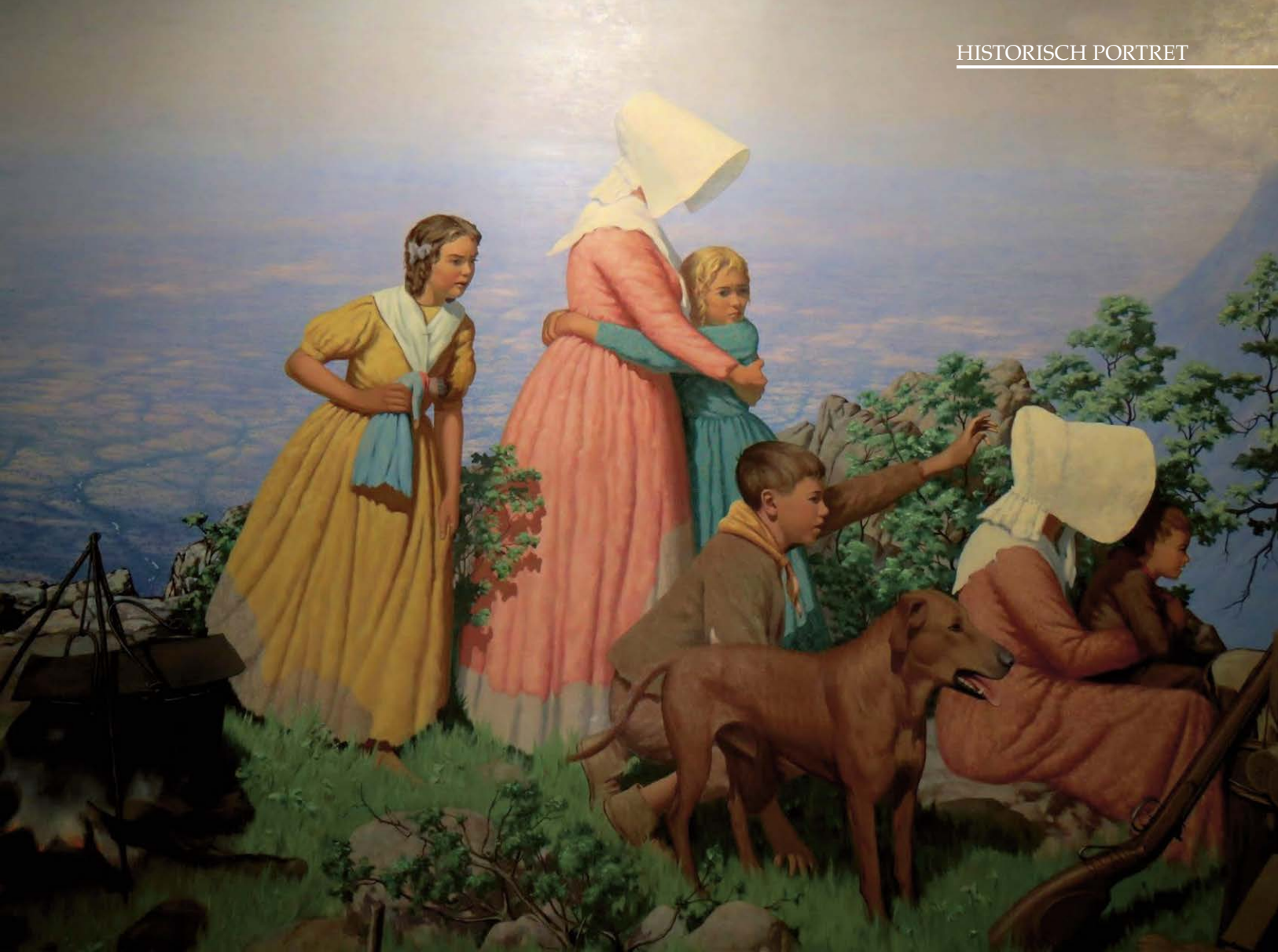
Afrikaner boeren trekken vanaf 1836 naar de binnenlanden van Zuid-Afrika en nemen hun gezinnen, bezittingen, vee en ook hun honden mee. Op de voorgrond onmiskenbaar een voorvader van de Rhodesian Ridgeback.