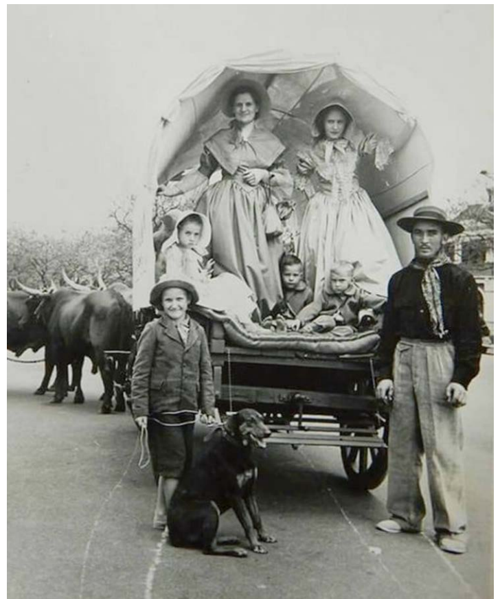
Een Afrikaner boer met zijn gezin in een ossenwagen. De hond is een vroeg type Rhodesian Ridgeback.