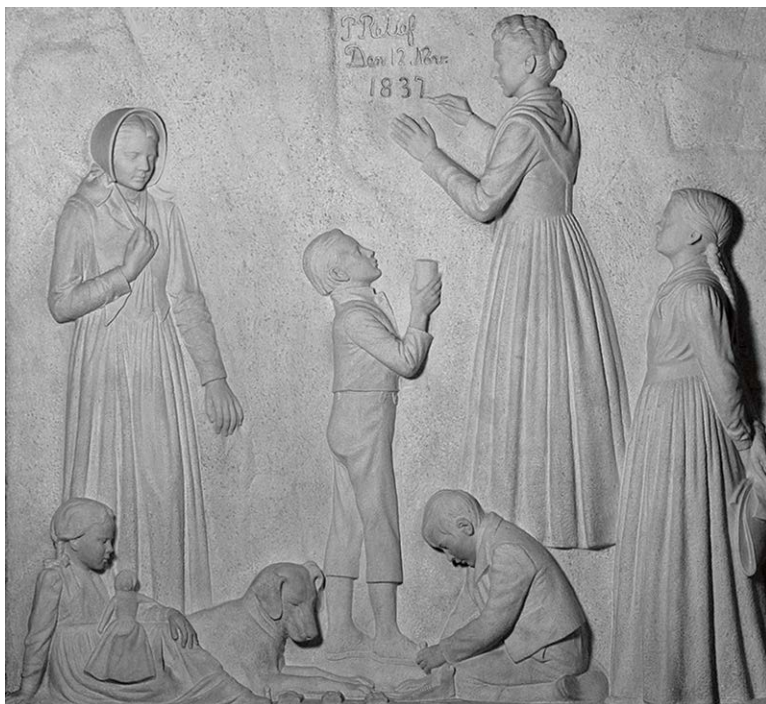
Tijdens mijn reis door Zuid-Afrika en Swaziland in 2001, bezocht ik het monumentale Voortrekkermuseum bij Pretoria. Daar maakte ik deze foto van de muurgravure Die Verblyf by Kerkenberg . Op de voorgrond een Pronkrug.

In de historie van de Rhodesian Ridgeback vallen al snel twee namen: Phu Quoc, een eiland in het zuiden van Vietnam, en Hottentotten (die we nu Khoikhoi noemen), een inheems volk dat in de provincie West-Kaap woonde toen de Nederlander Jan van Riebeeck daar in 1652 een handelspost stichtte. Zowel de honden van Phu Quoc als die van de Khoikhoi hebben een ridge en zo werd al snel een link met de Ridgebacks uit Rhodesië gelegd. De Khoikhoi komen oorspronkelijk uit Noord-Afrika. Ze trokken met hun vee en honden, via Rhodesië (nu Zimbabwe) naar het zuiden van Afrika. Voor wat betreft de honden op het eiland Phu Quoc zijn er twee lezingen. Of ze zijn vanaf Phu Quoc naar Afrika gebracht, of de omgekeerde route is afgelegd. Dan hebben we ook nog de Thai Ridgeback, die voor wat betreft het land van herkomst en de ridge de derde in dit rijtje zou kunnen zijn.