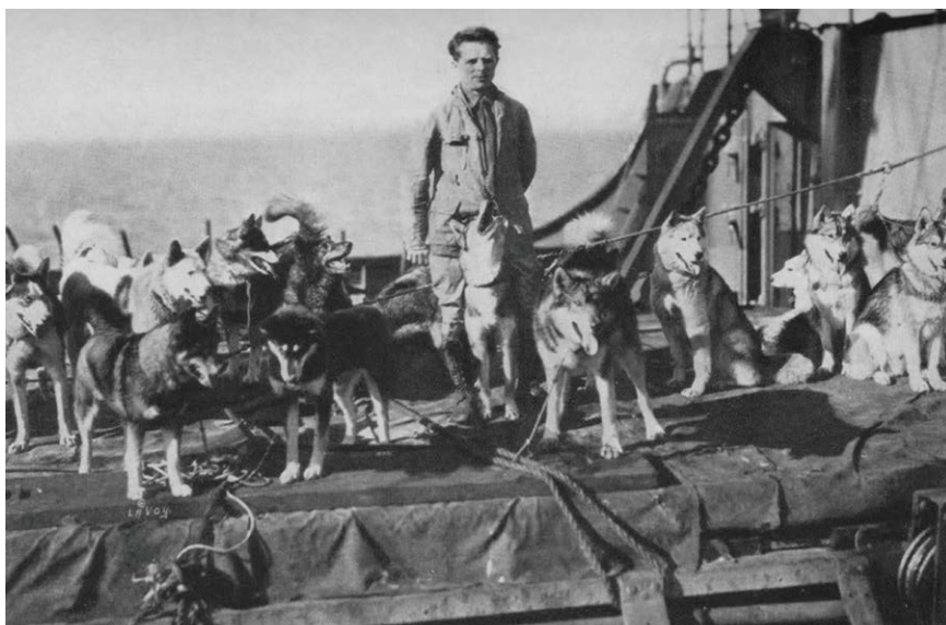
Een legendarische naam in Husky's is die van de Noor Leonhard Seppala, één van de beste 'Alaskan Dog Drivers' aller tijden. Hij is hier gefotografeerd met één van zijn teams.

Bij het woord sledehond denken de meeste mensen in eerste instantie aan een Siberian Husky. En inderdaad, dit is het meest populaire ras bij de sledehondensport*. Hij is geschikt voor het trekken van lichte lasten, het afleggen van lange afstanden en behaalt daarbij een hoge gemiddelde snelheid. Het over het algemeen verdraagzame karakter maakt de Husky een teamplayer bij uitstek. Dit ras heeft grote behoefte aan gezelschap; dat kunnen soortgenoten of mensen zijn. In de afgelopen jaren heeft hij ook als huishond en tentoonstellingshond furore gemaakt. Zijn baas moet kunnen omgaan met een eigenzinnig temperament en met een soms aan fanatisme grenzende jachtpassie.