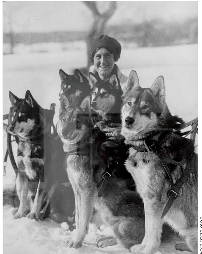
Foto circa 1934

Huskybezitters in Amerika spreken over een 'Seppala Siberian' als ze Husky's bedoelen met een stamboom die