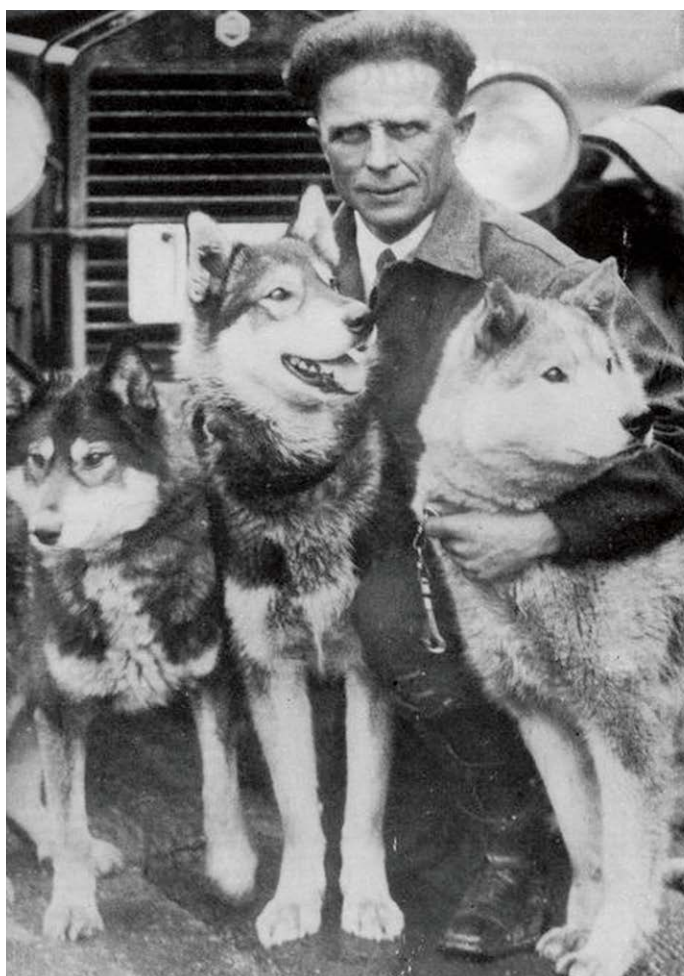
Leonhard Seppala met drie van zijn honden. Hij is één van de beste 'Alaskan Dog Drivers' aller tijden en bezeten van de sledehondensport. In 1915, 1916 en 1917 wint hij de Alaska Sweepstakes. De 'Seppala Memorial Race' is naar hem genoemd.

In 1908 wordt de Nome Kennel Club opgericht, met als doel wat orde in de competities te brengen. In 1909 wordt