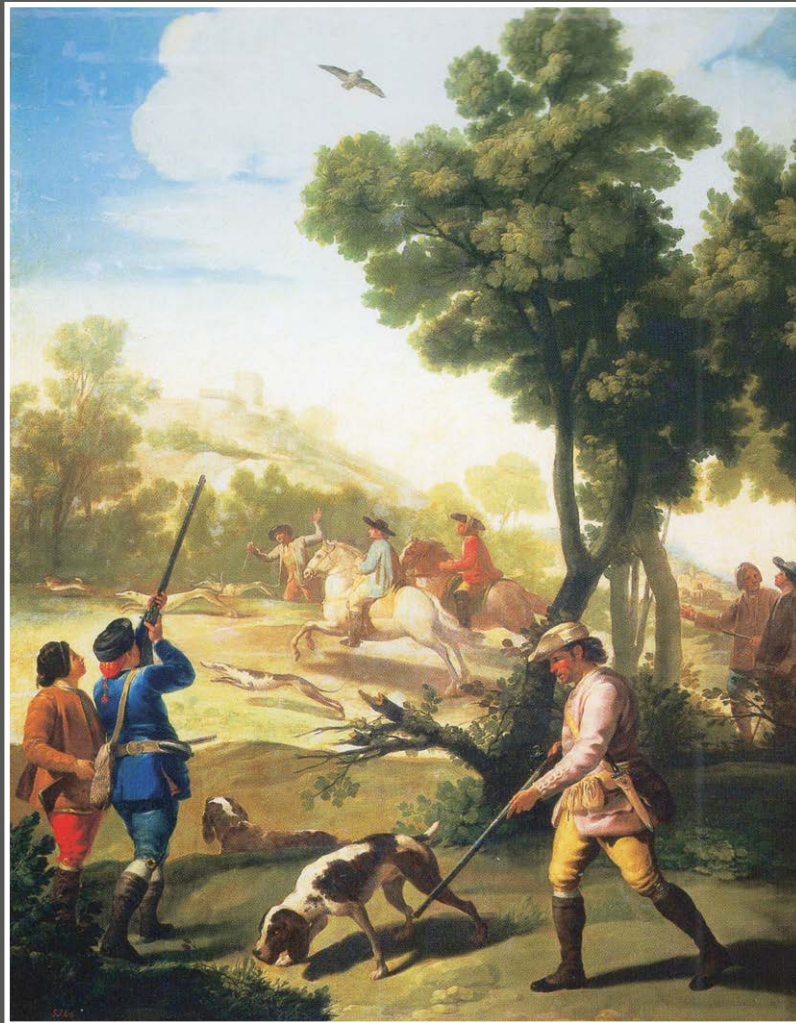
Collectie: Prado Museum, Madrid.