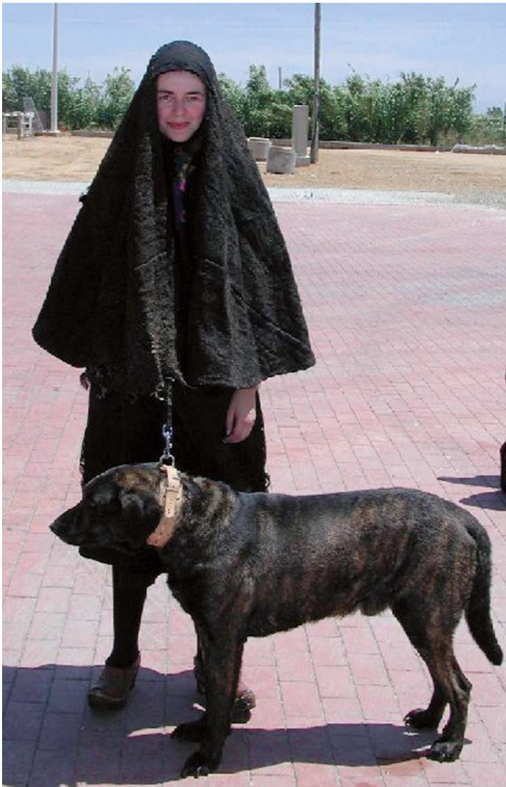
Sommige inwoners van Castro Laboreiro - de Castrejos – dragen nog de typische kleding van vroeger: sandalen met houten zolen, grove wollen slobkousen en het hoofd bedekt met een hoed en een mantel.