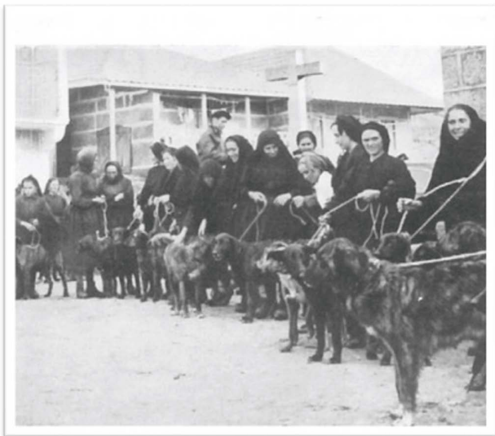
Dorpelingen uit Castro Laboreiro met hun honden. De foto is rond 1903 gemaakt.