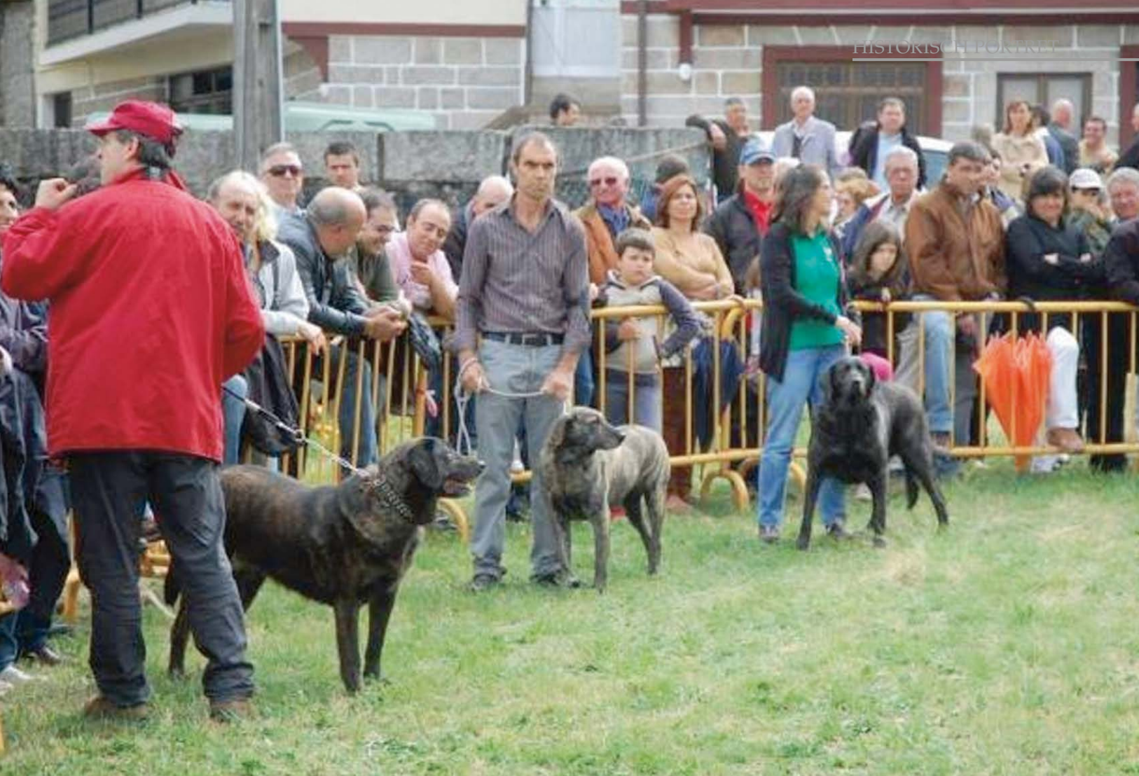
De Castro Laboreiro is weliswaar een zeldzaam ras, maar is in Portugal vrij regelmatig op tentoonstellingen te zien.

een donker masker en een kortharige vacht. De schouderhoogte is circa 60 centimeter. Andere kynologen, zoals K.H. Finger in zijn boek Hirten- und Hütehunde (1988), melden dat de reuen tussen de 56 en 70 centimeter hoog zijn en de teven tussen 52 en 57 centimeter.