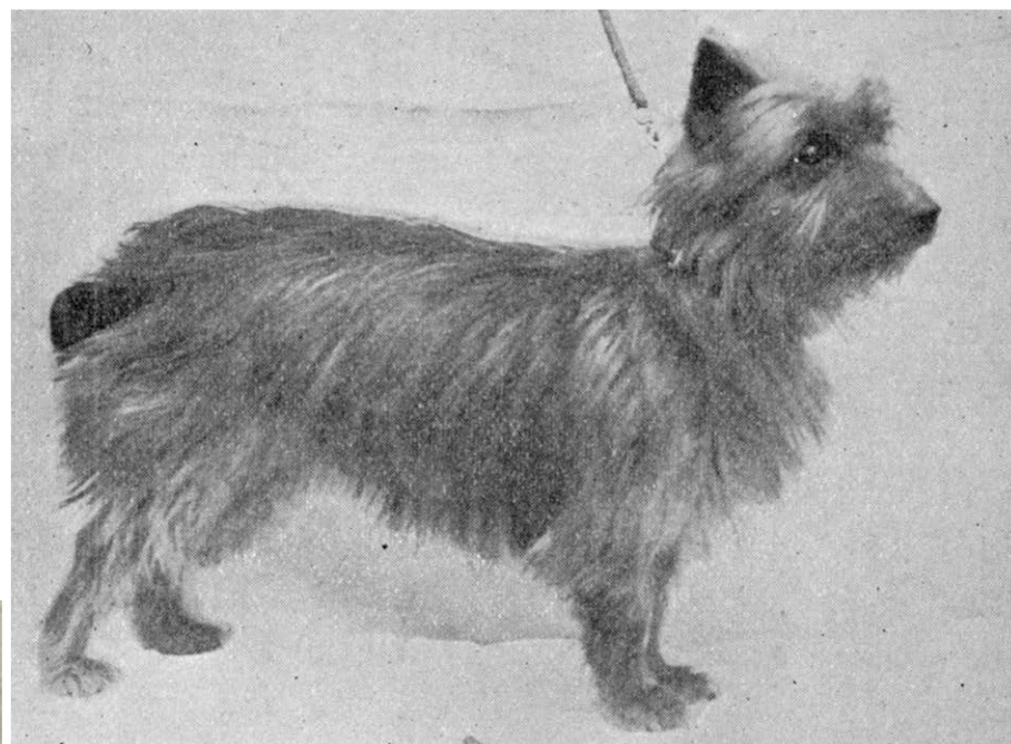
Uit: Bellby, The Dog in Australasia, 1897.