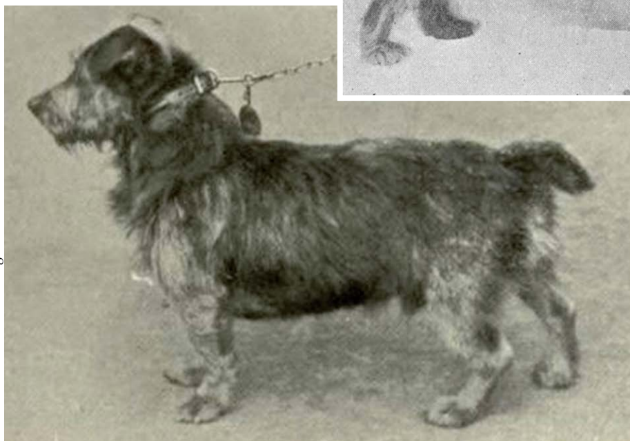
Uit: The New Book of the Dog.