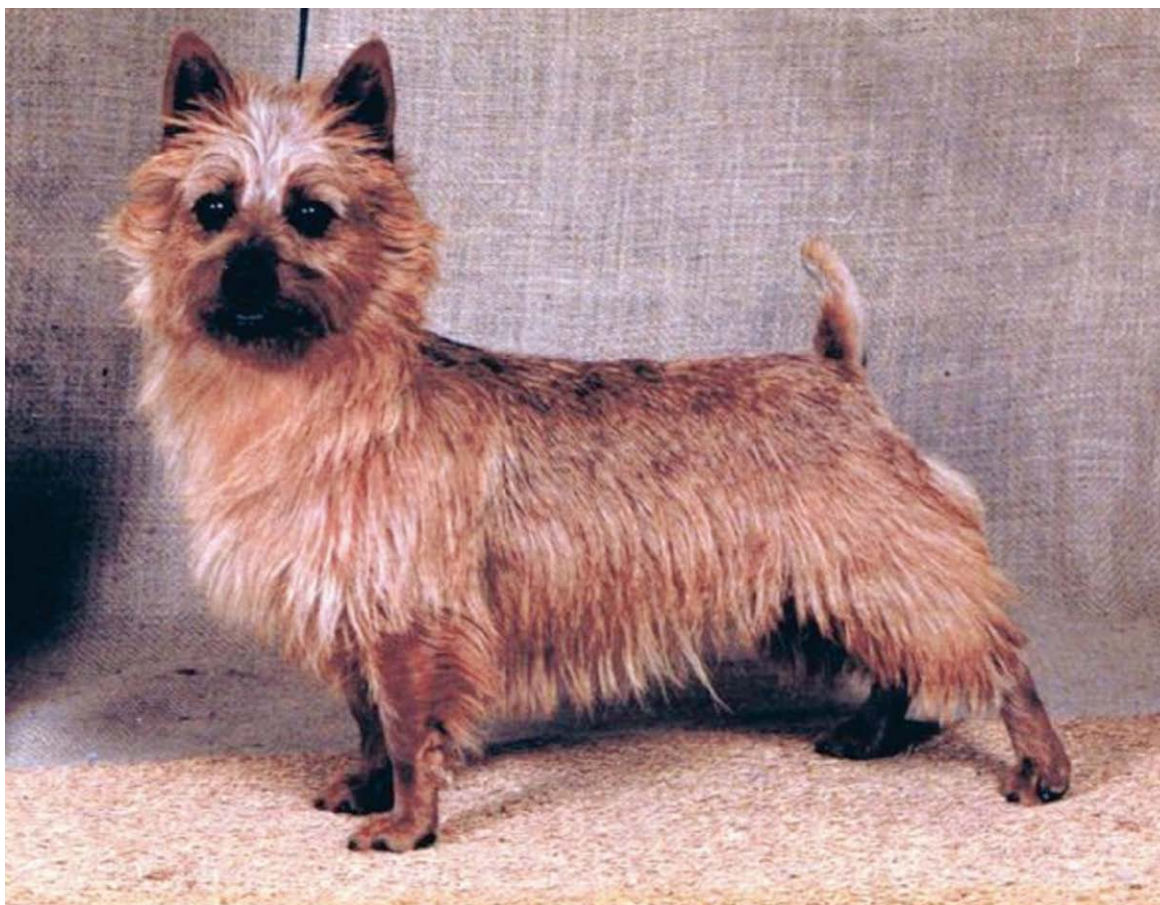
Ch Alizarin Melody in Red, een van de top Australian Terriers.

blijft het de gemoederen bezighouden. Onder het pseudoniem 'Scotch Terrier' schrijft iemand in 1888: ... "the rough (coated) terrier is an unmitigated mongrel and only fit to use where snakes were too numerous to risk a dog of any value ... We must be thankful that the Victorian Poultry and Dog Society (VP&DS) has not allowed the name Australian to be prostituted to such vile uses." (De ruwharige terrier is een absolute bastaard en alleen nuttig op plaatsen waar de slangen te talrijk zijn om het leven van een hond van enigerlei waarde te riskeren. We mogen dankbaar zijn dat de VP&DS niet heeft toegestaan dat de naam 'Australian' voor dergelijk verfoeilijk gebruik geprostitueerd wordt.) Hoewel hier van dik hout planken worden gezaagd, meldt de Weekly Times in 1909 dat de Victorian Poultry and Dog Society de naam Australian Terrier toestaat. (De naam Victorian Poultry and Dog Society wordt in 1895 gewijzigd in Victorian Poultry and Kennel Club.)