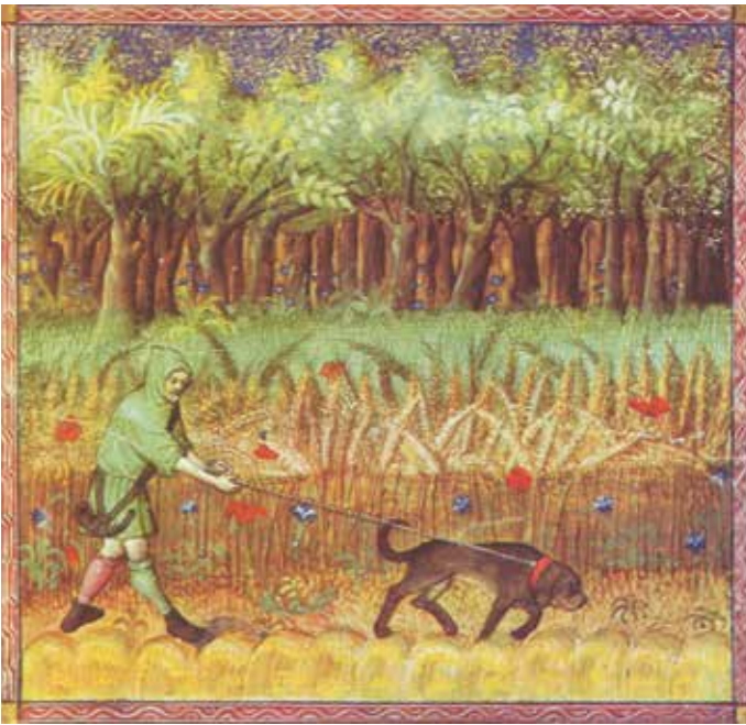
Illustratie uit het vijftiende-eeuwse handschrift met miniaturen Le Livre de la Chasse . Een van de eerste duidelijke afbeeldingen van een jager met zijn Leithund. (Bibliothèque Nationale, Parijs.)

sche Jägerhof' (1677). In 1771 'fuseren' deze beide, waarschijnlijk uit kostenoverwegingen. Soms vormen deze Jägerhofe dorpjes op zich met een hoefsmid, een kok met keukenpersoneel, boswachters, etc. Het geschoten wild wordt in de keuken klaargemaakt en opgediend aan de adellijke en vorstelijke tafels.