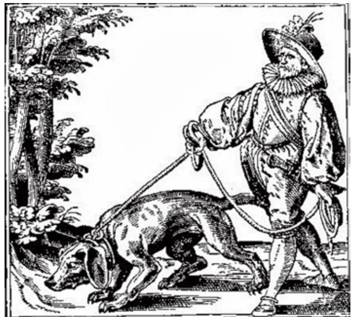
Jager met een Leithund, zestiende eeuw. Het beeld van de Hannoveraanse Zweethond is hierin al te herkennen.