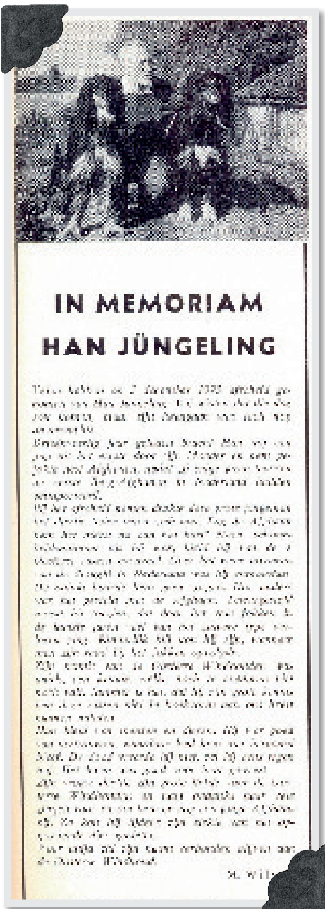
Een In Memoriam voor Han Jüngeling in De Hondenwereld , januari 1974, geschreven door de secretaresse van de rasvereniging, mejuffrouw M. Wilson.

1945 en daarna nog niet zijn opengesteld. Interessanter is het om je af te vragen wat een intelligente dertiger, een kynoloog van naam, een zeer gewaardeerd keurmeester, een eigenaar van zeer invloedrijke dekreuen en een getalenteerde kunstkenner drijft om zich uit eigen beweging zeer actief bij de bezetter aan te sluiten.