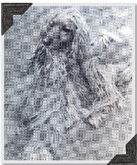
De reu Baber of Baberbagh (1928-1941), een zoon van Sirdar of Ghazni, die de stamvader is van de Barukhzy fokkerij.