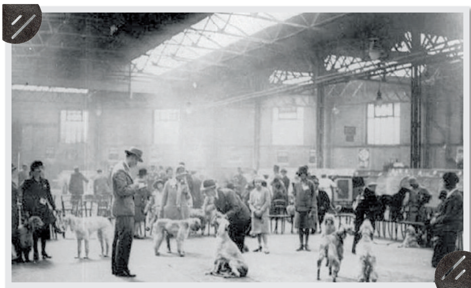
Olympia, Londen, 1930. Keurmeesters en exposanten van Afghaanse Windhonden dragen hoeden en (mantel)pakken. Those were the days...