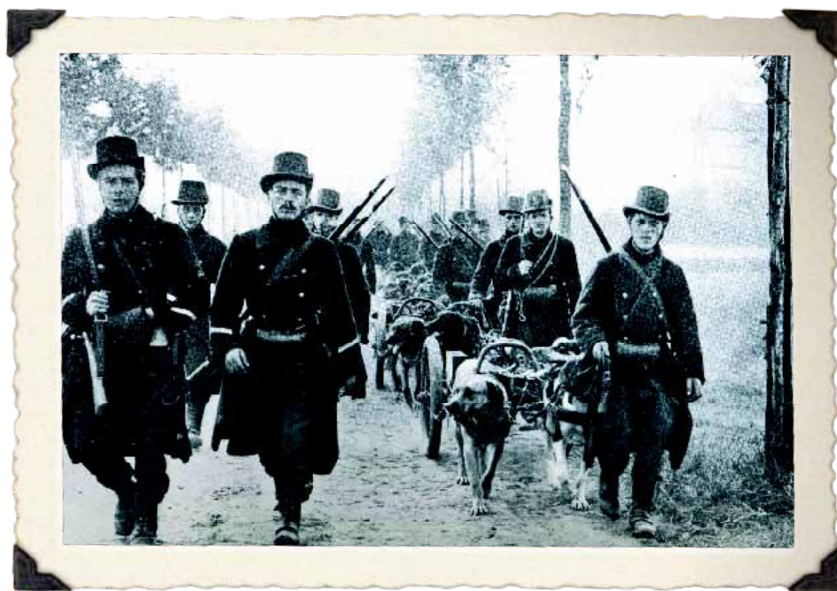
Het regiment Karabiniers van het Belgische leger in de Eerste Wereldoorlog. De Belgen zijn pioniers bij het gebruik van honden. Deze honden zijn allemaal van het Matin type.