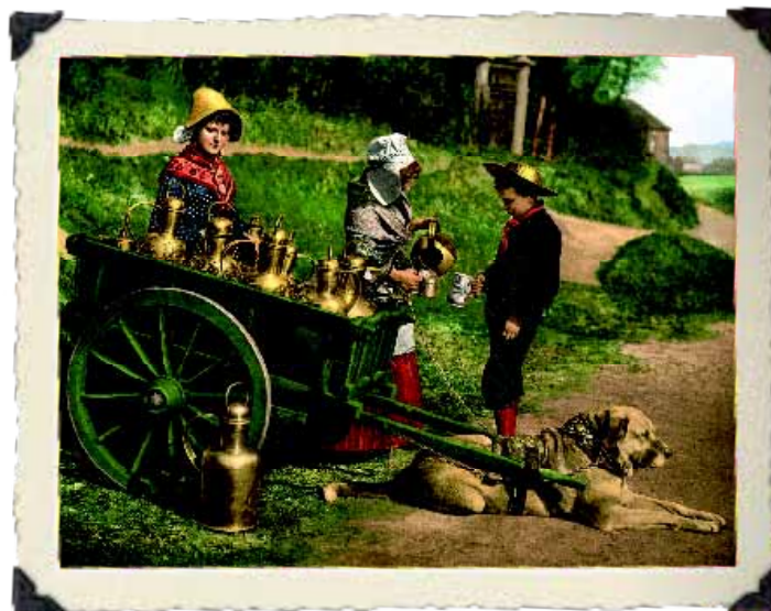
Een prachtig voorbeeld van trekhonden in België (1890). Deze kar wordt getrokken door maar liefst vijf honden, van wie de tweede van links een echt Matin Belge type is.