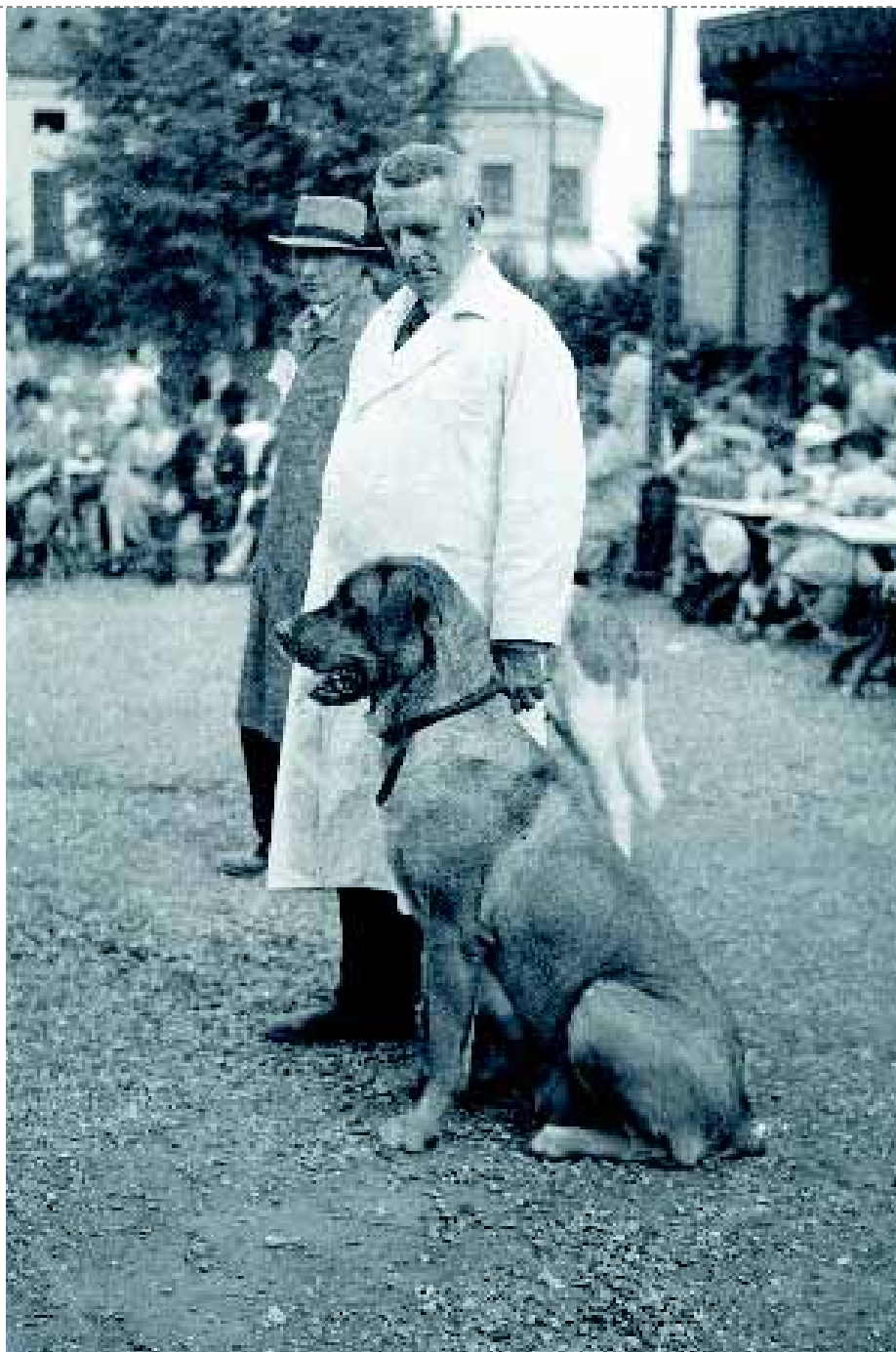
De foto die Arthur Weisz in 1938 maakt van de Matin Belge 'Buffelwiedu' van mejuffrouw J.H. Pauw.

Een heel typerend plaatje uit deze serie oude foto's: de muzikant in de tuin van 'Muis Sacrum', een handler in een schone, hagelwitte jas en een zittende hond – een Matin Belge. Geen alledaagse