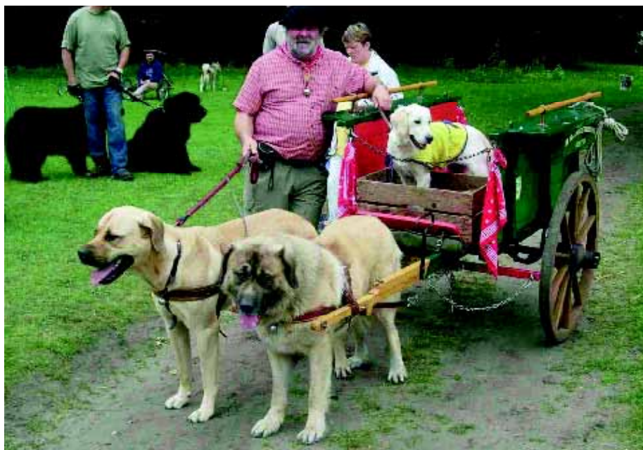
Nu trekken Matins in België alleen nog maar recreatief de karretjes, zoals op hondendagen, erfgoeddagen, enz. Deze foto wordt genomen in 2008 in Beervelde (België) tijdens de 'Hondsdolle Dag'.

trekkracht moet leveren. Zo lezen we dat hij zal gebouwd zijn op het model van 't zwaar en tevens snel trekpaard en dat zoveel mogelijk aan het type van den vroegeren bullhond of matin gelijken. De kleur moet bij voorkeur vaalrood zijn, met een zwart masker. En: de kop dik en breed, wel gevormd met gezicht eerder kort of: de bek zal breed en machtig zijn, de hals rond, kort en dik. Voorts: de lenden zullen kort, breed, gespierde en recht zijn, in staat een straffe drukking der hand te kunnen doorstaan zonder dat het dier buige. En tot slot deze: de bil weze sterk, breed en gespierd. De hoogte is 60 tot 80 cm en het gewicht zo'n 50 kilo. Wat over het temperament wordt gezegd heeft te maken met de taak van de hond: De aard zal zenuwachtig en bloedrijk zijn, zonder te veel driftigheid. Gedweeheid: De hond zal oogenblikkelijk en in alle omstandigheden aan de stem zijns meesters gehoorzamen. Ingespannen zijnde, zal hij voldoen aan de volgende bevelen: Rechts, links, vooruit, draai, ho. Hij zal de kar met eene vracht van 200 tot 300 kilo zonder moeite vervoeren.