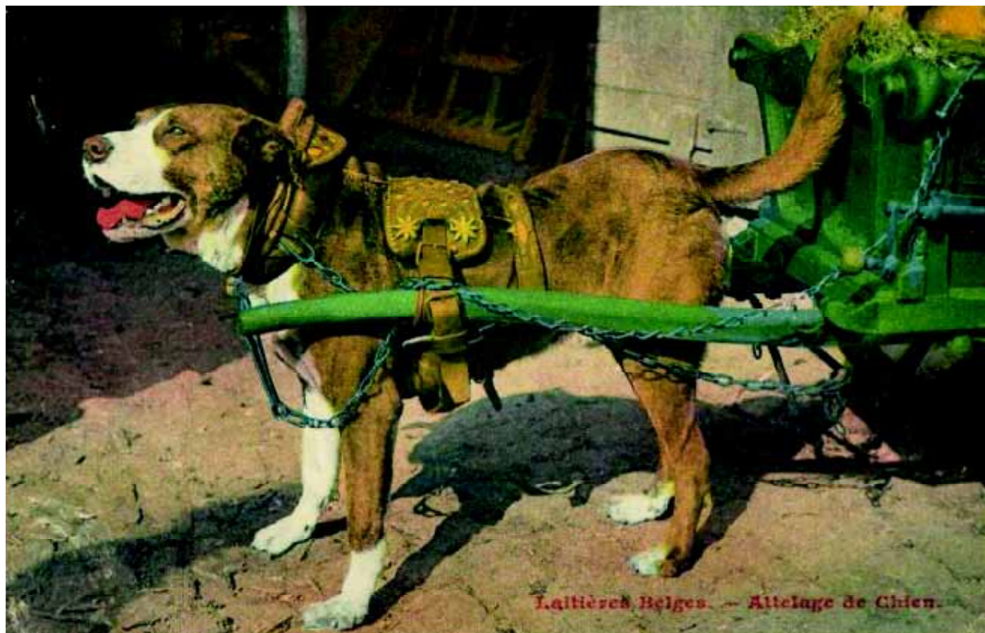
Een prachtige afbeelding van een Matin type trekhond van een melkkar in België. Let even op het prachtige tuig van de hond.

Meer informatie vindt u op de websites: www.belgischemastiff.be en www.debelgischemastiff.be Adres: Zijpstraat 106B, B-2570 Duffel, tel.: (+32)(0)15/ 32 35 65, fax: (+32)(0)3/454 65 33 of e-mail: warnickhove@hotmail.com