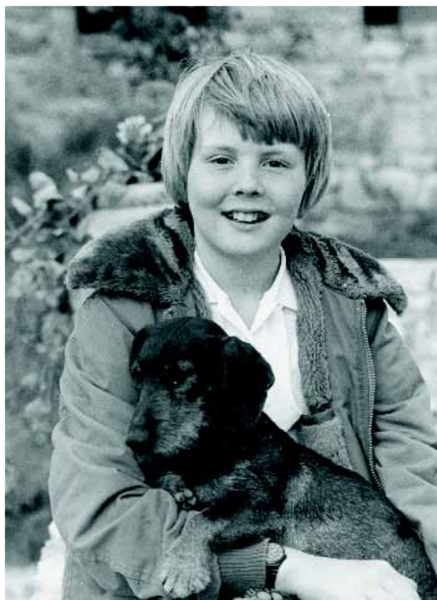
Prins Willem-Alexander met de Teckel 'Arthus'. Deze foto wordt door prins Claus gemaakt.