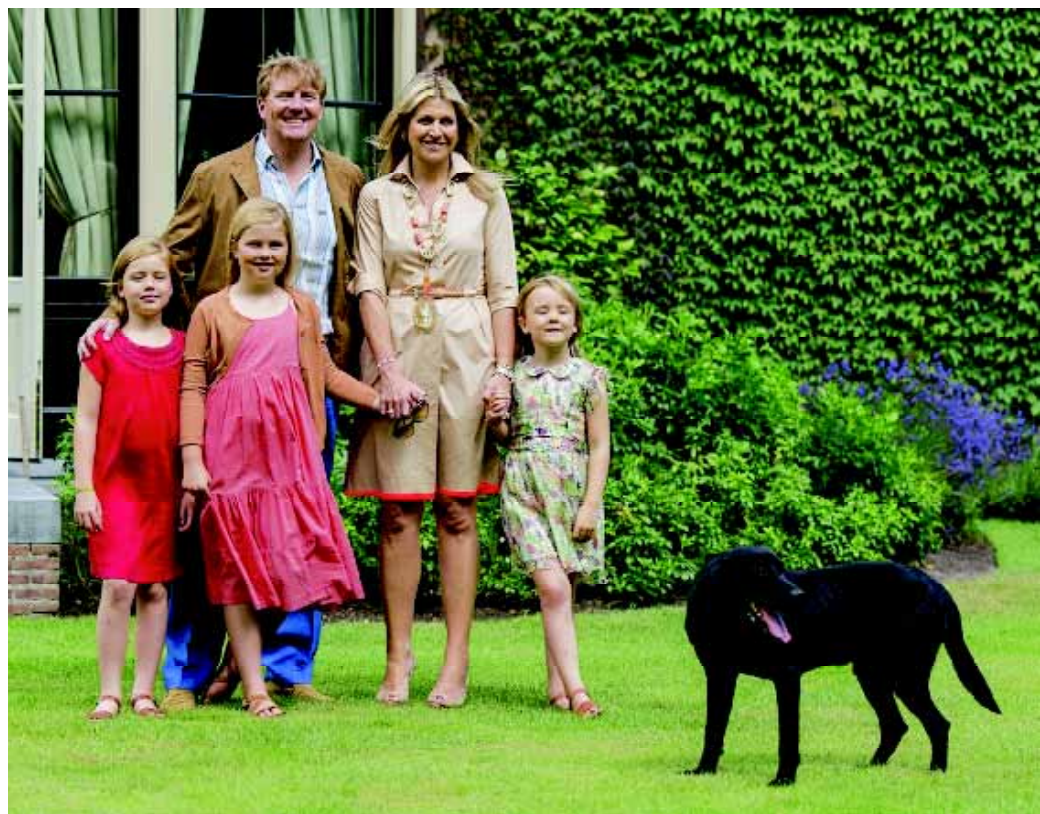
De jaarlijkse fotosessie in juni 2013. Van links naar rechts: koning Willem-Alexander, voor hem de prinsesjes Alexia en Amalia, koningin Máxima en prinses Ariane. De pers maakt op die dag kennis met ‘Skipper’, een voor de jacht getrainde Labrador Retriever.

In Onze Hond van mei 2013 is een foto afgedrukt van Beatrix, Irene en Margriet met een Berner Sennenhond. Een opletende lezer meldt mij dat zijn naam waarschijnlijk Barry von Melchsee luidt en dat hij toebe-