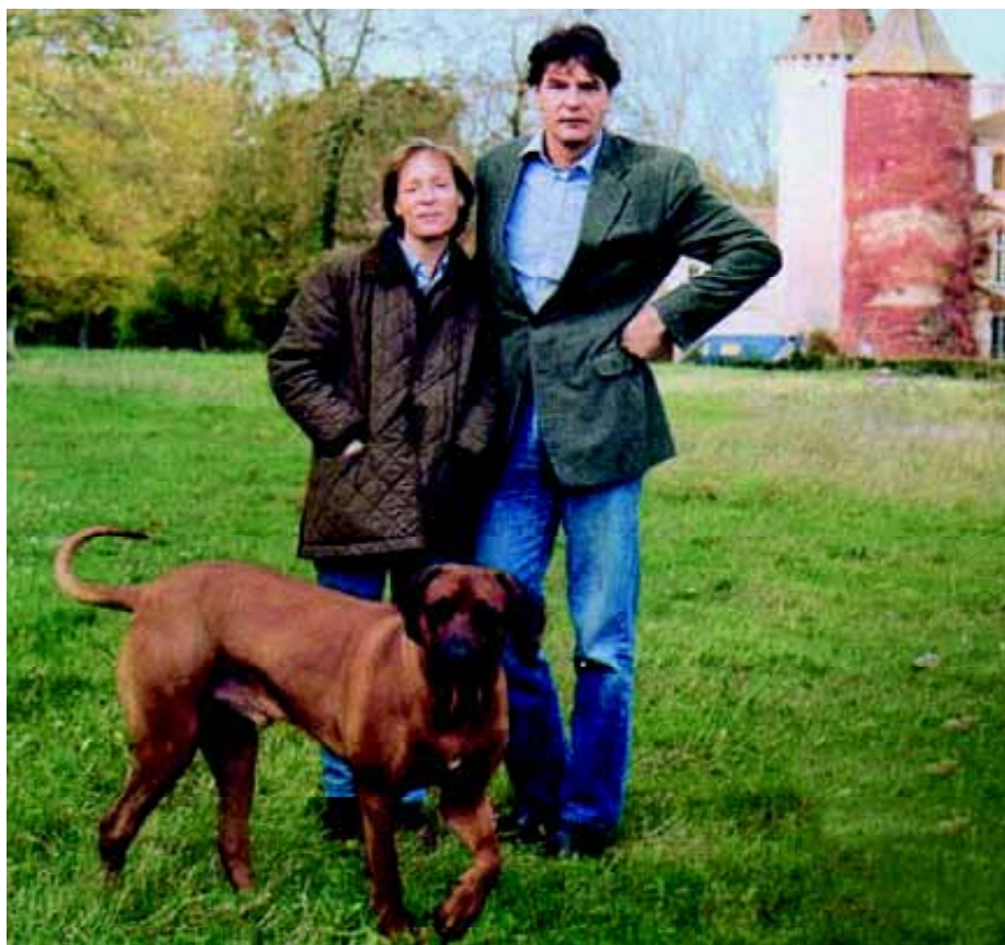
Na hun huwelijk wonen prinses Margarita en Edwin de Roy van Zuydewijn in het Zuid-Franse Chateau du Bartas in Saint-Georges. Ze poseren met Rhodesian Ridgeback 'Paco' voor de artikelenreeks 'Oranjabitter' in HP/De Tijd.

Als prinses Margriet nog een tiener is, wordt ze diverse malen met een