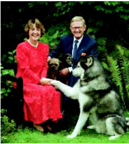
Prinses Margriet en mr. Pieter van Vollenhove met hun Alaskan Malamute reu 'Gimmi' van het Huize Het Loo' en twee Border Terriers.