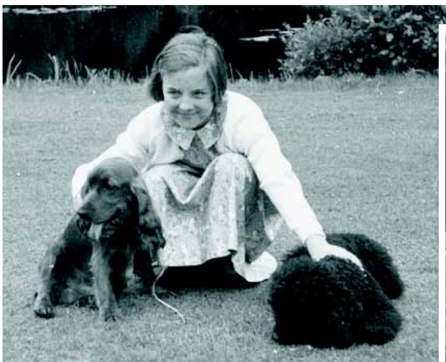
Prinses Margriet met een Engelse Cocker Spaniel en een Poedel.