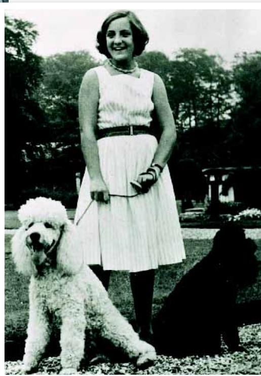
Prinses Margriet is al vroeg een hondenliefhebster. Hier staat ze (1957) met de grote witte Poedel van haar vader en een kleinere zwarte Poedel.