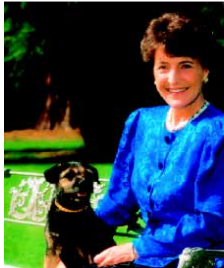
Prinses Margriet in 1990 met Border Terrier 'Topper'.