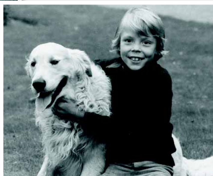
Ook in 1977 fotografeert prins Claus zijn jongste zoon Constantijn met de Kuvasz 'Buster' (officieel Derö Aba).

hoort aan prinses Christina. Na de geboorte van de jongste prinses ontstaat bij de Utrechtse Rashonden Vereniging het idee om de jongste prinses een geschenk te overhandigen. De tentoonstelling van de URV in november 1948 is een groot succes, mede door de aanwezigheid van een grote delegatie deelnemers uit Zwitserland, die onder leiding van de Zwitserse gezant in Nederland zorgen voor een wervelend optreden in de erering: In het midden van de ring verscheen een groep in klederdracht gestoken Zwitsers, die hunne liefhebberijen verdeeld hebbende tussen zang en de kynologie enige fraai uitgevoerde jodelliederen ten beste gaven. Een uitvoering overigens die 's avonds om 8.15 uur via de AVRO te beluisteren viel, daarmede tevens de aandacht van alle luisteraars op de kynologie vestigend , aldus 'De Hondenwereld' van 1 december 1948. Het zijn deze Zwitsers die voor de prinses – toen nog Marijke – een hond vanuit Zwitserland meenemen