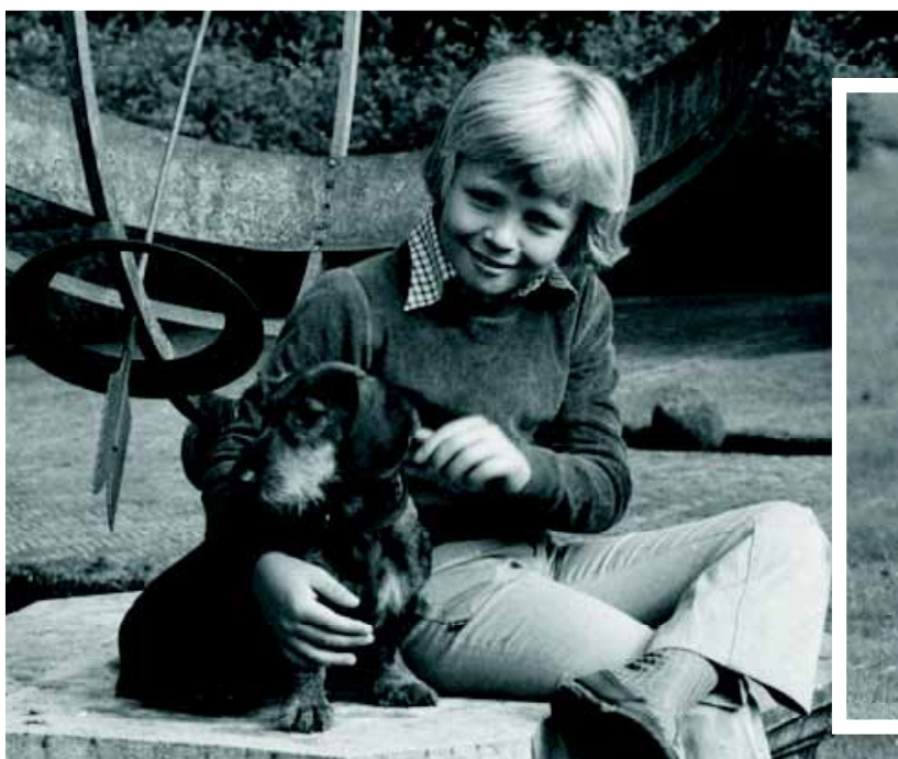
Een prachtige foto uit 1977: prins Friso en Teckel 'Arthus' op 'Drakensteyn'.