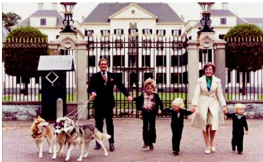
De Van Vollenhovens met hun drie Siberische Husky's uit de befaamde 'Anadyr' kennel in Alaska. Daarmee worden ze, met hun oudste drie zonen, voor de ingang van Paleis Het Loo gefotografeerd. Van links naar rechts: Pieter van Vollenhoven, prins Maurits, prins Bernhard jr., prinses Margriet en prins Pieter-Christiaan.

In Onze Hond van maart 2013 – in het artikel 'Honden aan het Hof' – staat een foto van het toen nog verloofde paar met twee Labrador Retrievers, een zwarte en een gele, Sunny en Zorro.