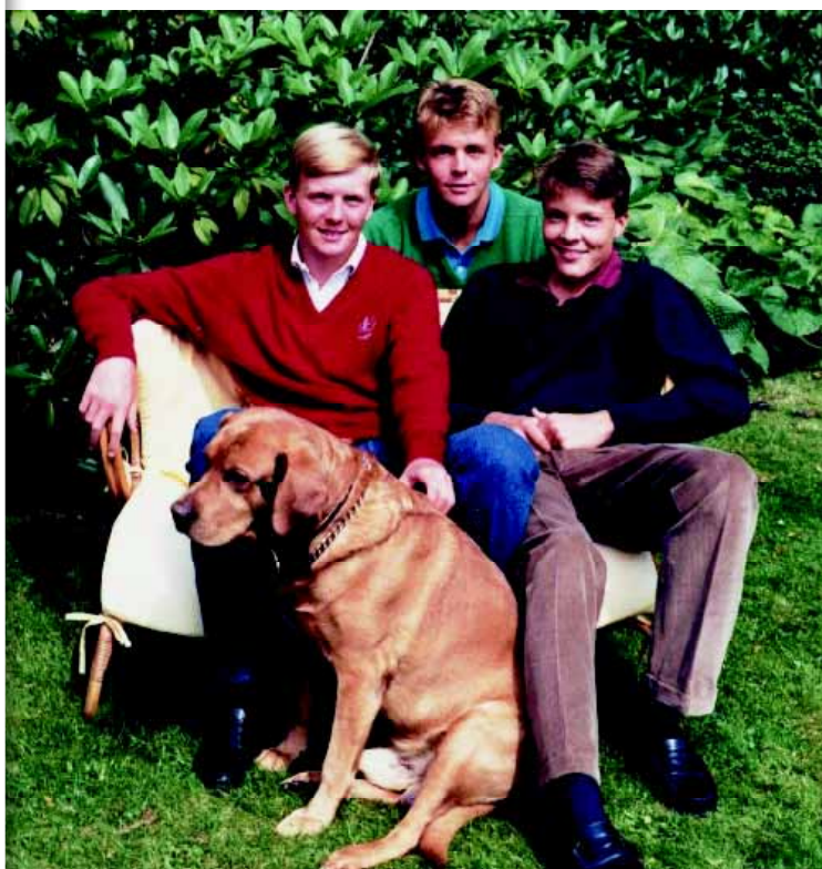
In de jaren tachtig maakt prins Claus deze foto van zijn drie zonen met Labrador Retriever 'Kerry'. Van links naar rechts: prins Willem-Alexander, prins Friso en prins Constantijn.

zwarte Poedel gefotografeerd, zo te zien een Middenslag. Hij zit bij haar als de vier prinsessen picknicken, maar ook in haar meisjeskamer en als ze samen met prinses Christina wordt gefotografeerd in een speelhuisje. De manier waarop Margriet naar de hond kijkt spreekt boekdelen; ze houdt van de Poedel.