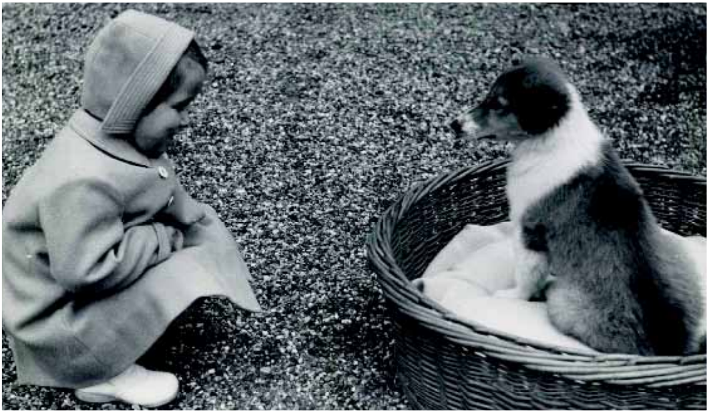
Prinses Marijke – later Christina – in 1950 met een Collie, die 'Pup' wordt genoemd.

Behalve hun staatsrechtelijke verplichtingen kennen zij, hoe verschillend ook, daarnaast een gezins- en familieleven. Spelen honden daarin een rol? En zo ja, welke? In een serie van vijf artikelen een beeld van de honden in onze Oranjefamilies. Deel 1, 2, 3 en 4 verschenen in ONZE HOND april, juli en oktober 2013 en januari 2014. Deze maand deel 5: De nieuwe generatie: 'Huis ten Bosch', 'Villa Eikenhorst', 'Margaritagate' en 'Apeldoorn'.