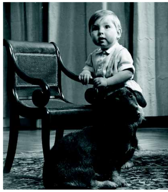
De oudste zoon van prinses Margriet, prins Maurits, groeit op met verschillende hondenrassen. Hier is hij als peuter gefotografeerd met een Teckel.